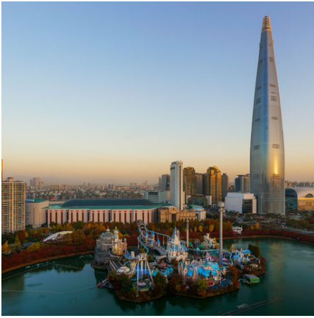
Seoul Skyline, Südkorea