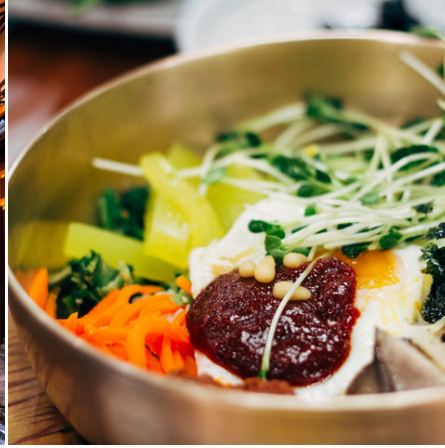
Bibimbap in Jeonju, Südkorea