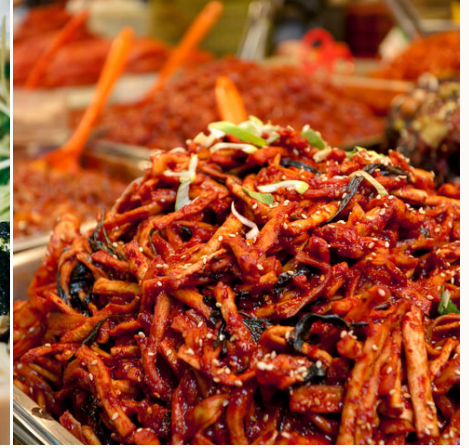
Was wäre Südkorea ohne Kimchi?, Südkorea