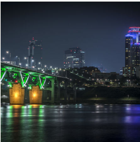
Lichter am Han River, Südkorea

Die 25-tägige Reise gibt Ihnen Zeit viele verschiedene Facetten Japans & Südkoreas ausgiebig kennenzulernen. Nicht nur die klassischen Ziele, wie Tokio, Kyoto und Seoul werden Sie beeindruckten. Erst die kleinen Orte mit ihrer traditionellen Architektur, ihrem ureigenem Charme und ihren lokalen Köstlichkeiten machen die Reise zu einer authentischen Erfahrung. Die Übernachtungen in drei verschiedenen traditionellen Unterkünften werden ein Erlebnis sein, werden doch so oder so ähnlich seit Jahrhunderten Gäste untergebracht. Lassen Sie sich überraschen. Gern können wir die Reise an Ihre Wünsche anpassen.