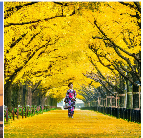
Ginkgo Baumallee in herbstlichen Farben, Tokio, Japan