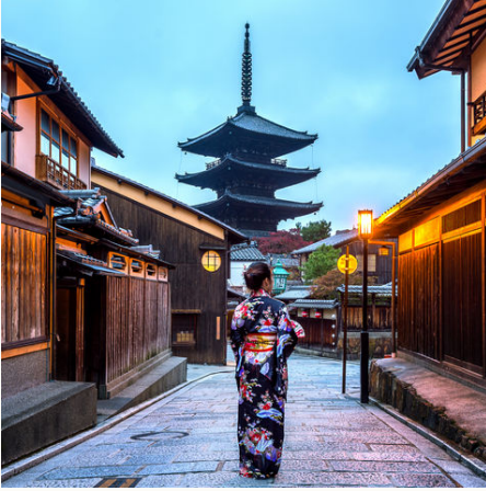
Spaziergang in Kyoto in der Dämmerung, Japan