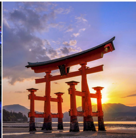
Torii in Miyajima, Japan