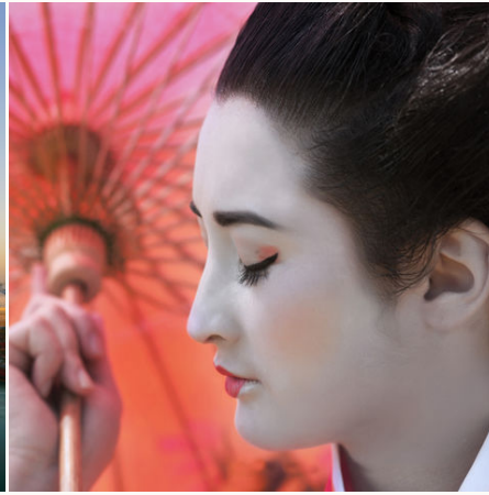
Geisha im Kimono, Japan