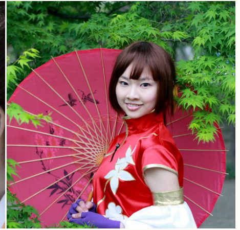
Geisha in traditioneller Kleidung, Japan