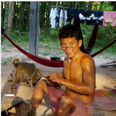
Einheimischer in der Nähe von Angkor, Kambodscha