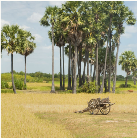
Reisfeld mit Ochsenkarren, Kambodscha