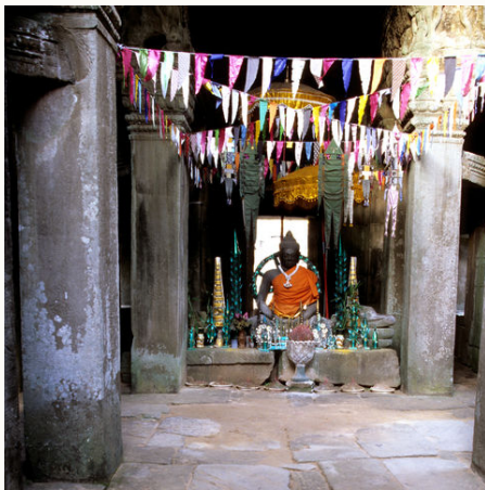
Ein Schrein in den Angkor Wat Ruinen, Kambodscha

Veranstalter: a&e erlebnis:reisen eine Marke der Boomerang-Reisen GmbH Stand: 29.10.2025 (SP)