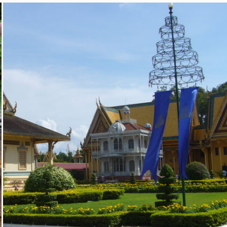
Blick auf den Pavillon von Napoleon, Kambodscha