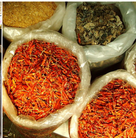
Gewürze auf dem Markt, Kambodscha