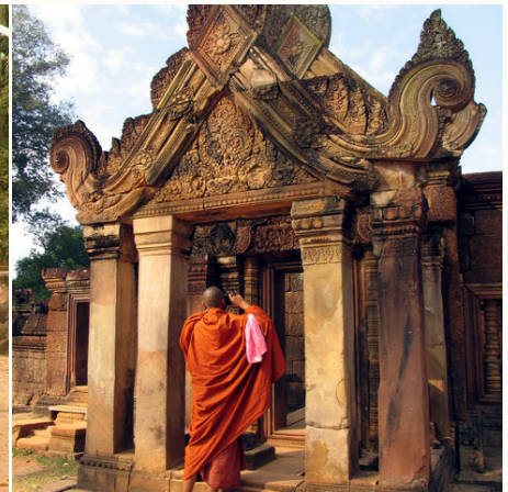
Mönch beim fotografieren des Banteay Srei Tempel, Kambodscha