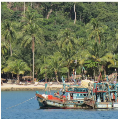
Blick auf ein Fischerboot, Kambodscha

Sihanoukville oder Kampong Som, eine junge Stadt am Meer, liegt auf einer Halbinsel am Golf von Thailand und ist an drei Seiten von Stränden (unter anderem dem Otres Beach) mit wogenden Kokosnusspalmen umgeben. Vom Strand und den umliegenden Hügeln können Sie die vorgelagerten Inseln sehen, die zu einem Bootsausflug locken. Genießen Sie die Gastfreundschaft der Khmer und lassen Sie einfach die Seele baumeln. Kep liegt an der Südküste Kambodschas ganz in der Nähe der vietnamesischen Grenze. Der kleine Ort war in den 60-er Jahren als Badeort der Reichen und Mächtigen sehr beliebt. Heute wird er sowohl als Ausflugsziel von Einheimischen, als auch als Badeort von Touristen geschätzt. Der Küstenort bezaubert durch seine Ruhe und köstliche Meeresfrüchte (insbesondere Krabben). Koh Kong liegt an der Westküste Kambodschas in der Nähe der thailändischen Grenze. Hier wartet eine ganz besondere Unterkunft mitten im Dschungel auf Sie: das Canvas & Orchids Retreat am Tatai Fluss mit ihren insgesamt 12 luxuriösen Zelten! Jedes der Zelte steht auf einer eigenen Schwimm-Plattform. Genießen Sie die einzigartige Atmosphäre und lassen Sie sich begeistern!