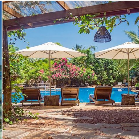
Blick auf den Pool, Kambodscha