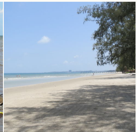
Weite Strandabschnitte in Sihanoukville, Kambodscha