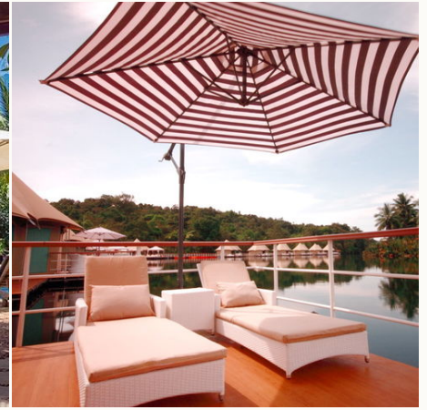
Die Terrasse einer Lodge, Kambodscha