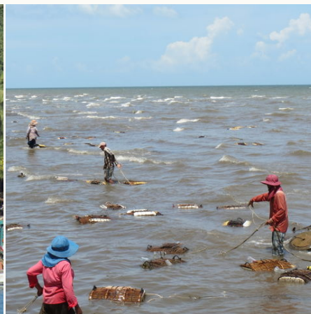
Krabbenmarkt in Kep, Kambodscha