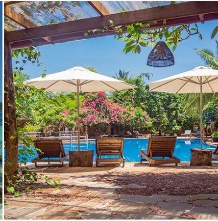
Blick auf den Pool, Kambodscha