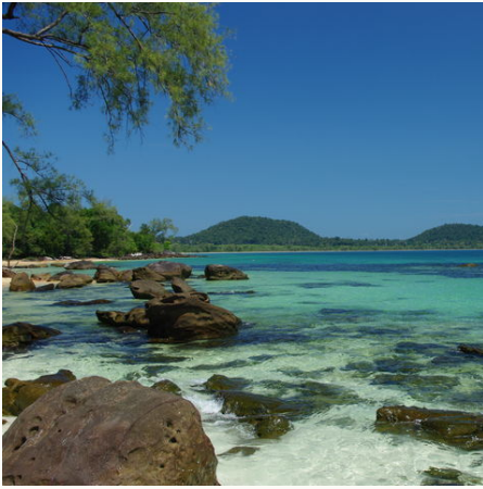
Blick auf die Insel Koh Rong neben Sihanoukville, Kambodscha