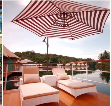
Die Terrasse einer Lodge, Kambodscha