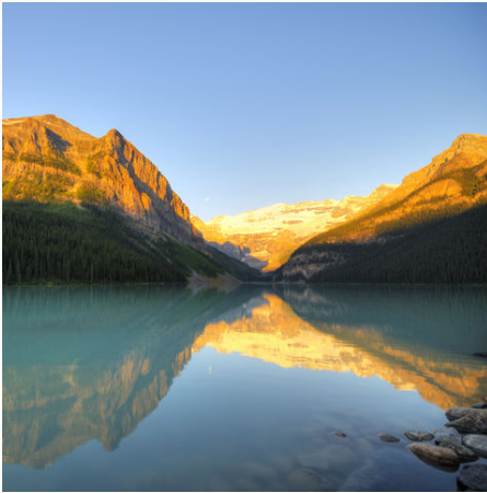
Der Lake Louise im Sonnenlicht, Kanada

"On the road" durch die besondere Kulisse von Kanadas Westen! In den berühmten Rocky Mountains und an den ruhigen Seen im Tal lassen Sie die wilde Natur auf sich wirken, entschleunigen die Tage und halten diese außergewöhnlichen Augenblicke für immer fest. Entdecken Sie die bedeutendsten Nationalparks im Gebirge am Boden und aus der Luft, lernen Sie die Landschaft vom Rücken der Pferde aus kennen. Erleben Sie echtes Ranch-Feeling und im Kontrast dazu versinken Sie in Ihrem eigenen Moment, wenn Sie mit Skiern durch den Pulverschnee die Abfahrt hinunter sausen.