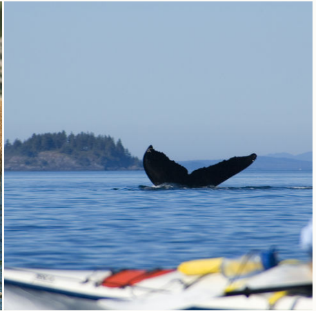
Walflosse vor Vancouver-Insel, Kanada