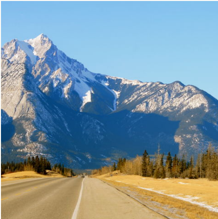
Straße durch die Berge des Jasper-Nationalparks, Kanada