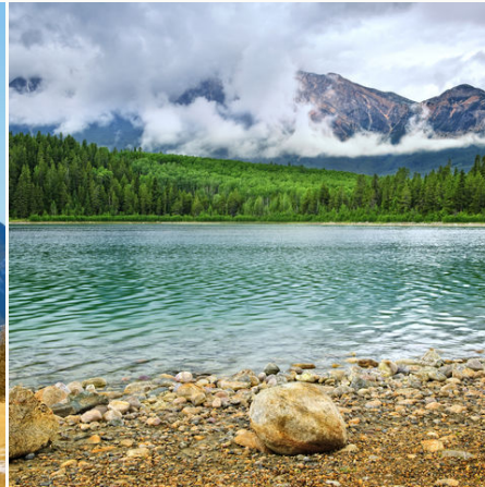
Bergsee im Jasper-Nationalpark, Kanada