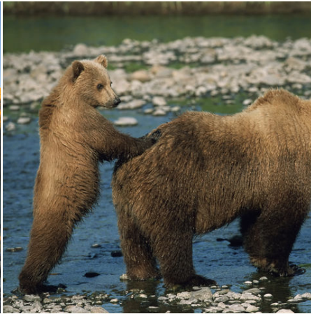
Grizzlybären am Flussufer, Kanada