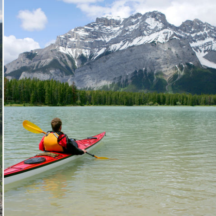
Kajakfahrt im Banff-Nationalpark, Kanada