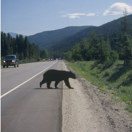
Schwarzbär in der Nähe der Mt. Robson, Kanada

Bitte beachten Sie, dass es bei Reisen z.B. über Weihnachten / Silvester zu Hochsaison-Aufpreisen kommen kann. Gerne machen wir Ihnen auf Anfrage ein konkretes Angebot für diesen Zeitraum.