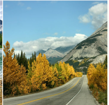
Icefields Parkway, Kanada