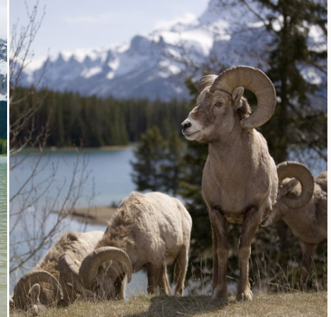
Dickhornsche im Banff-Nationalpark, Kanada