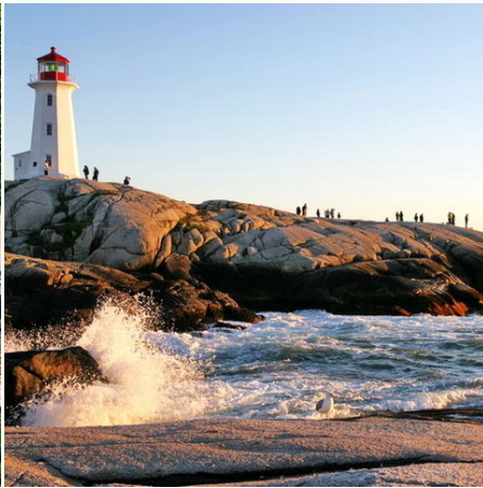
Leuchtturm in Nova Scotia, Kanada