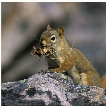
Eichhörnchen auf Futtersuche, Kanada

Bitte beachten Sie, dass es bei Reisen z.B. über Weihnachten / Silvester zu Hochsaison-Aufpreisen kommen kann. Gerne machen wir Ihnen auf Anfrage ein konkretes Angebot für diesen Zeitraum.