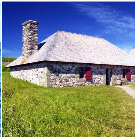
Altes Steinhaus im Fortress-of-Louisbourg-Nationalpark, Kanada