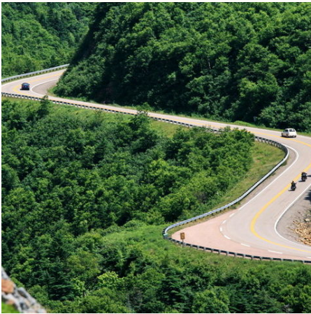
Straße durch den Cape Breton Highlands Nationalpark, Kanada