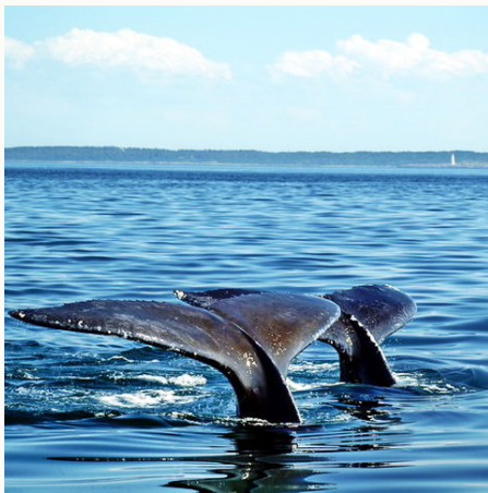
Wale vor der Küste in Ostkanada, Kanada

Veranstalter: a&e erlebnis:reisen ist eine Marke der Boomerang-Reisen GmbH Stand: 03.01.24 (SCHM)