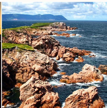
Zerklüftete Küste im Norden von Cape Breton Island, Kanada