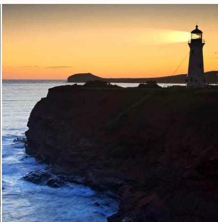
Leuchtturm auf einer Klippe bei Sonnenuntergang, Kanada