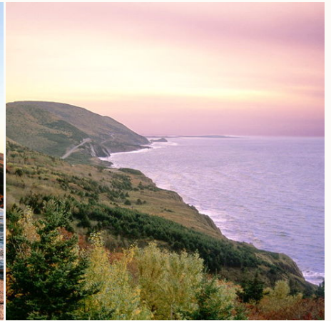
Sonnenuntergang über Cape Breton, Kanada