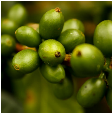
Grüne Früchte der Kaffeepflanze, Kolumbien