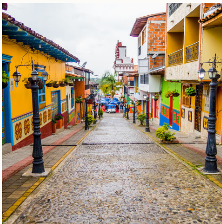
Das vielleicht bunteste Dorf Kolumbiens?: Guatapé, Kolumbien