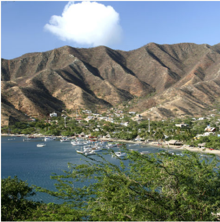
Taganga Bay, Kolumbien

Wir tauchen ein in die beeindruckende Welt der Artenvielfalt und der Kontraste. Diese Reise bringt uns zu einem paradiesischen Fleckchen Erde, welches all unsere Sinne beflügelt. Kolumbien wird uns begeistern! Wir genießen den unverwechselbaren und einzigartigen Geruch des Kaffees auf einer Kaffeefarm in der Region um Calarcá. Mächtig erhebt sich die Gebirgskette der Anden während wir die Wanderwege erklimmen. Wir lauschen den exotischen Geräuschen im Tayrona-Nationalpark, wo sich das klare Wasser gemächlich an die palmengesäumten Sandstrände schmiegt oder gegen die wilden Buchten peitscht.