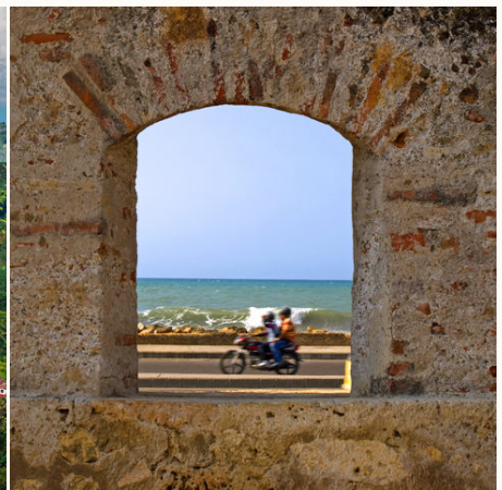
Fenster zum Meer, Kolumbien