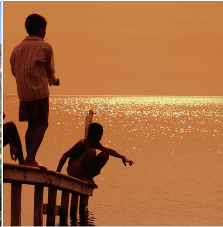
Spielende Kinde auf einem Pier in Santa Marta, Kolumbien