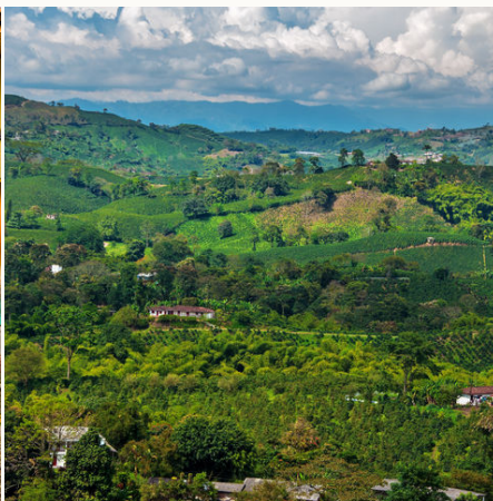
Blick auf die Kaffeeregion, Kolumbien