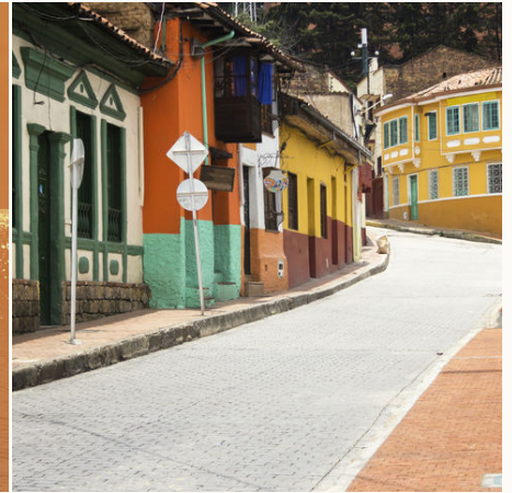
Gasse in der Altstadt Candelaria, Kolumbien