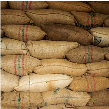
Säcke voller Kaffeebohnen, Kolumbien