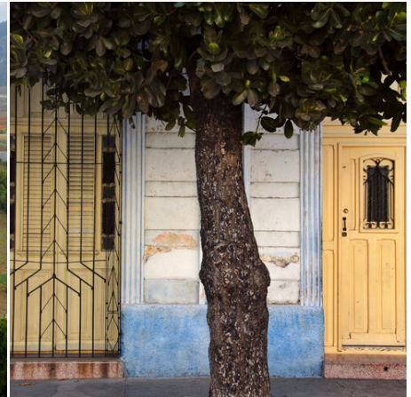
Türen in Cienfuegos, Kuba