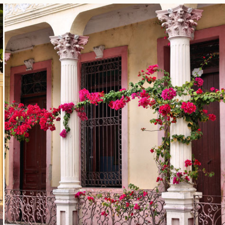
Romantischer Charme von Santiago, Kuba