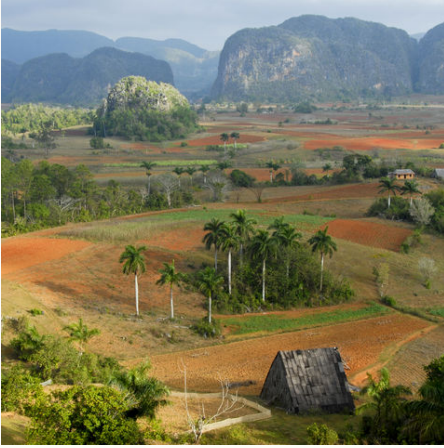
Blick über das Tal von Viñales, Kuba