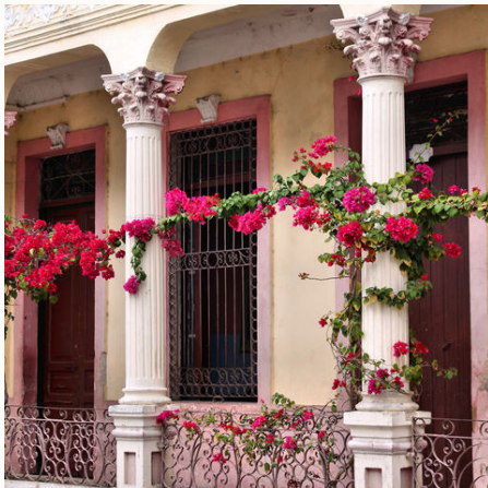
Romantischer Charme von Santiago, Kuba

Die Durchführung der Reise erfolgt in Zusammenarbeit mit einem befreundeten Veranstalter. Stand: 24.06.2024 (SP)