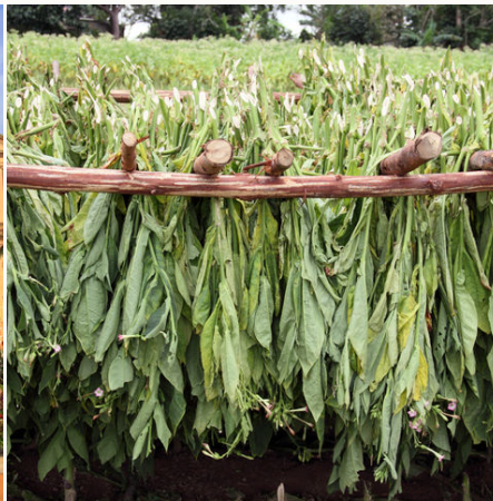
Trocknende Tabak-Blätter auf einer Farm, Kuba