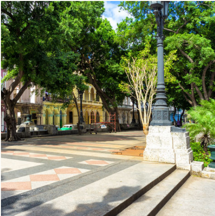
Hübscher Paseo del Prado in Havanna, Kuba