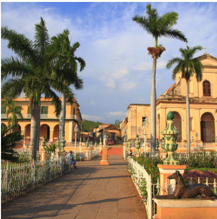
Plaza Mayor in Trinidad, Kuba

In zwei Wochen durchqueren wir die gesamte Insel – begonnen im touristisch weniger bekannten "Wilden Osten" der Sierra Maestra bis zur Westprovinz Pinar del Rio. Bei spannenden Begegnungen lernen wir von Kubanern etwas über ihr Leben, besuchen ausgezeichnete Projekte und lernen mit Havanna, Trinidad und Santiago die schönsten und bedeutendsten Städte Kubas kennen. Immer wieder lassen wir uns von den wunderschönen Landschaften des Landes begeistern. Wir spazieren durch Tabakfelder und entdecken die atemberaubende Natur des Viñales Tals. Gleichzeitig erhalten wir objektive Einblicke in die gesellschaftspolitische Lage, deren Dynamik eine Reise nach Kuba in diesen Tagen ganz besonders interessant macht.