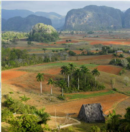
Blick über das Tal von Viñales, Kuba