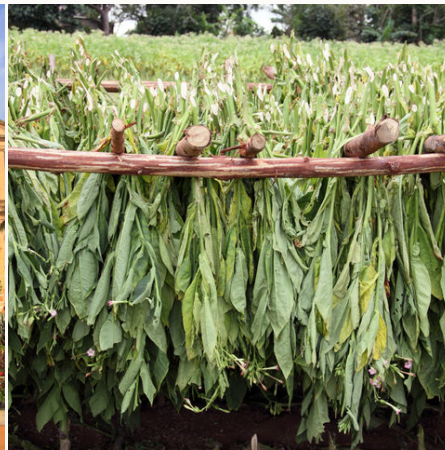
Trocknende Tabak-Blätter auf einer Farm, Kuba