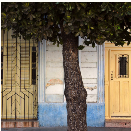
Türen in Cienfuegos, Kuba