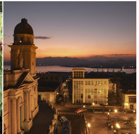
Santiago de Cuba bei Sonnenuntergang, Kuba