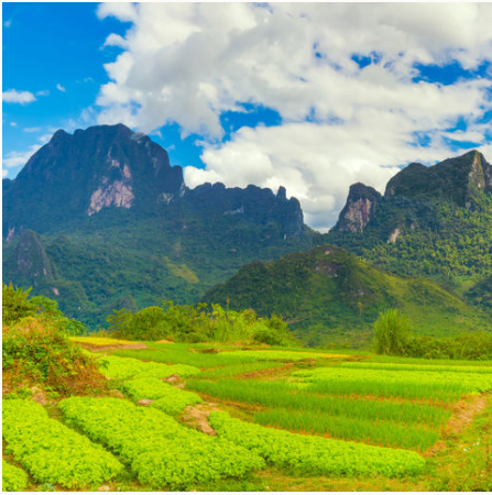
Landschaft von Vang Vieng, Laos