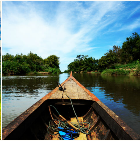
Bootsfahrt auf dem Mekong, Laos