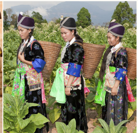
Hmong bei der Tabakernte, Laos