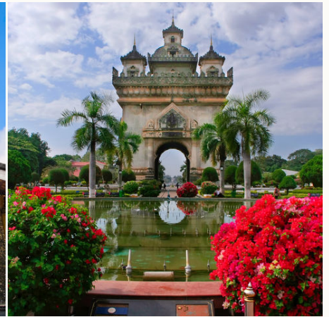
Patuxai-Triumphbogen in Vientiane, Laos