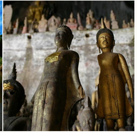
Goldene Buddhastatuen in den Pak Ou Höhlen, Laos