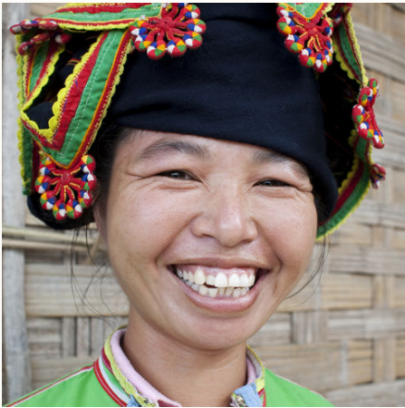
Lachende Frau, Laos