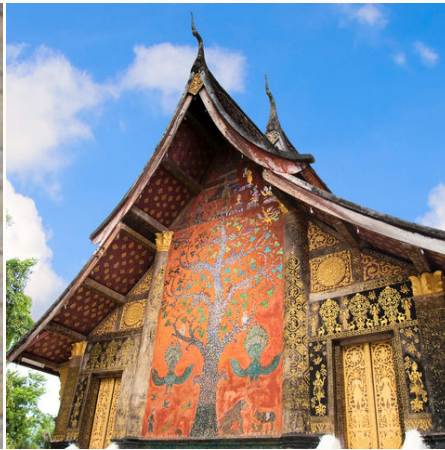
Wat Xieng Thong in Luang Prabang, Laos