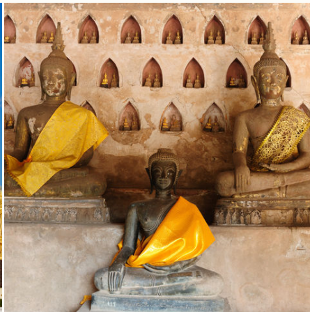
Buddhastatuen im Wat Sisaket, Laos