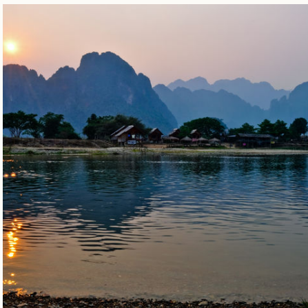
Der Song-Fluss bei Sonnenuntergang bei Vang Vieng, Laos

Verpflegungskosten kommen kann. Wir informieren Sie bei Buchung entsprechend.