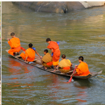
Mönche auf einem kleinen Boot, Laos