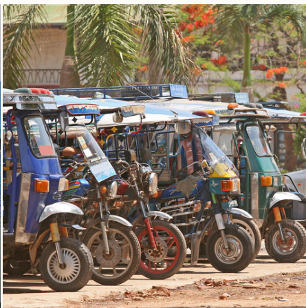
Tuk Tuks in Vientiane, Laos