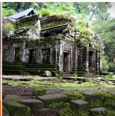
Ruinen der Tempelanlage Wat Phou südlich von Pakse, Laos