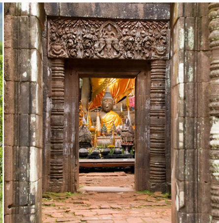
Buddhastatuen im Wat Phou, Laos