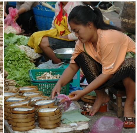
Verkäuferin auf einem Markt, Laos