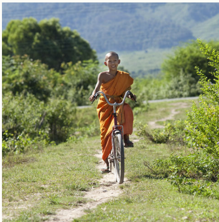
Fahrrad fahrender laotischer Mönch, Laos