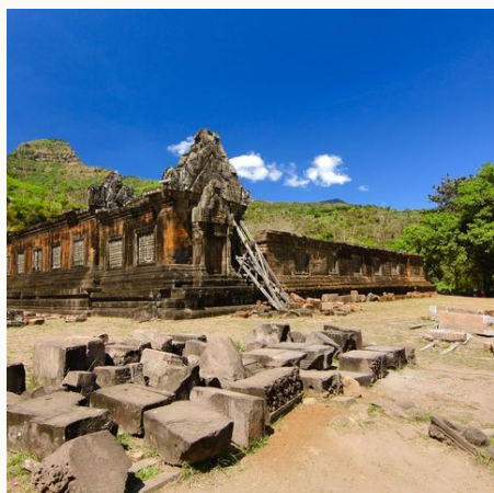
Ruine Wat Phou Tempel, Laos

Bei Reisen, die in die Hochsaison (z.B. Weihnachten, religiöse Feiertage vor Ort etc.) fallen, kann es zu Aufpreisen kommen. Gerne machen wir Ihnen auf Anfrage ein konkretes Angebot für diesen Zeitraum.