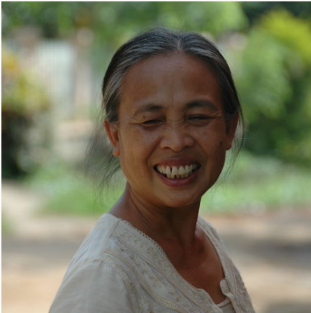
Schmunzelnde Papierhändlerin nahe Luang Prabang, Laos