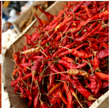
Getrocknete rote Chilis auf einem Markt, Laos