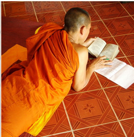
Ein studierender Mönch, Laos