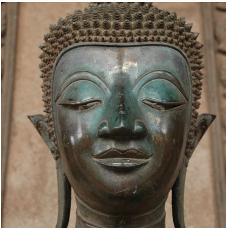
Buddha en face in Luang Prabang, Laos

Sabai Dee in Laos! Willkommen in einem der ursprünglichsten Länder Südostasiens, in dem die Zeit noch ein wenig langsamer zu laufen scheint. In kleinen, abgelegenen Bergdörfern begrüßen uns fröhliche Bewohner und spielende Kinder. Neugierig stellen wir Fragen und lernen den Alltag kennen. Der Einladung zu einem Essen im bescheidenen Heim folgen wir gerne und lauschen gespannt den Geschichten der Dorfbewohner. Auch aktiv werden wir auf dieser Laos-Reise. Wir erkunden die Umgebung bekannter Städte wie Vang Vieng und Luang Namtha. Nach einer Radtour erfrischt uns ein Wasserfall. Türkises Wasser plätschert vor sich hin, und wir genießen ein leckeres Picknick vor dieser besonderen Kulisse. Verlängern Sie Ihre Reise noch in Kambodscha und besuchen Sie die prächtigen Tempel von Angkor.