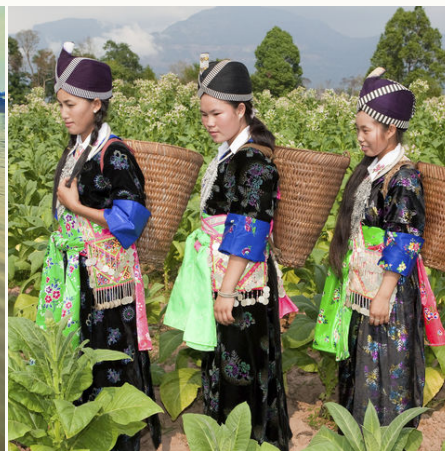
Hmong bei der Tabakernte, Laos