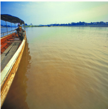
Sonnenuntergang am Mekong, Laos