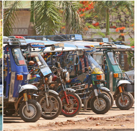
Tuk Tuks in Vientiane, Laos