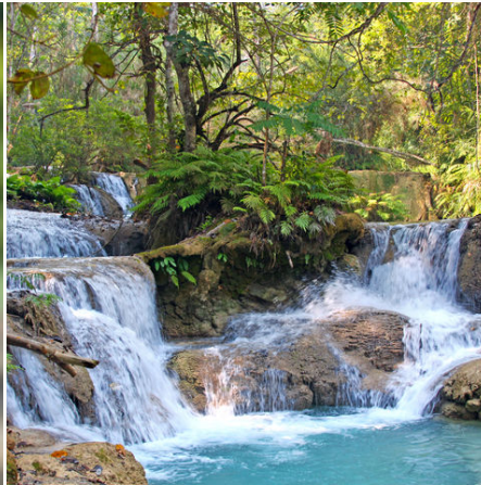
Kuang Si Wasserfälle, Laos