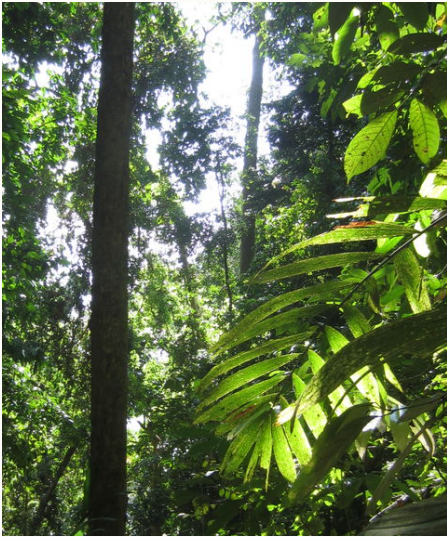
Mitten im Regenwald, Malaysia