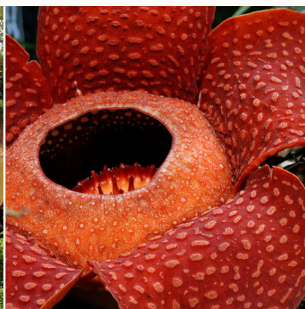
Beeindruckende Rafflesia, Malaysia