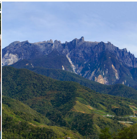
Blick auf den Mount Kinabalu, Malaysia