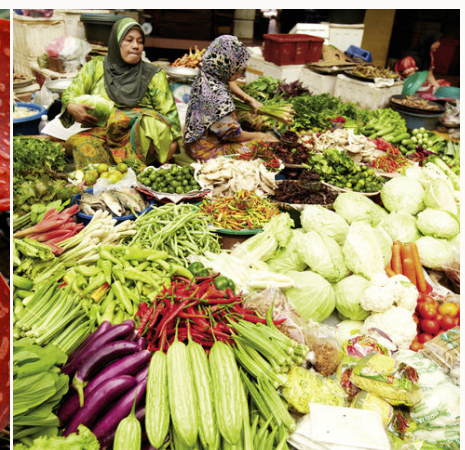
Große frische Auswahl auf einem Markt, Malaysia