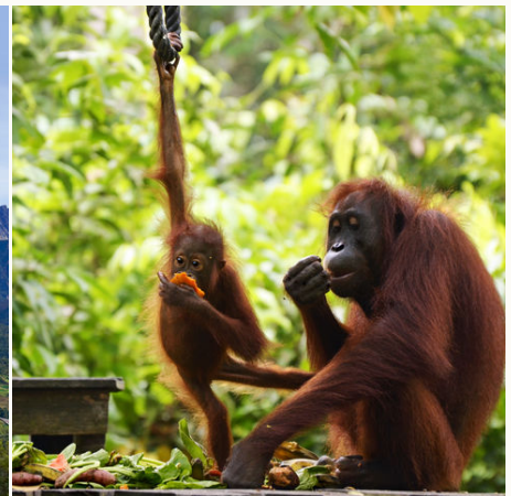
Orang-Utans im Rehabilitationszentrum auf Borneo, Malaysia