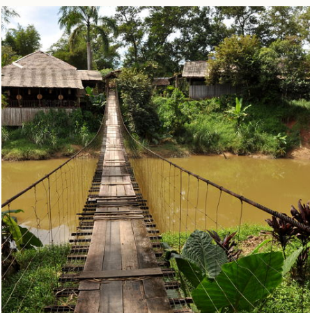
Einfache Hängebrücke über Fluss in Sabah, Malaysia

Bitte beachten Sie, dass es bei Reisen über Juli und August, Anfang Oktober, Weihnachten / Silvester sowie Anfang Februar zu Hochsaison-Aufpreisen kommen kann. Gerne machen wir Ihnen für diese Reisezeit ein konkretes Angebot.