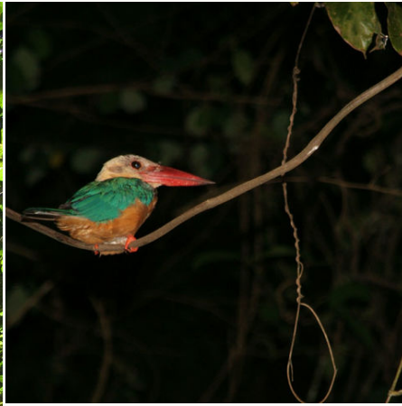
King Fisher Vogel, Malaysia