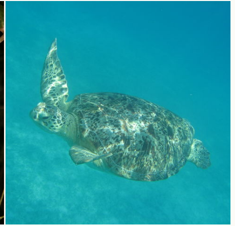
Meeresschildkröte im Ozean, Malaysia