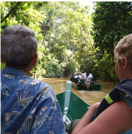
Flussfahrt auf dem Kinabatangan River, Malaysia

"Land unter dem Wind" – diesen Namen trägt Sabah seit Menschengedenken. Die Region liegt am nordöstlichen Zipfel von Borneo unterhalb des Taifungürtels. Früher suchten die Segelschiffe hier Schutz vor den tosenden Stürmen. Mit einer artenreichen Tier- und Pflanzenwelt zieht Sabah die Besucher in seinen Bann – zu Fuß und per Boot erkunden Sie Nationalparks und dichten Dschungel. Auge um Auge mit Orang Utans, Nasenaffen und mehr. Nach diesen aufregenden Tagen geht es ins Inselparadies Gaya. Mit einem Satz ins türkisfarbene Meer: Schnorcheln oder tauchen Sie durch die Unterwasserwelt des Archipels. Wie wäre es danach mit einer Ruhepause am Dschungelrand oder einem Picknick am weißen Sandstrand? Im Borneo-Inselparadies Pulau Gaya bleiben keine Wünsche offen! Das Marine Ecology Research Center kümmert sich um den Wiederaufbau des sensiblen Korallenriffs und erlaubt Einblicke in die spannende Arbeit. Naturliebhaber werden den Aufenthalt zwischen Regenwald und Unterwassererlebnis lieben – ein kleines Paradies!