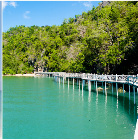
Brücke zur Langkawi Insel, Malaysia