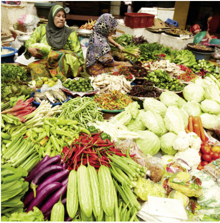
Große frische Auswahl auf einem Markt, Malaysia