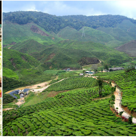
Teeplantagen in den Cameron Highlands, Malaysia