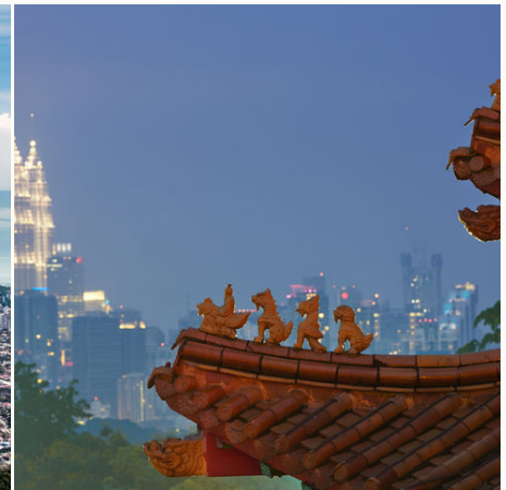
Dach des chinesischen Tempels und Petronas Towers, Malaysia