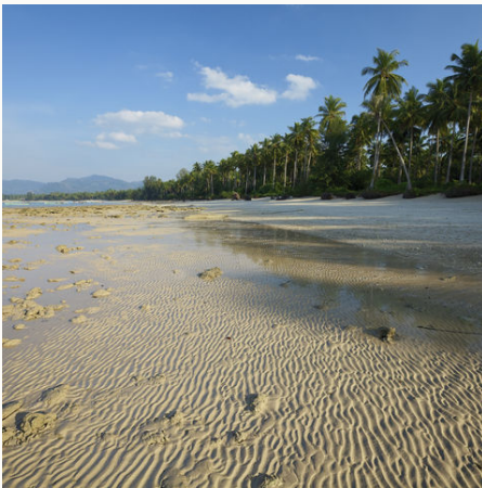
Tropischer Strand, Thailand