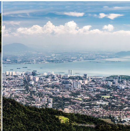
Blick auf Georgetown, Malaysia