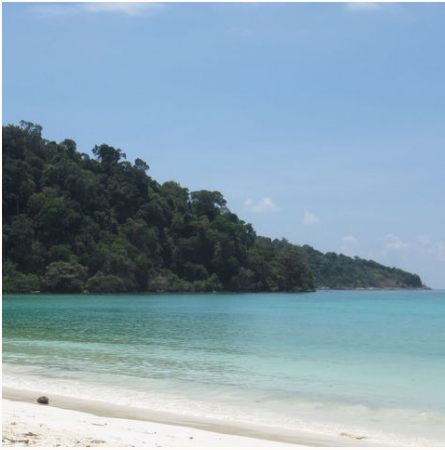
Strand auf Koh Lipe, Thailand