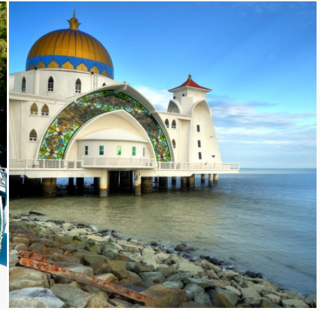
Masjid Silat Moschee in Malakka, Malaysia