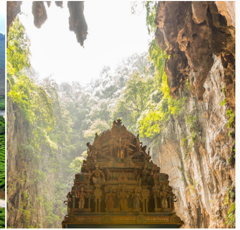
Hinduistischer Tempel in den Batu-Höhlen, Malaysia