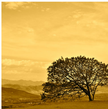
Monte Alban bei Sonnenuntergang, Mexiko

Formel 1 in Mexico City: Es bleibt das Recht vorbehalten, alle von der Formel 1 betroffenen Reiseternine nach Bekanntgabe des Renndatums nachträglich zeitlich, inhaltlich und auf den Übernachtungsort bezogen abzuändern.