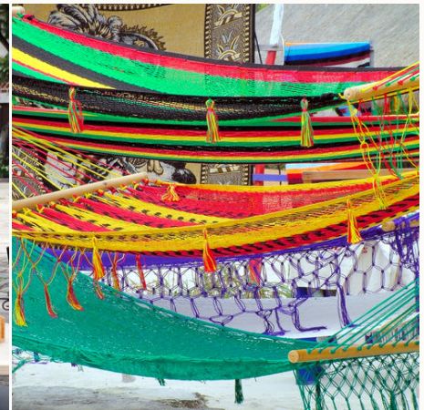
Bunte Hängematten, Mexiko