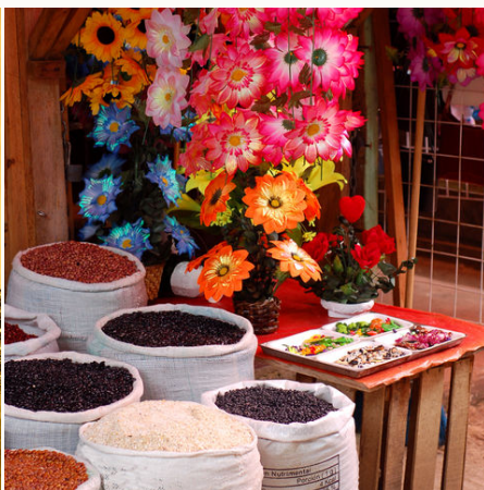
Blumen und Bohnen, Mexiko