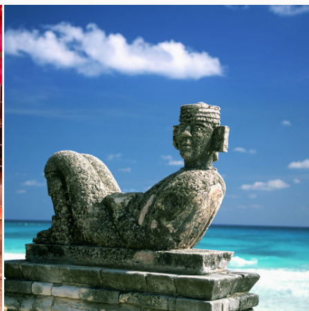
Figur am Strand von Cancun, Mexiko