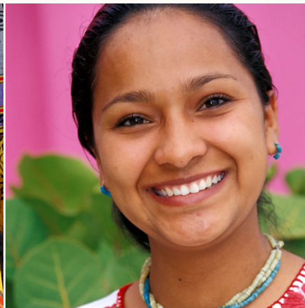
Freundliche Mexikanerin, Mexiko