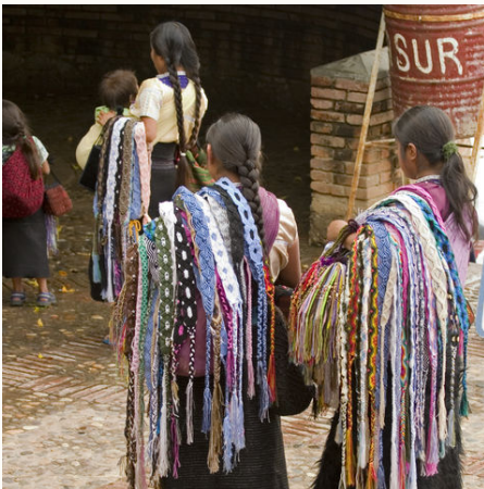
Indianer in Chiapas, Mexiko

Von Mexiko-Stadt bis nach Cancún – diese Mexiko Reise hat eine geballte Portion von Kultur- und Naturschätzen im Gepäck. Unser Abenteuer beginnt in der größten Stadt der Welt und führt uns an der geheimnisvollen Tempelanlage Teotihuacán vorbei bis hin zur Karibikküste. Unterwegs erwarten uns charmante Kolonialstädte, bunte Märkte und unvergessliche Naturschönheiten, wie der Sumidero Canyon, der vom Boot aus zu erkunden ist. Auf der Halbinsel Yucatán wandeln wir auf den Spuren der Maya und erkunden Chichén Itzá, deren wohl berühmteste Anlage. Einen traumhaften Abschluss unserer Reise bildet die mexikanische Ostküste – genießen Sie ein Bad im karibischen Meer. Badeverlängerungen sind individuell möglich.