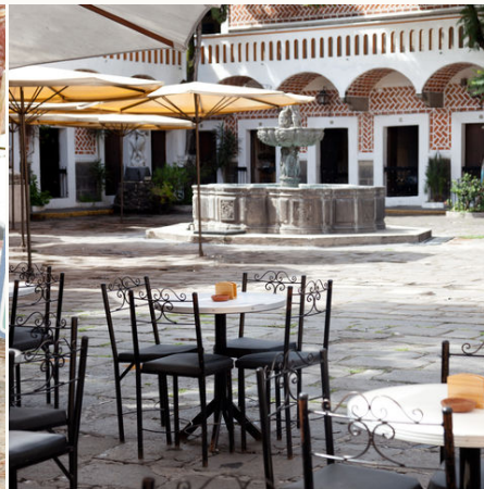
Mexikanischer Platz, Mexiko