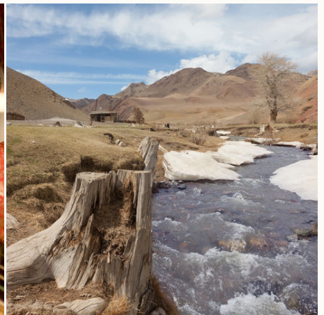
Bergfluss in der Steppe, Mongolei