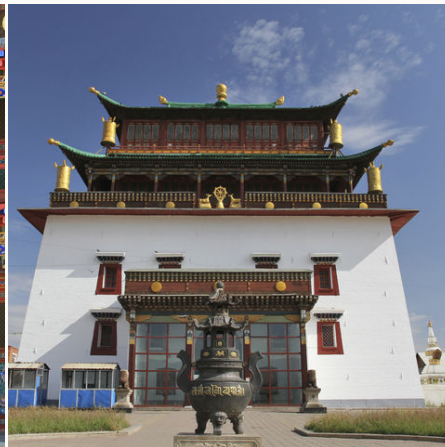
Das bedeutende buddhistische Gandan-Kloster, Mongolei