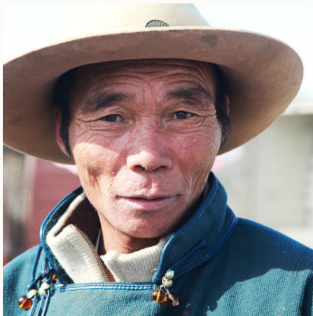
Freundlicher Mann mit Hut, Mongolei

✓ Verfügbar ! Wenige Plätze – Ausgebucht ✓ garantierte Durchführung