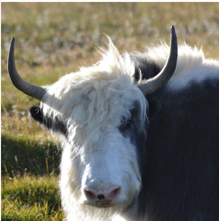
Yak auf der Wiese, Mongolei

Weite Steppen, galoppierende Pferde und tiefe Gesänge – die Mongolei birgt für uns Europäer viel Fremdartiges und Faszinierendes. Wer einmal in einem Jurtencamp in einer traditionellen Hütte, dem Ger, übernachtet hat, wird begeistert sein! Hier kann man für einige Tage leben wie einst Dschingis Khan, der mit seinen Horden durchs Land zog. Wenige Länder haben so viel von ihrer Eigenheit und ihrem ganz besonderen Charme erhalten wie die Mongolei. Beeindruckende Naturschönheit verbindet sich hier mit traditionellen Lebensweisen und einer besonderen Form des Buddhismus. Und dann die Wüste Gobi: ein Meer aus Fels und Sand. In dieser – für unser an Enge gewöhntes Auge schier unendlichen Weite – kann sich der Blick einfach in der Ferne verlieren!