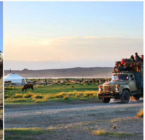
Typisches Alltagsleben, Mongolei