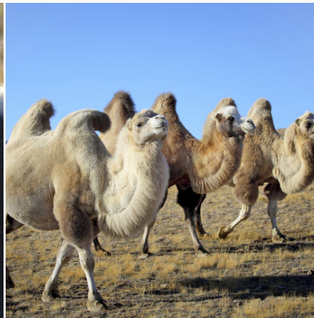
Kamele in der weiten Landschaft, Mongolei