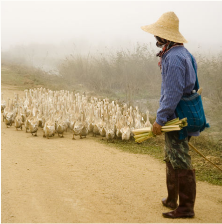
Bauer mit seinen Gänsen, Myanmar

Diese Trekking-Reise bringt Sie mitten hinein zu den Bergvölkern des Shan-Hochlandes. Bei einer Wanderung besuchen Sie die malerisch gelegenen Dörfer der Khun, Akha, Lahu sowie der Shan und tauchen ein in das Alltagsleben der Menschen. Die Bergstation Loimwe entzückt mit britischer Kolonialarchitektur und liegt inmitten von idyllischen Landschaften voller Seen und Reisterrassen – lassen Sie sich verzaubern! Authentisch wird es auf dem Markt von Kengtung. Sie kommen der noch beinahe unberührten Kultur der traditionellen Volksstämme ganz nah während Sie über den Markt von Kengtung schlendern.