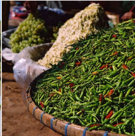
Grüne Chilis auf einem Markt, Myanmar