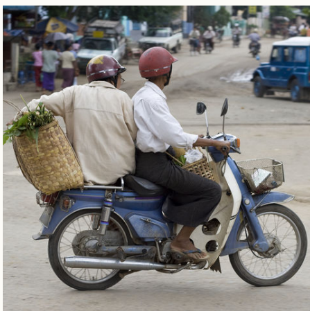
Burmesen auf einem Motorrad, Myanmar

Bitte beachten Sie, dass es zu Feiertagszeiten (Weihnachten, Neujahr, Water Festival usw.) zu Aufpreisen und zusätzlichen Verpflegungskosten kommen kann. Wir informieren Sie bei Buchung entsprechend.