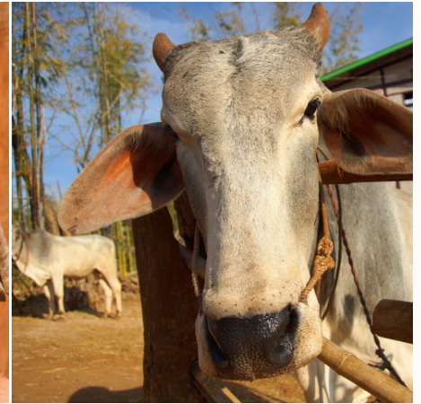
Kuh auf dem Land, Myanmar