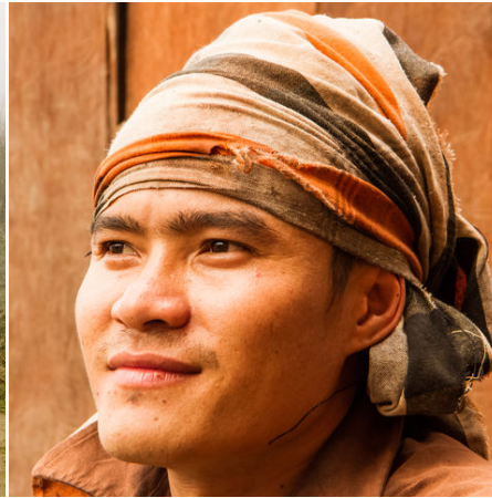
Junger Burmese, Myanmar