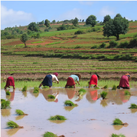
Arbeiterinnen auf einem Reisfeld, Myanmar