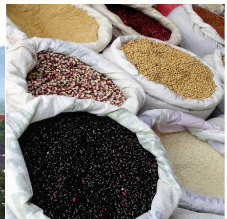
Gewürzsäcke auf einem Markt, Myanmar