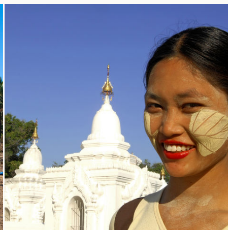
Burmesin in der Kuthodaw-Pagode, Myanmar