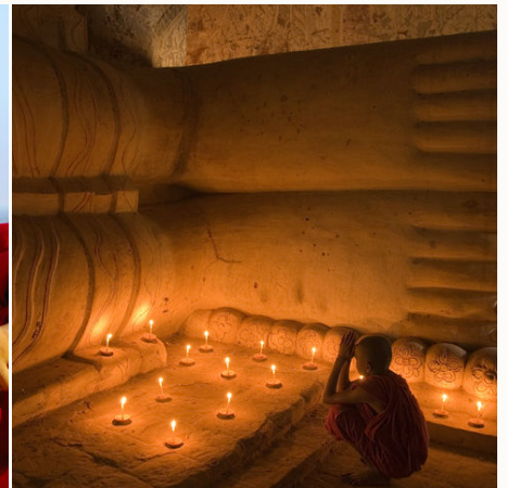
Betender junger Mönch, Myanmar