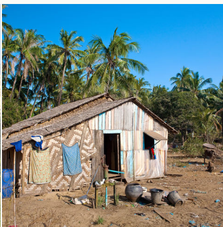
Typisches burmesisches Haus auf dem Land, Myanmar