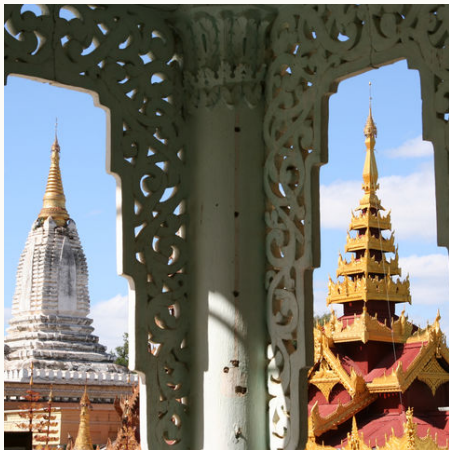
Tempel in Bagan, Myanmar

Glitzernd, funkelnd, mit Gold beklebt und im Sonnenlicht strahlend: das sind die Pagoden Burmas – wahre Meisterwerke! Auf Ihrer Reise durch das Goldene Land lassen Sie sich nicht nur von den jahrhundertealten Stupas verzaubern, sondern auch vom festen Glauben und den traditionellen Praktiken beeindruckt. Sie treffen auf die freundlichen Burmesen und tauschen Geschichten aus, Herzensmomente warten! Ein weiteres Highlight dieser Reise ist der Irrawaddy-Fluss, die Lebensader Myanmars. Er begleitet Sie quer durchs Land von Yangon entlang des Pagodenfeldes von Bagan bis nach Mandalay. Tauchen Sie ein in dieses wahrhaft königliche Land, lernen Sie den Alltag kennen und genießen Sie den Zauber, der Sie an jedem Ort auf seine individuelle Art umfängt!