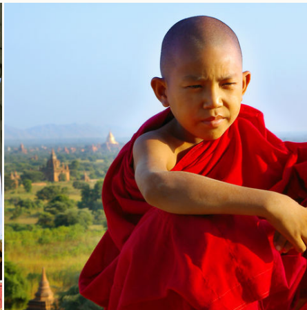
Junger Mönch, Myanmar