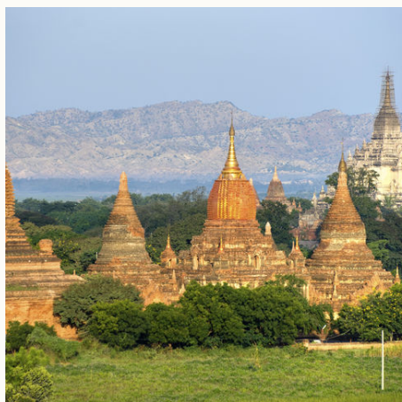
Der Gawdawpalin Tempel in Bagan, Myanmar

Bitte beachten Sie, dass es zu Feiertagszeiten (Weihnachten, Neujahr, Water Festival usw.) zu Aufpreisen und zusätzlichen Verpflegungskosten kommen kann. Wir informieren Sie bei Buchung entsprechend.