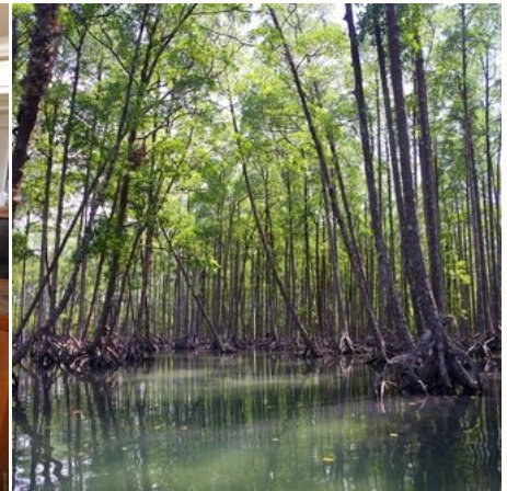
Mangrovenwald im Lampi-Nationalpark, Myanmar