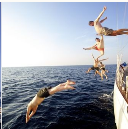
Sprünge vom Boot ins Wasser, Myanmar