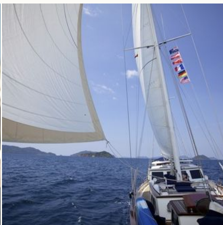
Segelboot im Mergui Archipel, Myanmar