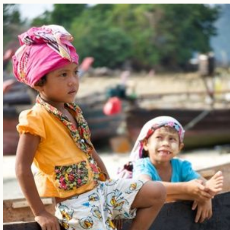
Zwei Mokenkinder, Myanmar

Termine und Preise bis auf weiteres auf Anfrage!