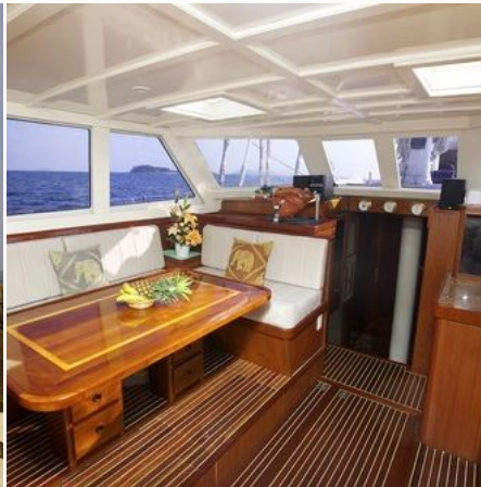
Küche auf der Meta IV, Myanmar