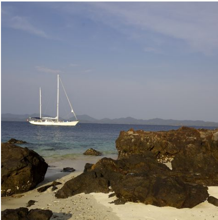
Die Meta IV aus der Ferne, Myanmar

Noch nahezu unbekannt für die Außenwelt – der Mergui-Archipel in Burma. Mit einer Segelyacht erkunden wir die schönsten Inseln des Archipels, von denen viele unbewohnt sind. Wir genießen weiße unberührte, kilometerlange Strände, gesäumt von dichtem Dschungel. Vom Schiff oder vom Strand aus können wir immer wieder ein Bad im azurblauen Wasser nehmen. Beim Schnorcheln entdecken wir die bunte Unterwasserwelt mit ihren Fischeschwärmen und Korallenriffen. Auf der Lampi Insel treffen wir auf die Einheimischen des Mergui-Archipels, die Moken. Diese ethnische Minderheit lebt überwiegend noch sehr traditionell. Das Tauchen nach Seegurken, Angeln und Tauschhandel gehören zu ihrem Alltag. Wir entdecken die ursprünglichen Inseln mit ihren tropischen Wäldern bei Wanderungen durch Täler und Hügel. Nach einem erlebnisreichen Tag entspannen wir an Deck der Segelyacht und genießen die Weite und Ruhe des Meeres.