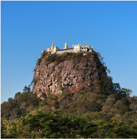
Blick auf den Mount Popa, Myanmar

Lernen Sie auf dieser Myanmar Individualreise das Land und seine herzlichen Bewohner in Ihrem ganz eigenen Tempo kennen. Sie gestalten Ihre Tage weitgehend selbst nach Lust & Laune und können sich treiben lassen. Gerne bieten wir Ihnen optionale Ausflüge an! Tauchen Sie ein in das urige Leben der großen und kleineren Orte, viele kann man wunderbar selbst zu Fuß oder per Fahrrad erkunden. Der paradiesische Strand von Ngapali Beach lockt schließlich zum Relaxen. Entspannen Sie mit dem warmen Sand unter den Füßen und dem erfrischende Meer vor Ihren Augen.