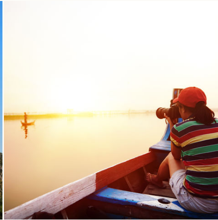
Fotografieren auf dem See, Myanmar