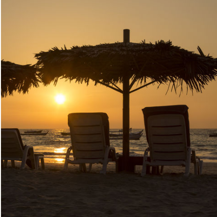
Sonnenuntergang am Ngapali Beach im Golf von Bengalen, Myanmar

Bitte beachten Sie, dass es zu Feiertagszeiten (Weihnachten, Neujahr, Water Festival usw.) zu Aufpreisen und zusätzlichen Verpflegungskosten kommen kann. Wir informieren Sie bei Buchung entsprechend.