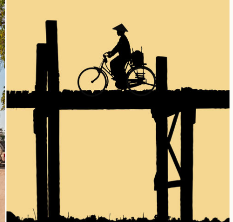
Mit dem Rad über die U-Bein Brücke bei Amarapura, Mandalay, Myanmar