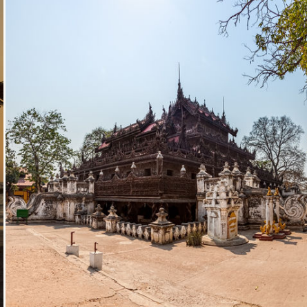
Shwenandaw Teakholz-Kloster in Mandalay, Myanmar