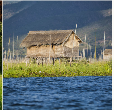
Stelzenhaus auf dem Inle See, Myanmar