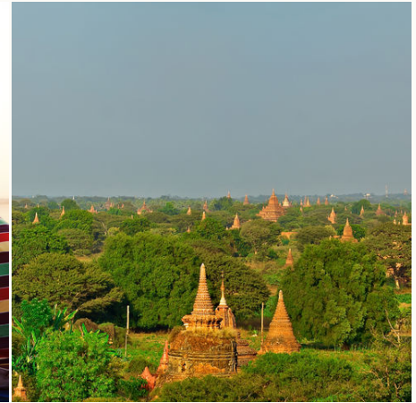
Das historische Pagodenfeld von Bagan, Myanmar