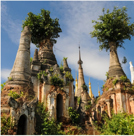
Nyaung Oak Pagoden in Indein am Inle See, Myanmar