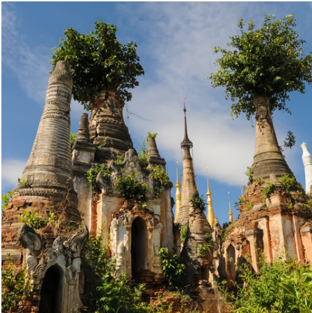
Nyaung Oak Pagoden in Inle am Inle See, Myanmar