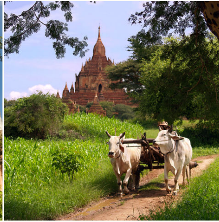
Farmer mit seinen Ochsen in der Nähe von Bagan, Myanmar