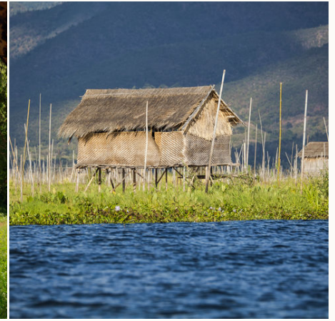
Stelzenhaus auf dem Inle See, Myanmar