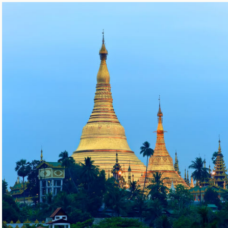
Sonnenaufgang über der Shwedagon Pagode, Myanmar