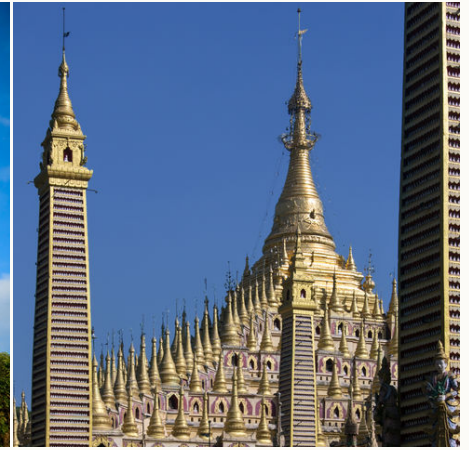
Thanboddhay Pagode, Myanmar