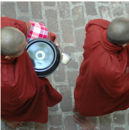
Blick auf zwei Mönche, Myanmar

Entdecken Sie mit uns eines der faszinierendsten und ursprünglichsten Länder Südostasiens: das sagenumwobene "Goldene Land" – Burma, auf unserer Myanmar-Rundreise. Die tief verwurzelte, buddhistische Tradition ist allgegenwärtig im Alltag der höflich lächelnden Burmesen. Eine zweitägige Trekkingtour führt vorbei an Teeplantagen mit wunderbaren Ausblicken ins Shan-Gebirge, wo wir in einem einfachen alten Kloster übernachten und auf Mönche treffen. Ein paar Tage später finden wir uns erwartungsvoll auf einem schwankenden Boot auf dem mächtigen Irrawaddy wieder. Wir beobachten die seltenen Flussdelfine beim gemeinsamen Fischfang mit den Fischern. Beim Dorfspaziergang im Fischerdorf umringen uns die lachenden Kinder und unsere mitgebrachten Little Sun-Solarlampen wechseln die Hand. Trotz des Fortschritts der letzten Jahre scheint die Zeit mancherorts noch stehen geblieben zu sein in diesem Land, das wie kein anderes das alte Asien verkörpert.