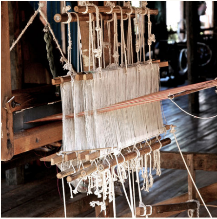
Seidenspinnerei am Inle-See, Myanmar