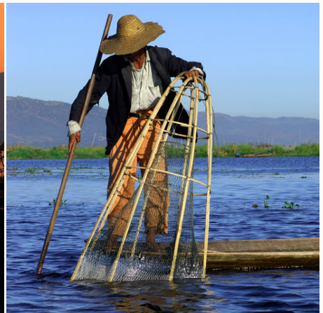
Fischer bei der Arbeit auf dem Inle See, Myanmar,