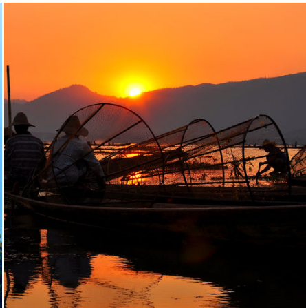
Fischer bei Dämmerung auf dem Inle-See, Myanmar