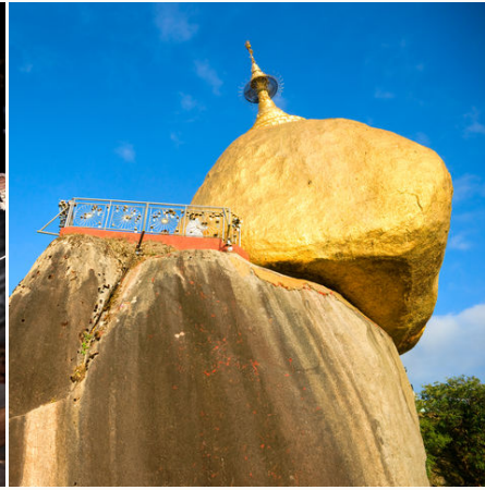
Der Goldene Felsen, Myanmar