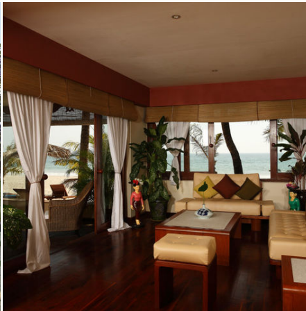
Suite im Bayview Beach Resort, Myanmar