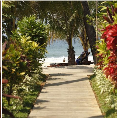
Garten des Bayview Beach Resorts, Myanmar