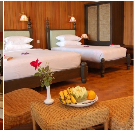
Deluxe Zimmer im Thande Beach Hotel, Myanmar