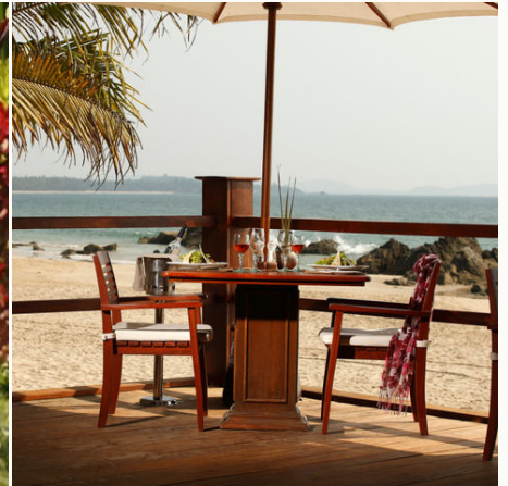
Dinner direkt am Strand im Bayview Beach Resort, Myanmar