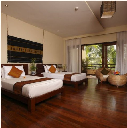
Twin Room im Bayview Beach Resort, Myanmar