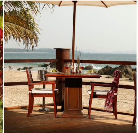
Dinner direkt am Strand im Bayview Beach Resort, Myanmar