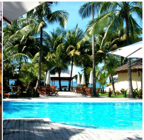
Pool im Bayview Beach Resort, Myanmar