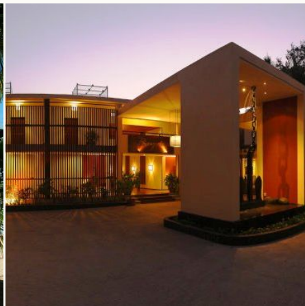
Eingang des Bayview Beach Resorts, Myanmar