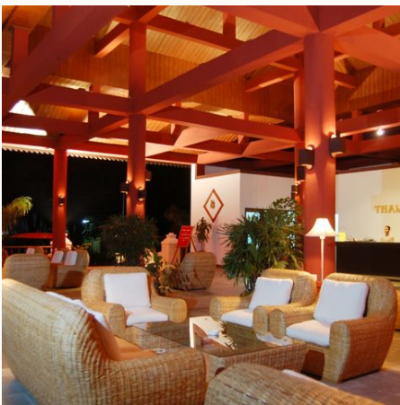
Lobby und Rezeption im Thande Beach Hotel, Myanmar

Ein Geheimtipp für den Erholungssuchenden, der die Ruhe liebt und auf Nachtleben verzichten kann. Ngapali Beach ist per Flug von Yangon nach Thandwe zu erreichen. Wir haben einen individuellen Baustein für Sie zusammengestellt für einen 7-tägigen Aufenthalt (5 Nächte im Beach Hotel und 1 obligatorische Nacht in Yangon vor dem Rückflug). Gern können Sie auf Wunsch noch zusätzliche Nächte anhängen oder den Hinflug von Bagan sowie Heho (Inle-See) ändern.