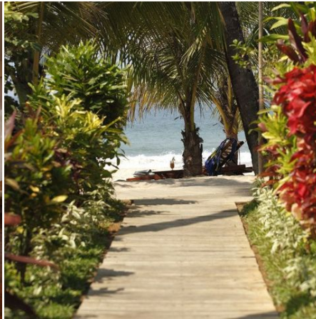
Garten des Bayview Beach Resorts, Myanmar