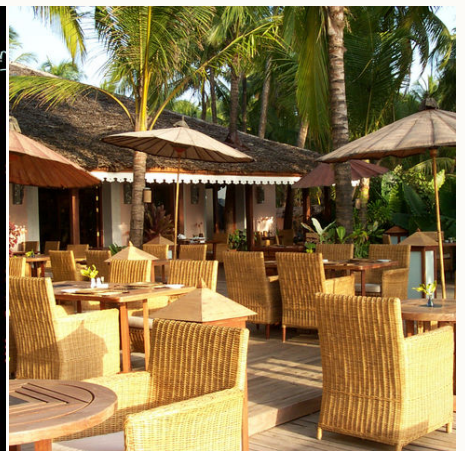
Terrasse des Restaurants im Sandoway Resort, Myanmar