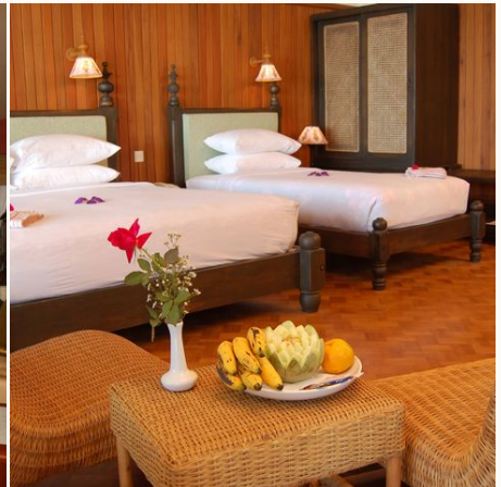
Deluxe Zimmer im Thande Beach Hotel, Myanmar