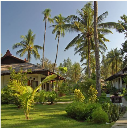
Deluxe Garden View Bungalow im Thande Beach Hotel, Myanmar