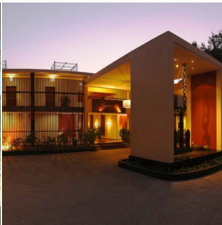
Eingang des Bayview Beach Resorts, Myanmar