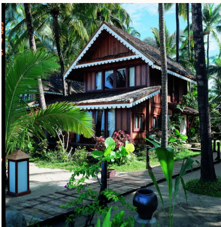
Außenanlage des Sandoway Resorts, Myanmar