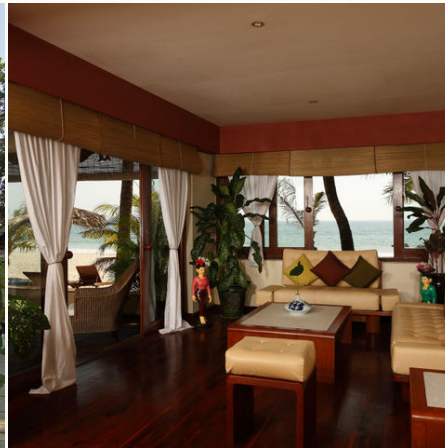
Suite im Bayview Beach Resort, Myanmar