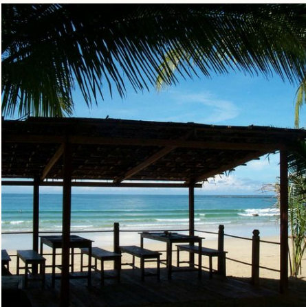
Sunset Bar des Bayview Beach Resorts, Myanmar