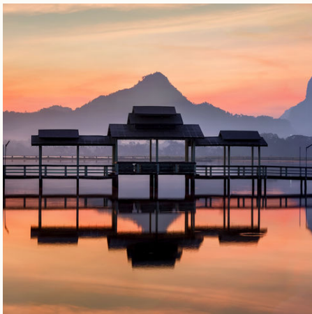
Sonnenaufgang am Hpa An See, Myanmar

Veranstalter: a&e erlebnis:reisen, eine Marke der Boomerang-Reisen GmbH. Stand: 12.06.2021 (JH)