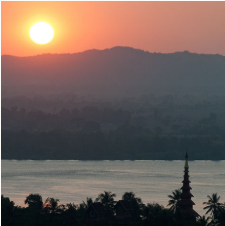
Sonnenuntergang bei Mawlamyine, Myanmar