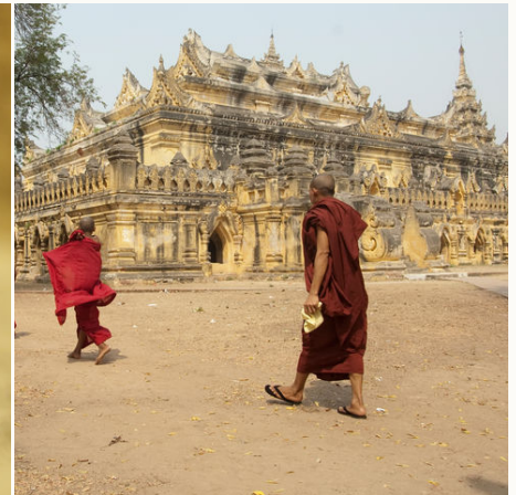
Mönche vor einem Tempel, Myanmar