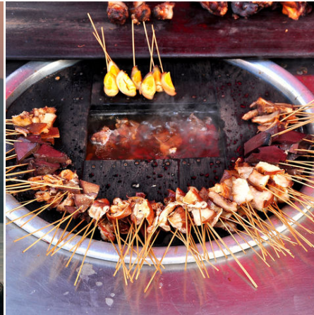
Straßenimbiss in Yangon, Myanmar