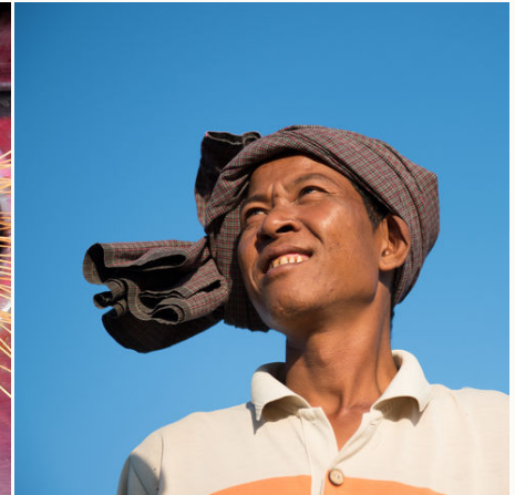
Burmesischer Bauer, Myanmar