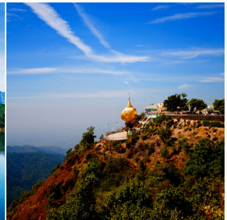
Goldener Felsen, Myanmar