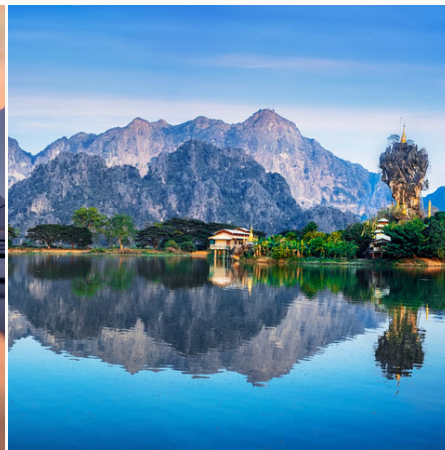
Kyauk Ka Lat Pagode in Hpa An, Myanmar