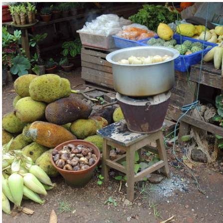
Ländlicher Markt, Myanmar