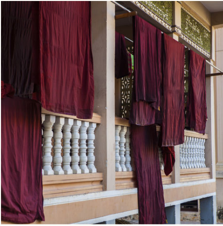
Waschtag im Kloster, Myanmar