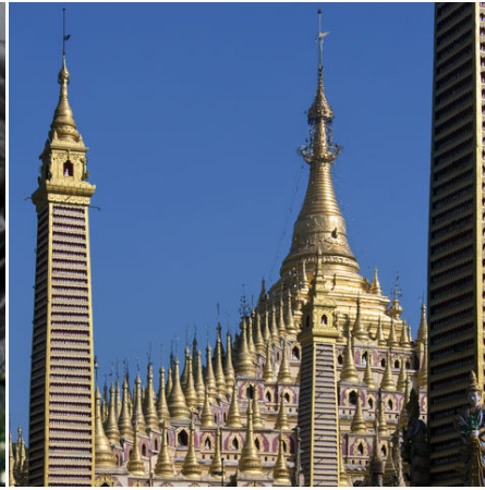
Thanboddhay Pagode, Myanmar