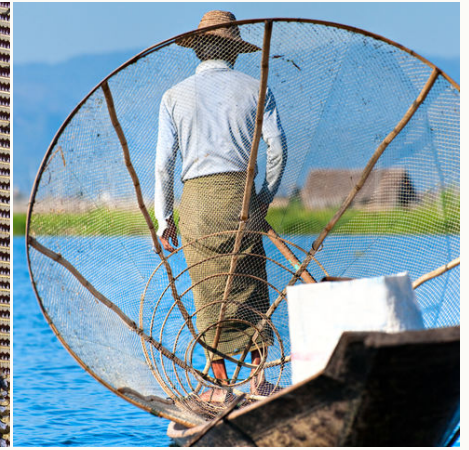
Fischer auf dem Inle See, Myanmar