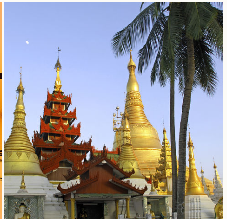
Goldene Shwedagon Pagode in Yangoon, Myanmar