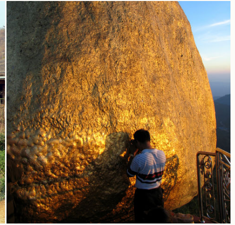
Beten am Goldenen Felsen, Myanmar