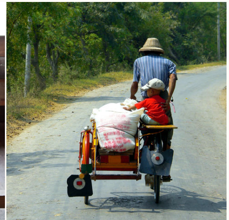
Fahrrad mit Beiwagen, Myanmar