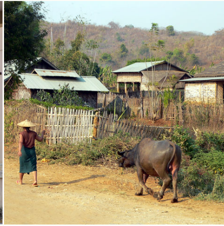
Farmer und Wasserbüffel, Myanmar