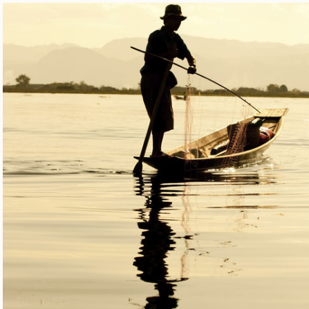
Fischer auf dem Inle See bei der Arbeit, Myanmar