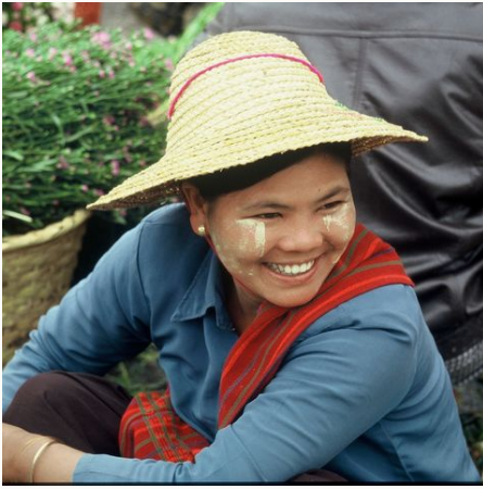
Burmesin auf einem Markt, Myanmar