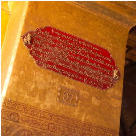
Schrift in einem buddhistischen Tempel in Mandalay, Myanmar

Bitte beachten Sie, dass es zu Feiertagszeiten (Weihnachten, Neujahr, Water Festival usw.) zu Aufpreisen und zusätzlichen Verpflegungskosten kommen kann. Wir informieren Sie bei Buchung entsprechend.