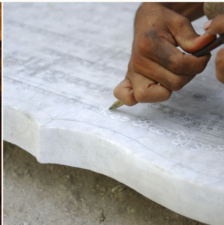
In Marmor eingravierte burmesische Schriften, Myanmar