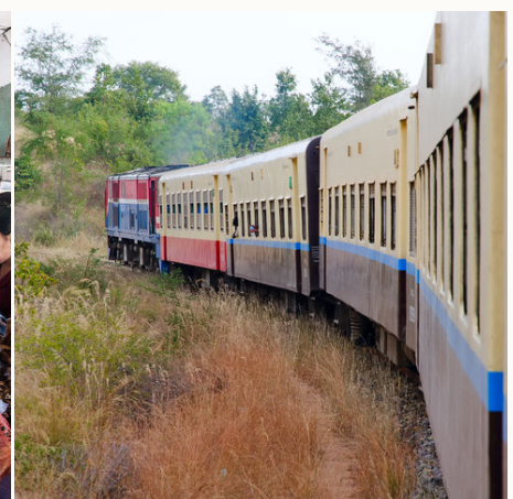
Burmesisches Eisenbahnerlebnis, Myanmar