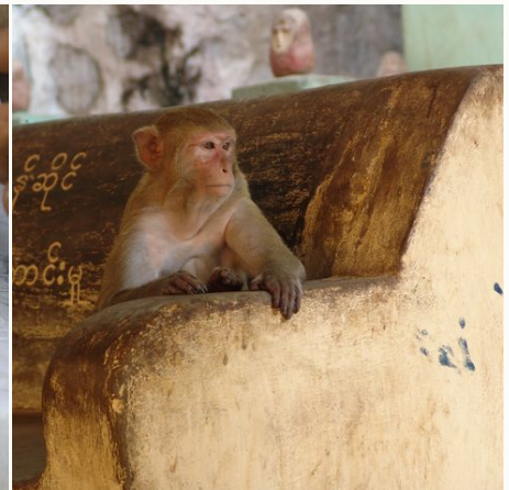
Affe in einem burmesischen Tempel, Myanmar