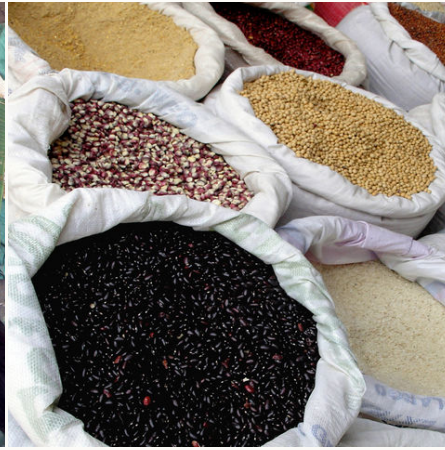
Gewürzsäcke auf einem Markt, Myanmar