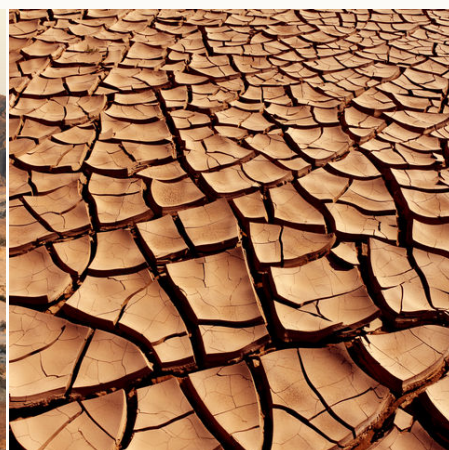
Trockener und rissiger Boden in der Namib-Wüste, Namibia