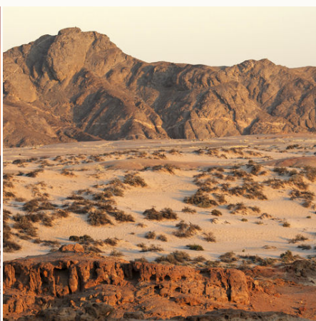
Felsen in der Namib-Wüste, Namibia