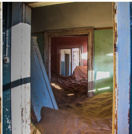
Verlassenes Haus in Kolmanskop, Namibia