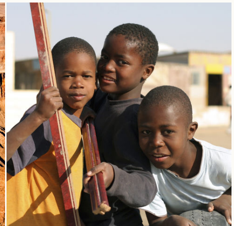
Namibische Kinder, Namibia