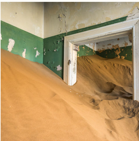
Haus voll mit Sand in der Geisterstadt Kolmanskop, Namibia

Erleben Sie den faszinierenden Fish River Canyon hautnah und lassen Sie sich von den ganz besonderen Perspektiven dieses beeindruckenden Tals in seinen Bann ziehen. Besuchen Sie die Wüstenpferde von Garub, die sich auf ganz besondere Weise ihrer Umgebung angepasst haben und erkunden Sie die Geisterstadt Kolmanskop, in der früher die Menschen nach Diamanten schürften. Hier reisen Sie individuell und per Mietwagen.