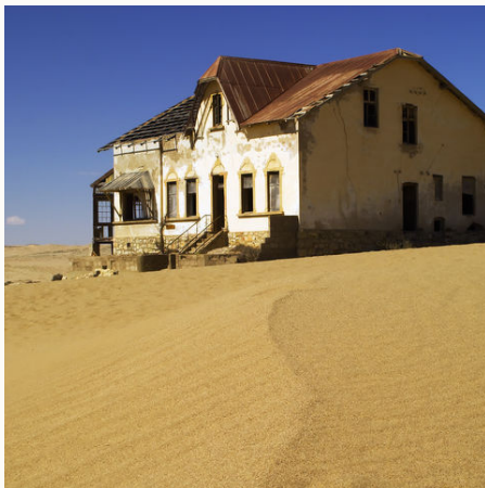
Verlassenes Haus in Kolmanskop, Namibia

Veranstalter: a&e erlebnis:reisen, eine Marke der Boomerang-Reisen GmbH Stand: 22.09.22 (BG)