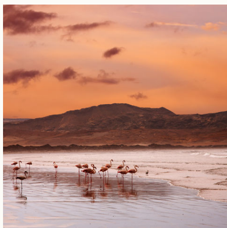
Flamingos am Strand am Atlantik, Namibia