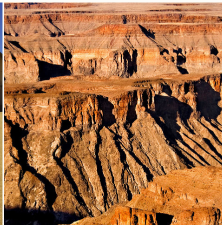
Gigantischer Fish River Canyon, Namibia