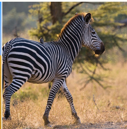
Vogel sitzt auf einem Zebra, Namibia