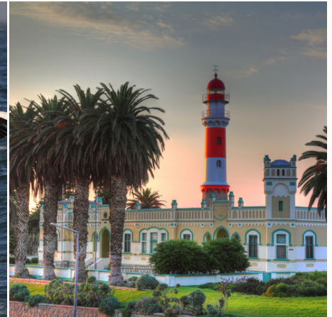
Leuchtturm in Swakopmund, Namibia