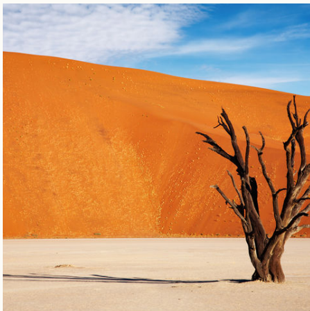
Abgestorbener Baum im Deadvlei bei Sossusvlei, Namibia