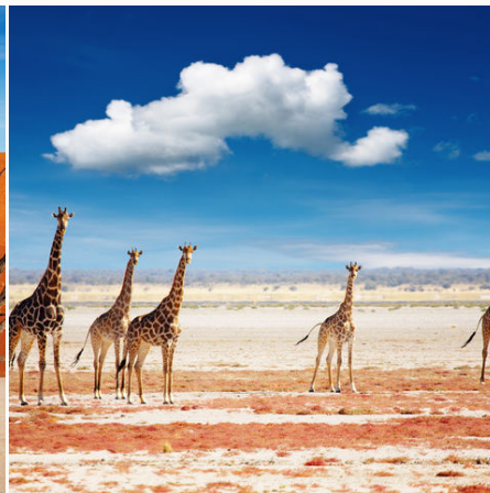
Giraffen im Etosha Nationalpark, Namibia