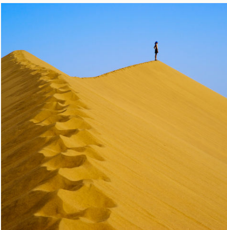
Auf einer großen Sanddüne, Namibia

Spannende Tierbegegnungen, atemberaubende Landschaften und kulturelle Begegnungen erwarten Sie auf dieser Namibia Rundreise von Windhoek über den Etosha-Nationalpark, die Atlantik-Küste und die älteste Wüste der Welt – der Namib. Am Waterberg Plateau wandern Sie durch die Wildnis und genießen den Ausblick. Lassen Sie sich von der Geschichte und Kultur dieses bunten Landes faszinieren und in den Bann ziehen.