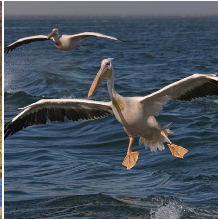
Fliegende Pelikane, Namibia