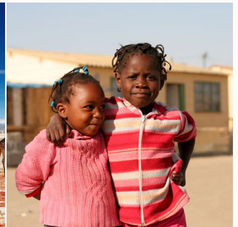
Einheimische Kinder, Namibia