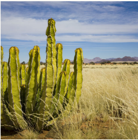
Großer Kaktus in der Savannenlandschaft, Namibia

Über spektakuläre Pisten geht es bis ganz in den Nordenwesten Namibias zu den Epupa Falls, ein wahres Naturwunder. Dort treffen Sie auch auf das dort lebende Volk der Himba. Im Ovamboland bei Ondangwa besuchen Sie ein Ovambo Dorf und nehmen Teil an deren Leben. Intensive Begegnungen und Einführungen in die vielfältige Kultur stehen auf dem Programm - erleben Sie Namibia hautnah.