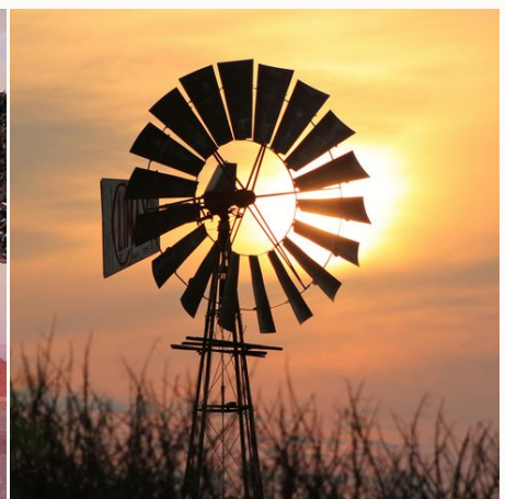
Windpumpe im Licht des Sonnenuntergangs, Namibia