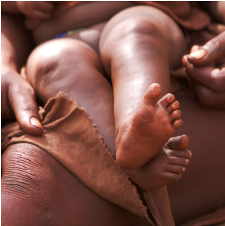
Himba-Frau mit ihrem Kind auf dem Schoß, Namibia