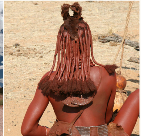
Haarpracht einer Himba-Frau, Namibia