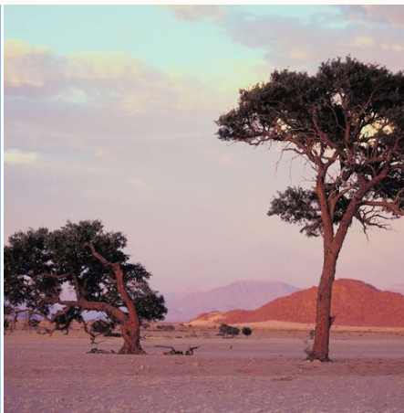
Karge Landschaft, Namibia