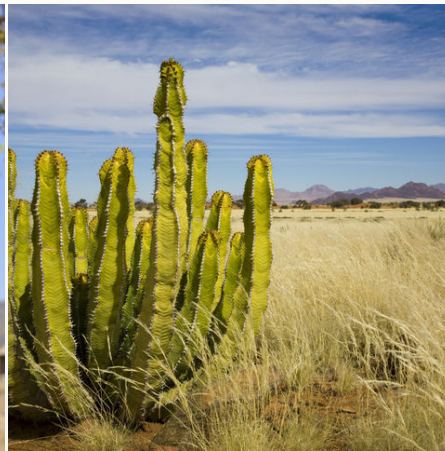
Großer Kaktus in der Savannenlandschaft, Namibia