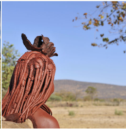
Verheiratete Himba-Frau im Kaokoveld, Namibia