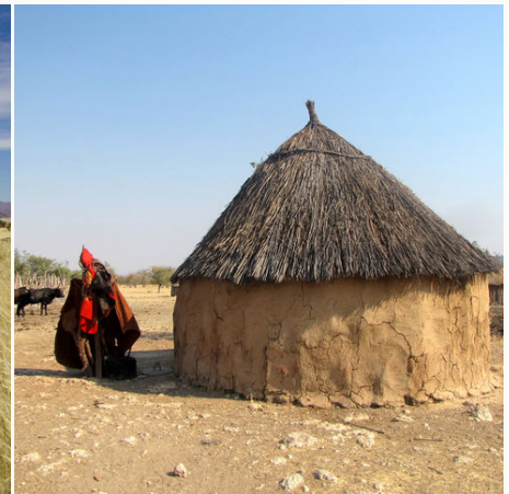
Typische Rundhütte der Himba, Namibia