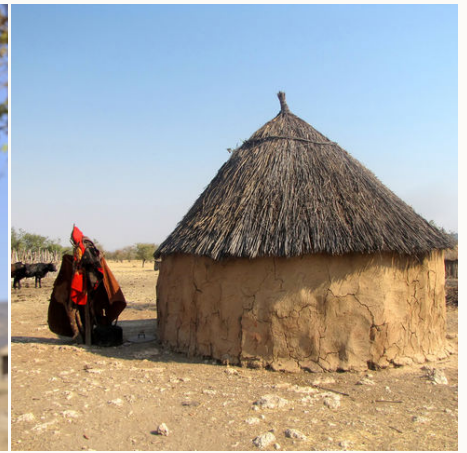
Typische Rundhütte der Himba, Namibia