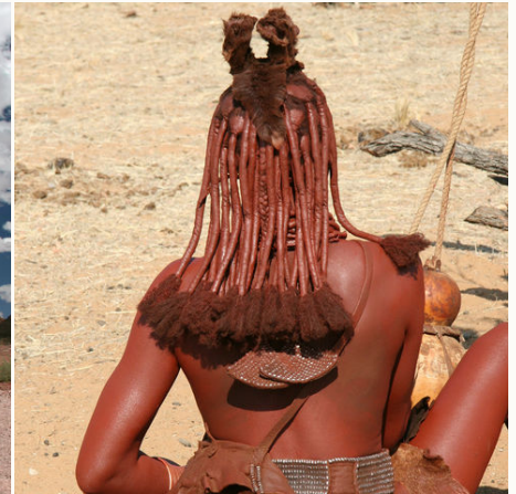
Haarpracht einer Himba-Frau, Namibia