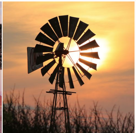
Windpumpe im Licht des Sonnenuntergangs, Namibia