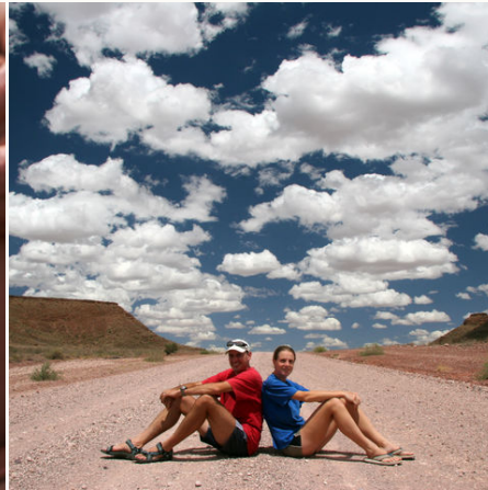
Touristen auf einer Schotterstraße, Namibia