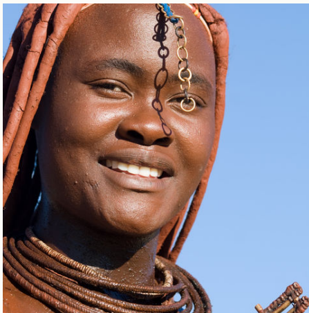
Schmuck und Haarpracht einer Himba-Frau, Namibia