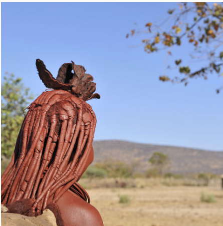
Verheiratete Himba-Frau im Kaokoveld, Namibia

Über spektakuläre Pisten geht es bis ganz in den Nordenwesten Namibias zu den Epupa Falls, ein wahres Naturwunder. Dort treffen Sie auch auf das dort lebende Volk der Himba. Im Ovamboland bei Ondangwa besuchen Sie ein Ovambo Dorf und nehmen Teil an deren Leben. Intensive Begegnungen und Einführungen in die vielfältige Kultur stehen auf dem Programm - erleben Sie Namibia hautnah.