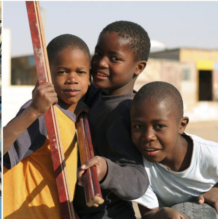
Namibische Kinder, Namibia