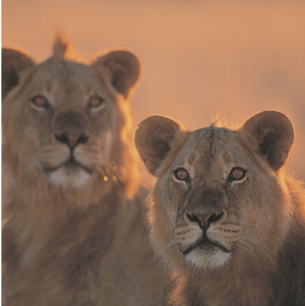
Zwei Löwinen in der Kalahari Wüste, Namibia

Bitte beachten Sie, dass sich die eingeschlossenen Mahlzeiten in den verschiedenen Hotelkategorien unterscheiden, siehe Leistungen.