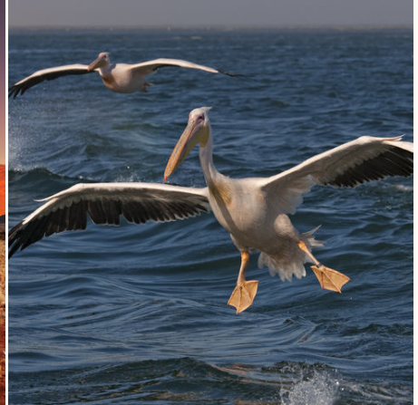
Fliegende Pelikane, Namibia