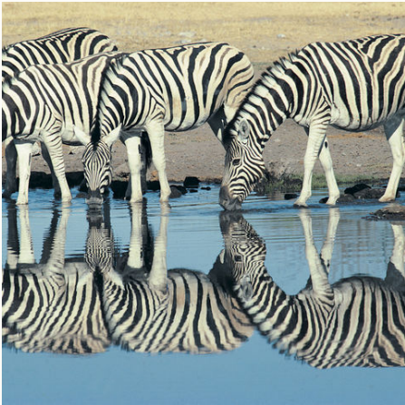
Zebras an einem Wasserloch im Etosha Nationalpark, Namibia