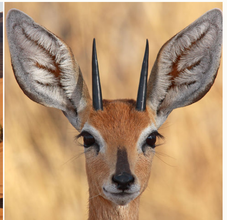
Eine Steinantilope, Namibia