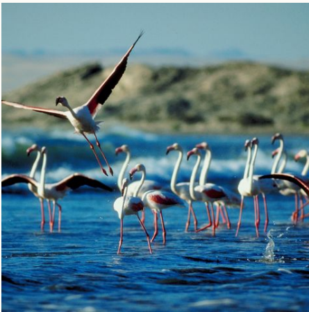
Flamingoschwarm im Wasserloch, Namibia

Auf dieser Namibia Rundreise erleben Sie im eigenen Rhythmus per Mietwagen viele Highlight dieses besonderen Landes. Staunen Sie über die spektakuläre Landschaft in der Kalahari, der Namib Wüste und im Sossusvlei. Erklimmen Sie hohe Dünen und genießen den Ausblick auf einmalige Sonnenauf- und Sonnenuntergänge. Begeben Sie sich auf die Spuren von Elefanten, Löwen, Nashörnern und vielen anderen wilden Tieren im Etosha Nationalpark. An der Küste am Atlantik ist die Geschichte Namibias zu spüren und der Strand lockt zu ausgedehnten Spaziergängen. Kultur erleben Sie ebenso im Damaraland und wer noch nicht genug hat, kann diese Tour mit weiteren Bausteinen ganz nach Wunsch verlängern.