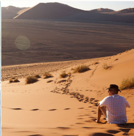
Traumhafte Namib Wüste, Namibia