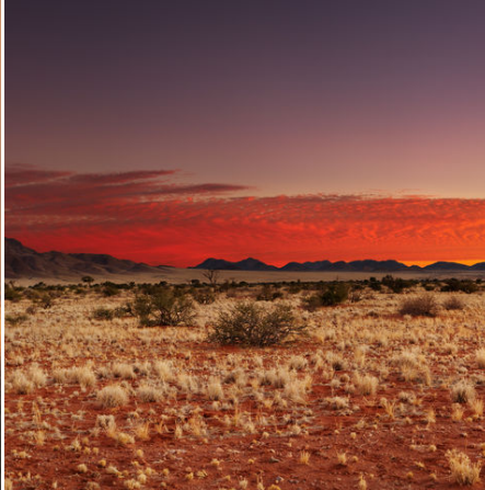
Sonnenuntergang über der Kalahari Wüste, Namibia