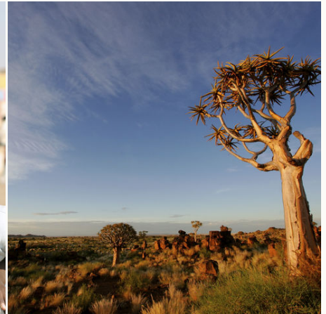
Faszinierende Wüstenlandschaft, Namibia