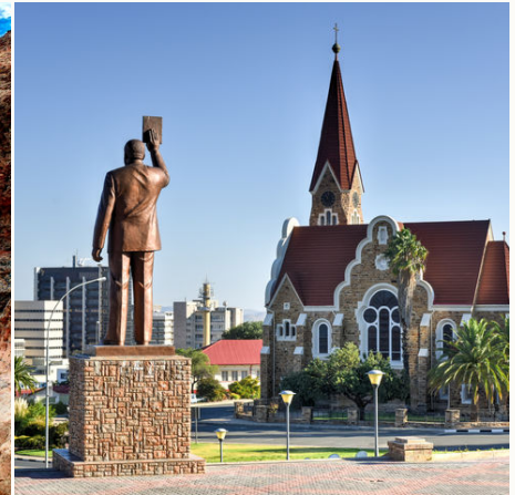
Chrituskirche in Windhoek, Namibia