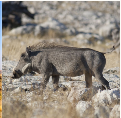
Warzenschwein am Wasserloch Olifantsbad im Etosha Nationalpark, Namibia