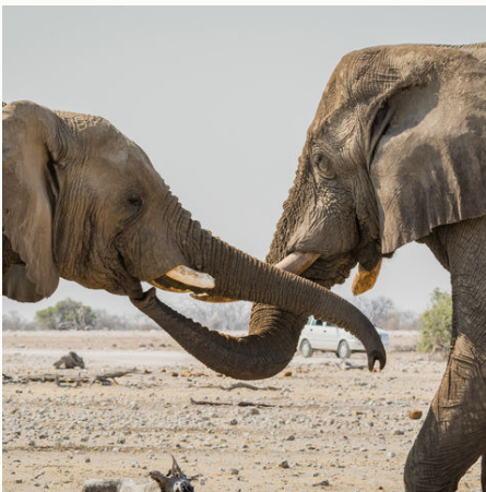
Elefanten am Wasserloch Klein Namutoni im Etosha Nationalpark, Namibia

Gemeinsam erkunden wir die kulturelle und ethnische Vielfalt Namibias! Barfuß erklimmen wir die außergewöhnliche Dünenlandschaft zur Morgenstunde. Die Sonne am tiefblauen Himmel, das Erlebnis grenzenloser Weite und die Farbenpracht der Landschaft werden uns lange in Erinnerung bleiben. Auf der Suche nach den Spuren der Geschichte erkunden wir die Relikte der Kolonialzeit und besuchen die älteste Volksgruppe Afrikas – die San. Eine herzliche und individuelle Betreuung erfolgt auf den verschiedenen Gästefarmen und Lodges, in denen wir entspannen und die vielen Eindrücke Revue passieren lassen.