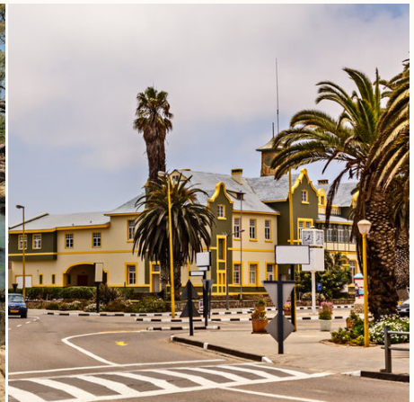
Kolonialgebäude in Swakopmund, Namibia