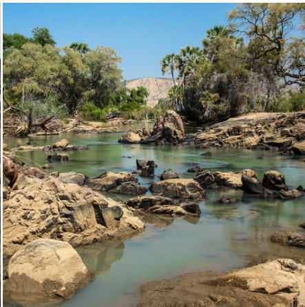
Ruhiges Kunene Flussbett, Namibia