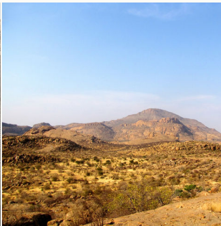
Panorama des Erongo Gebirges, Namibia