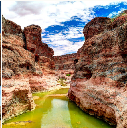
Schlucht im Sesriem Canyon, Sossusvlei, Namibia