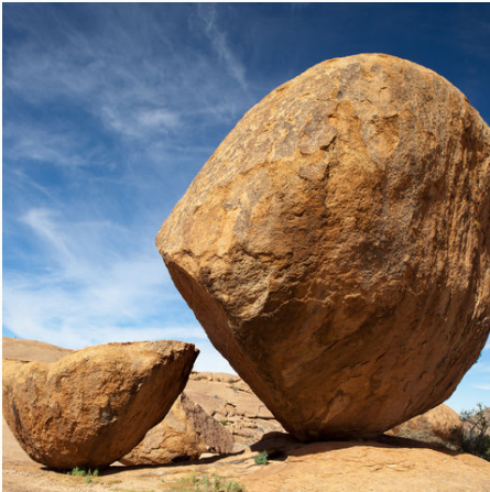
Steinkugel im Erongo Gebirge, Namibia