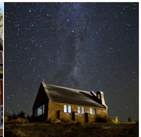
Sternenhimmel, Lake Tekapo, Neuseeland