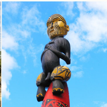
Traditionelle Maori-Schnitzerei, Neuseeland