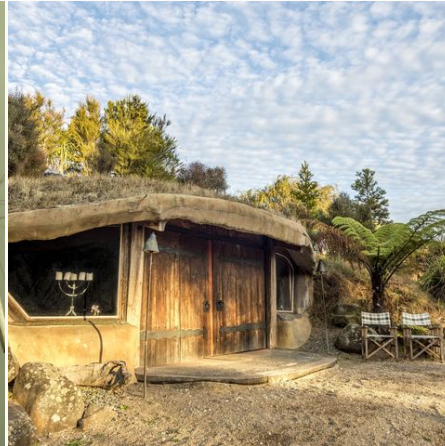
Hobbit-Haus bei Sonnenaufgang, Neuseeland