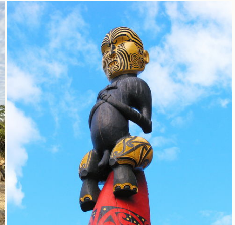
Traditionelle Maori-Schnitzerei, Neuseeland