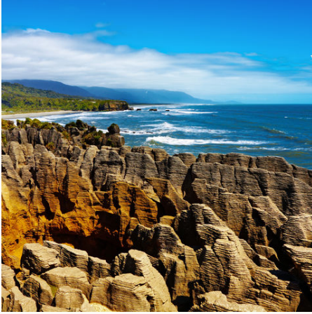
"Pancake Rocks" in Punakaiki, Neuseeland