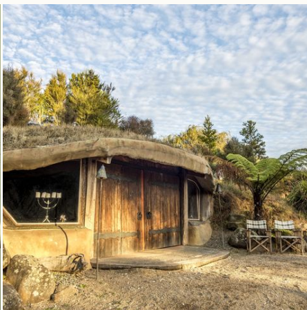
Hobbit-Haus bei Sonnenaufgang, Neuseeland