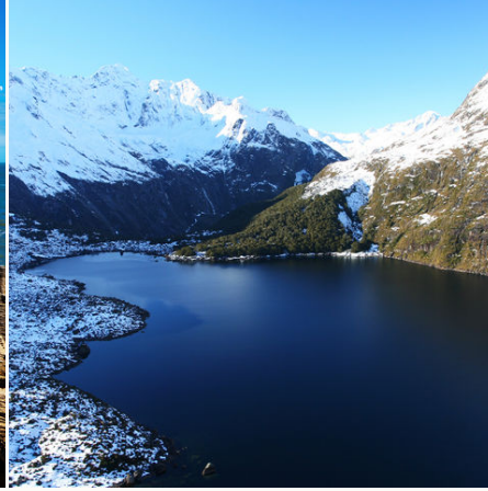
Gletschersee auf der Südinsel, Neuseeland