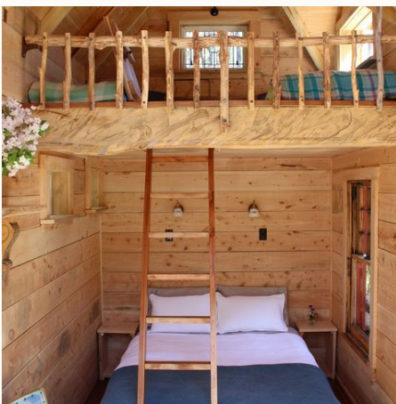
Schlafbereiche, Fossickers Hut, Neuseeland

Aotearoa – das "Land der langen weißen Wolke"! Entdecken Sie die magische Schönheit Neuseelands und fahren Sie dabei ganz individuell mit Ihrem Mietwagen von Christchurch zu den Catlins bis hin in den Norden nach Auckland und Northland. Erleben Sie Natur pur, Abenteuer und Action mit der ganzen Familie! Tauchen Sie ein in die Tierwelt Neuseelands und besuchen Sie den Drehort von "Herr der Ringe".