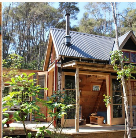
Mitten in der Natur, Fossickers Hut, Neuseeland