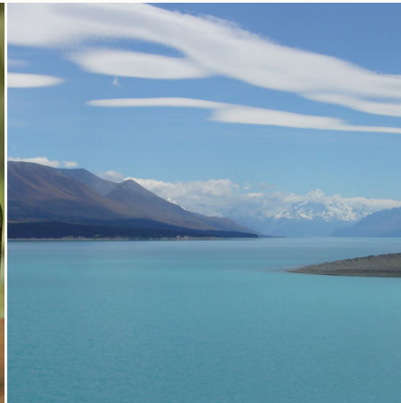
Seenlandschaft auf der Südinsel Neuseelands, Neuseeland