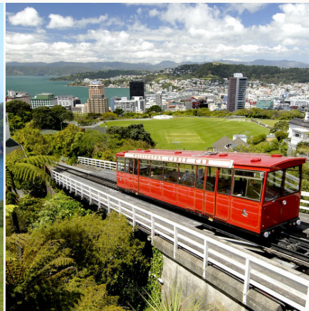
Cable Car in Wellington, Neuseeland