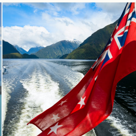
Neuseeländische Flagge, Neuseeland