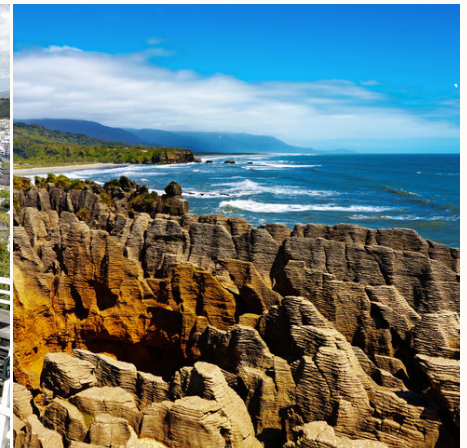
"Pancake Rocks" in Punakaiki, Neuseeland