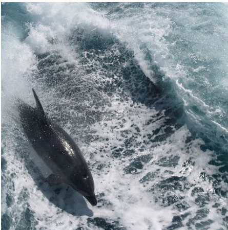
Delfin in der Bay of Islands, Neuseeland