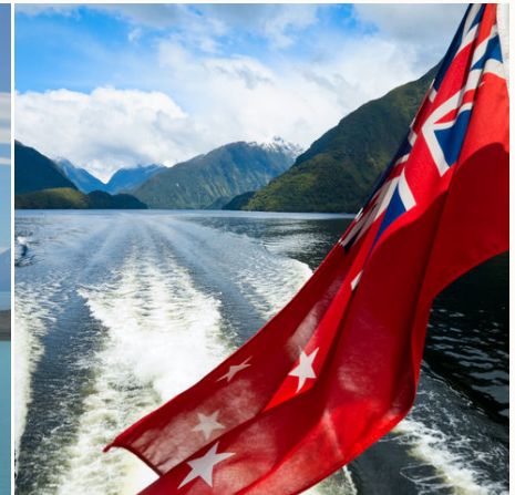
Neuseeländische Flagge, Neuseeland