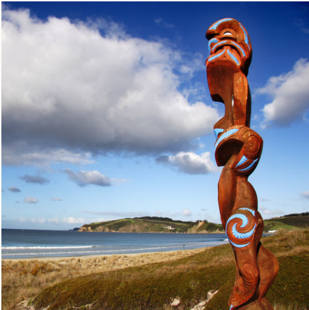
Raue Küstenlandschaft, Neuseeland