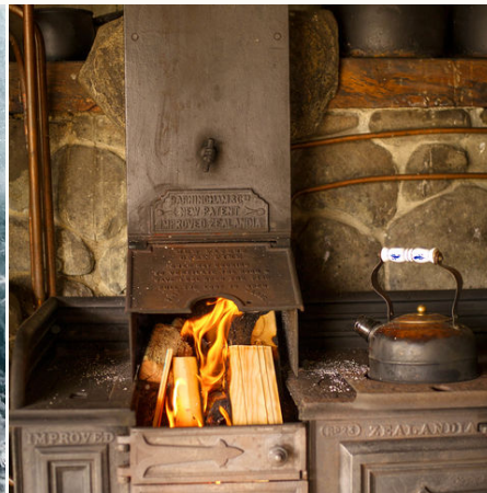
Holzofen in einem Erdhaus, Neuseeland