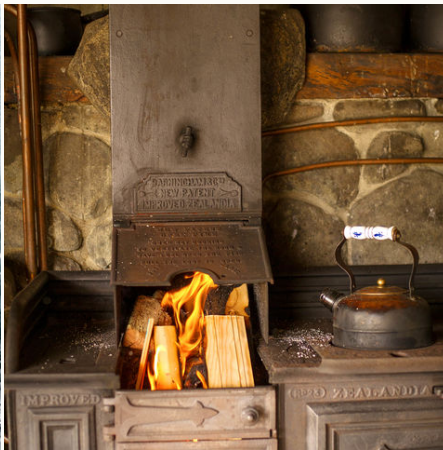
Holzofen in einem Erdhaus, Neuseeland