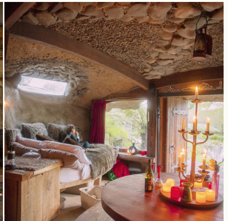
Gemütlicher Innenraum eines Erdhauses, Neuseeland