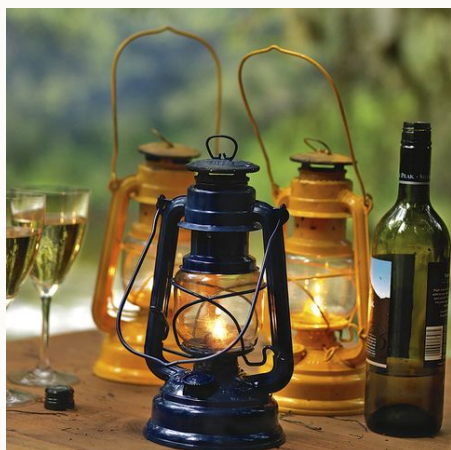
Romantik trifft auf Abenteuer, Neuseeland

Im neuseeländischen Winter von Mai bis September haben viele der besonderen Unterkünfte geschlossen. Wir fragen gern für Sie eine Alternative an.