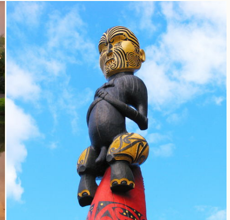
Traditionelle Maori-Schnitzerei, Neuseeland