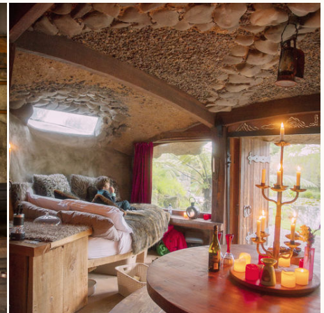
Gemütlicher Innenraum eines Erdhauses, Neuseeland