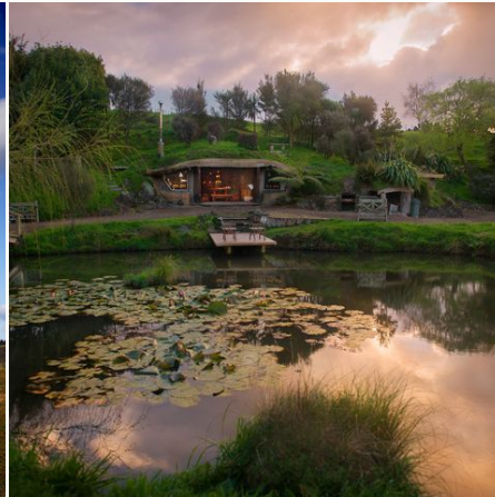
Wie im Auenland..., Neuseeland