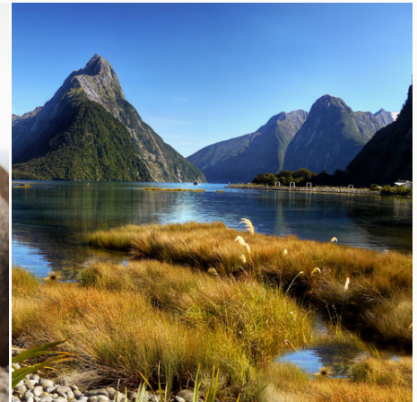
Sonniger Milford Sound, Neuseeland