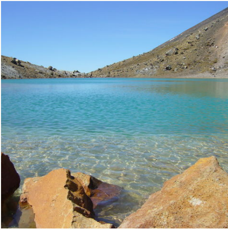
Klarer türkiser See im Tongariro-Nationalpark, Neuseeland