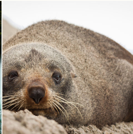
Robbe entspannt an der Kuste, Neuseeland