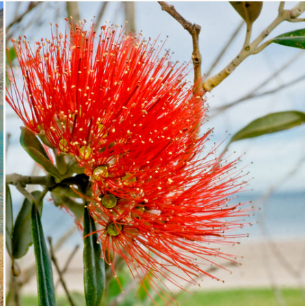
Pohutukawa (Christmas Tree Flower), Neuseeland