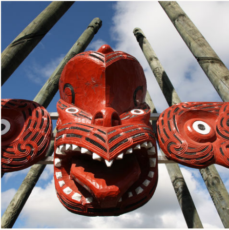
Traditionelle Maori-Schnitzereien, Neuseeland