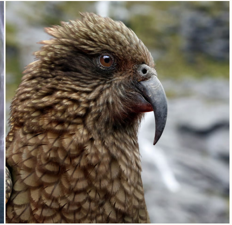
Frecher Kea in Fjordland, Neuseeland