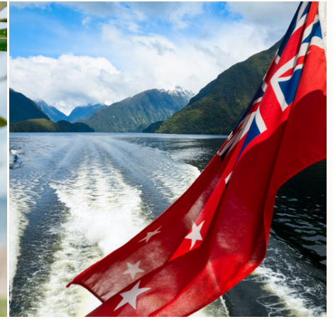
Neuseeländische Flagge, Neuseeland