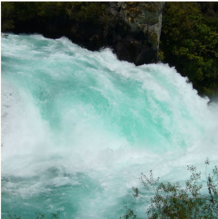
Tosende Huka-Fälle, Neuseeland

Die ganze Vielfalt Neuseelands wird Ihnen unsere deutschsprachige Reiseleitung bei dieser Neuseeland Rundreise in kleiner Gruppe mit vielen Insiderkenntnissen näher bringen: Neuseeland, das sind wunderschöne Fjorde, eisige Gletscher, immergrüner Dschungel, einzigartige Vulkanlandschaften und traumhafte Sandstrände. Die gesamte Vielfalt erleben Sie auf dieser Neuseeland-Rundreise. Neben der einzigartigen Landschaft treffen Sie hier auch auf eine einmalige Tierwelt. Halten Sie Ausschau nach dem Nationalsymbol dem Kiwi-Vogel mit seinem langen spitzen Schnabel. Auch der Takahe, der der Gattung der Purpurchühner angehört und der Kea, ein Bergpapagei, sind hier zuhause. Robben, Delfine und Pinguine fühlen sich an den Küsten des Landes ebenfalls sehr wohl. Kommen Sie mit auf eine Neuseeland Rundreise ins Land der weißen Wolke, wie es die Maori liebevoll nennen!