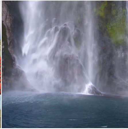
Wasserfall im Milford Sound, Neuseeland