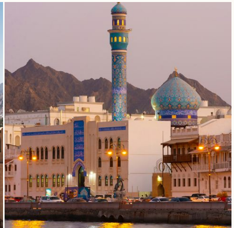
Küste von Muscat am Abend,