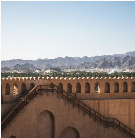
Festung von Nizwa,