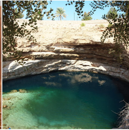
Felsenpool in den Bergen, Oman