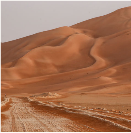
Rub Al Khali Wüste, Oman