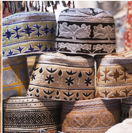
Traditionelle Kopfbedeckung der Männer, Oman