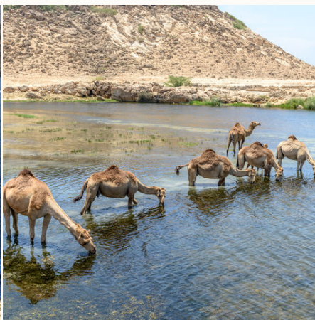
Trinkende Dromedare in Taqah, Oman