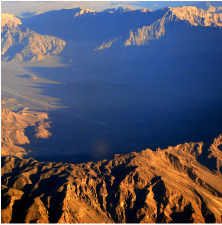
Shams Gebirge in der Nähe von Muscat, Oman