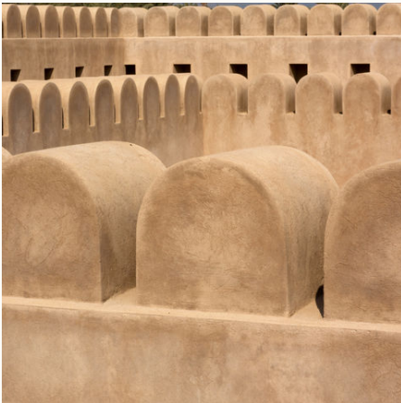
Festung in Khasab, Oman

Hinein in den Traum aus 1.001 Nacht. Unsere 23-tägige Geländewagen-Expeditionsreise durch den märchenhaften Orient mit einer Dhau-Fahrt verspricht ein Abenteuer der ganz besonderen Art zu werden. Diese Oman-Reise verbindet die unterschiedlichen Landschaftsformen aus Bergen, Stränden und Sandwüsten. Vier Tage durchqueren wir die Weiten der weltgrößten Sandwüste Rub al-Khali. Wir erkunden das mächtige Hajar-Gebirge, wandern durch die Sandwüsten Ramlat al-Wahiba und haben auch mal Zeit für einen Nachmittag am Meer. Auf unserer Route durch dieses atemberaubende Land besuchen wir die abgelegene Exklave Musandam, die weit in die Straße von Hormuz hineinragt, lassen uns von Händlerrufen der Souks von Dubai und Muscat treiben und treffen gastfreundliche und herzliche Omanis. Umfassend und mit leichten Wanderungen bestückt, öffnet diese Reise das Tor zu einer ganz besonderen neuen Welt.