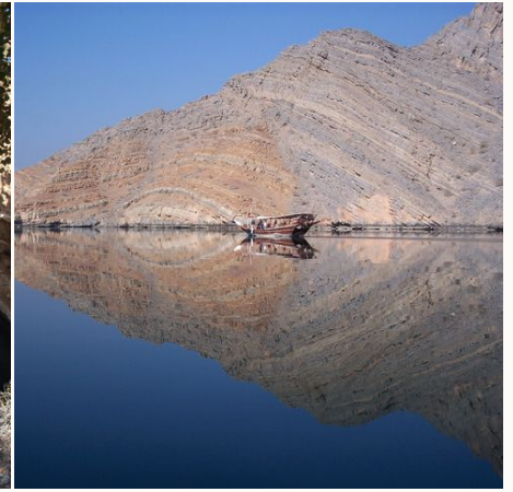
Eine Dhau in den Fjorden von Musandam, Khasab, Oman