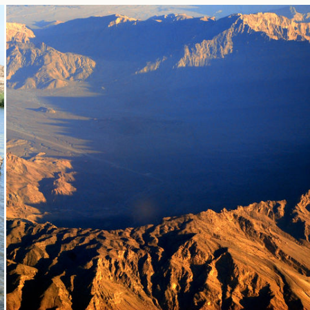
Shams Gebirge in der Nähe von Muscat, Oman