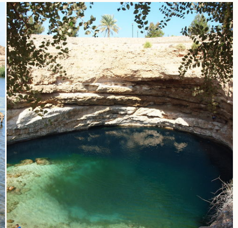
Felsenpool in den Bergen, Oman