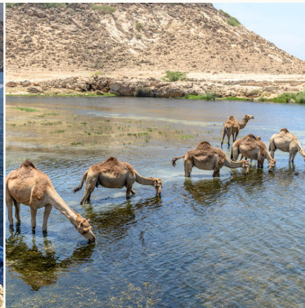
Trinkende Dromedare in Taqah, Oman