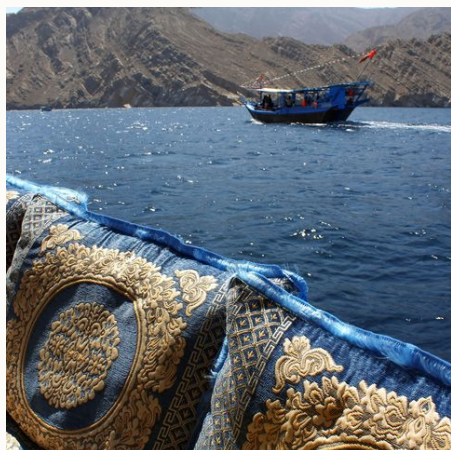
An Bord einer traditionellen Dhau, Oman

✓ Verfügbar ! Wenige Plätze – Ausgebucht ✓ garantierte Durchführung