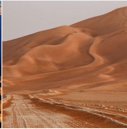
Rub Al Khali Wüste, Oman