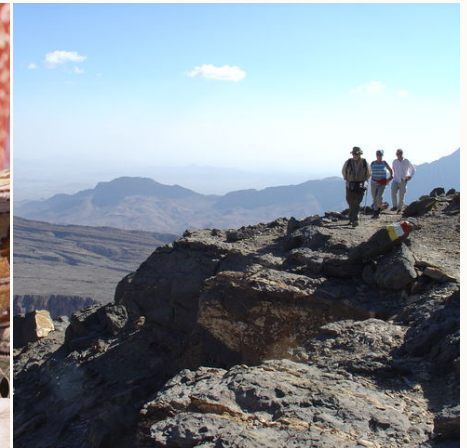
Wanderer in den Bergen, Oman