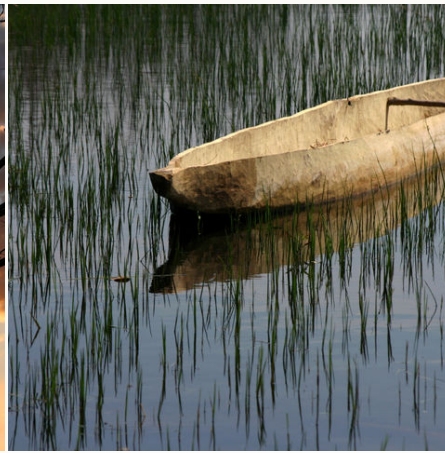
Traditioneller Einbaum, Botswana