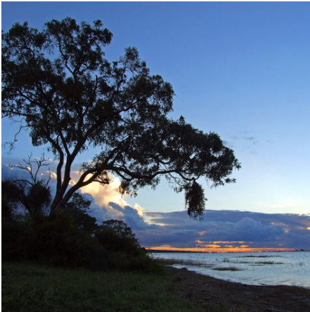
Sonnenuntergang am Chobe River, Botswana