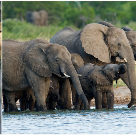
Elefantenherde am Wasserloch, Simbabwe