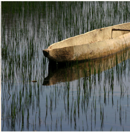
Traditioneller Einbaum, Botswana