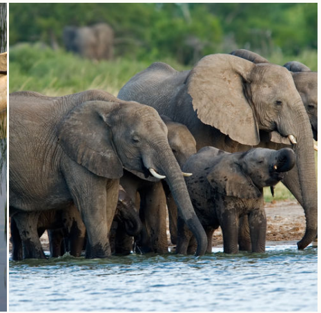
Elefantenherde am Wasserloch, Simbabwe