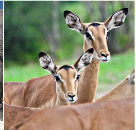
Gruppe von neugierigen Impalas, Botswana