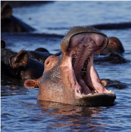
Gähnendes Nilpferd im Caprivi-Streifen, Botswana