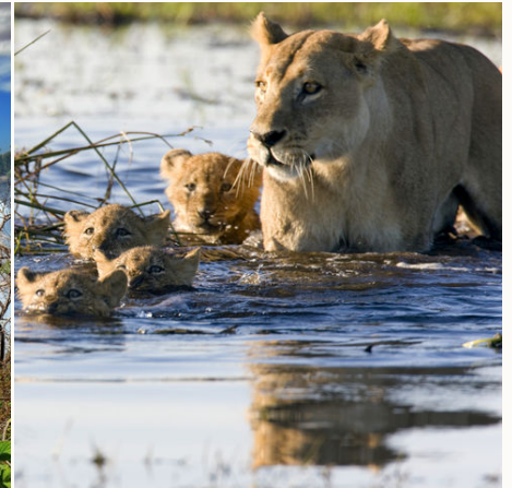
Schnell auf die andere Seite..., Botswana