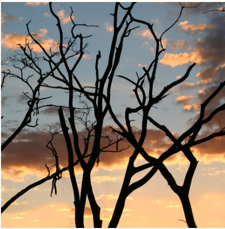
Sonnenuntergang hinter Bäumen, Simbabwe