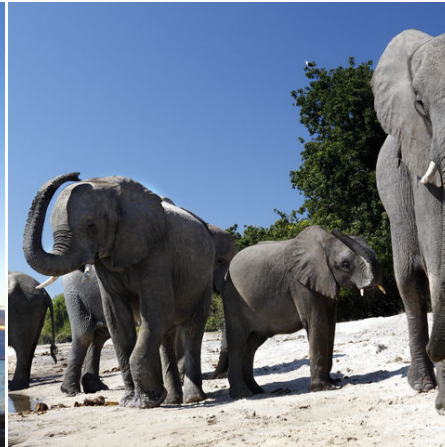
Elefantenherde am Chobe Fluss, Botswana