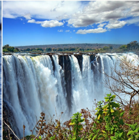
Die Viktoria-Fälle, Simbabwe