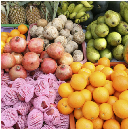
Leckere Früchte auf dem Markt, Sri Lanka

Halbrund wölbt sich die Höhle über Ihnen und gedämpfte Affenschreie dringen an Ihre Ohren. Sie befinden sich in guter Gesellschaft, denn viele zufriedene Buddha-Statuen lächeln Sie im Höhlentempel von Dambulla an. Später tauchen Sie tief in das Leben der Locals ein: Ein Dorfbewohner erzählt Ihnen beim Frühstück über sein Leben auf der Insel. Sie setzen sich. Erinnerungen an den Morgen kommen auf, als die Sonne einen rosa Zauber über die Berge strahlte – dem Beginn einer Wanderung, die jeden Schritt wert war. Gegen Ende Ihrer Sri Lanka Reise kehren Sie in die UNESCO-Stadt Galle ein und begeben sich auf eine Reise zurück in die Kolonialzeit während sie durch die mächtige, holländische Festung schlendern. Schließen Sie Ihre Reise mit einem leckeren Cocktail am Strand von Unawatuna ab.... Vom antiken Anuradhapura, über das Treffen mit Leoparden im Wilpattu Nationalpark und dem Löwenfelsen in Sigiriya - auf dieser Reise lassen Sie keinen Klassiker aus!