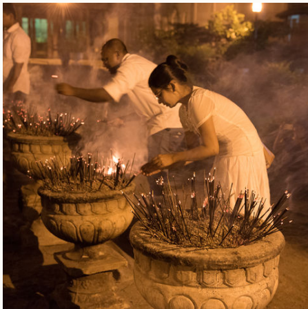
Traditionelle Zeremonie in Kandy, Sri Lanka