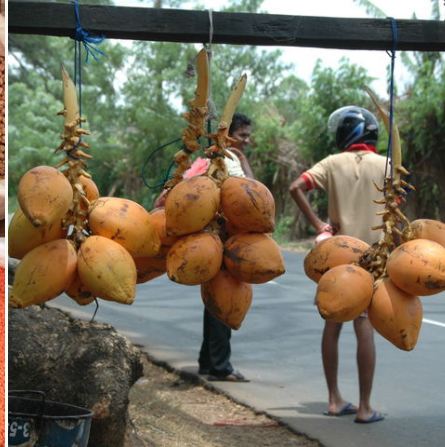
Frische Kokosnüsse in Sri Lanka, Sri Lanka