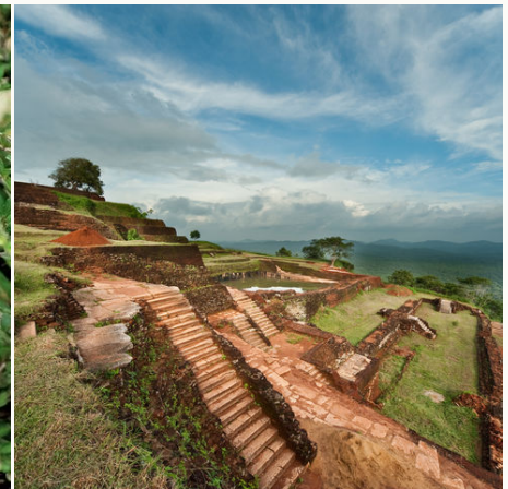
Legendäre Felsenfestung von Sigiriya, Sri Lanka