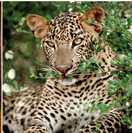
Leopard im Nationalpark, Sri Lanka