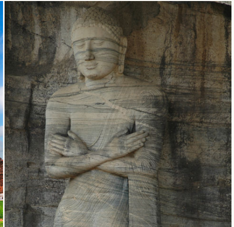
Statue in Polonnaruwa, Sri Lanka