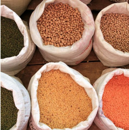
Bunte Vielfalt auf dem Markt, Sri Lanka

Bei Reisen über Weihnachten und Silvester kann es zu Feiertagsaufpreisen kommen. Fragen Sie gerne ein konkretes Angebot zu diesen Terminen an.