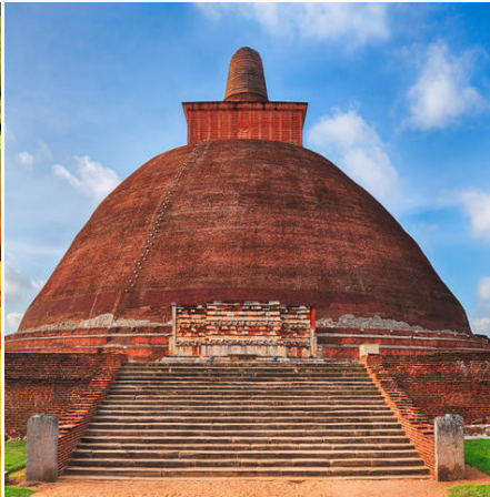
Dagoba in Anuradhapura, Sri Lanka