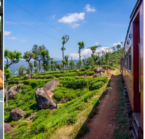
Per Zug durch die Teeplantagen, Sri Lanka