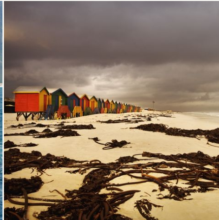
Farbige Hütten am Strand von Muizenberg bei Kapstadt, Südafrika