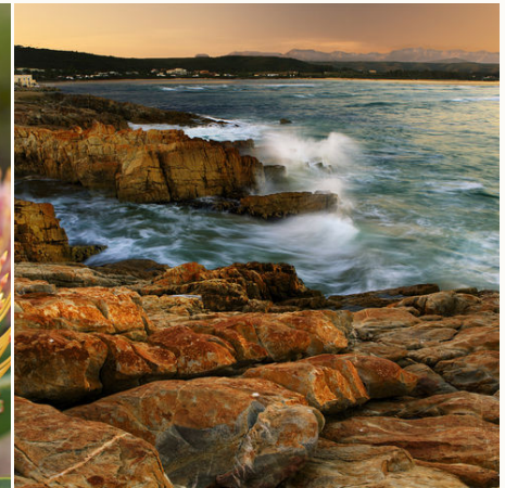
Küste von Plettenberg Bay an der Garden Route, Südafrika