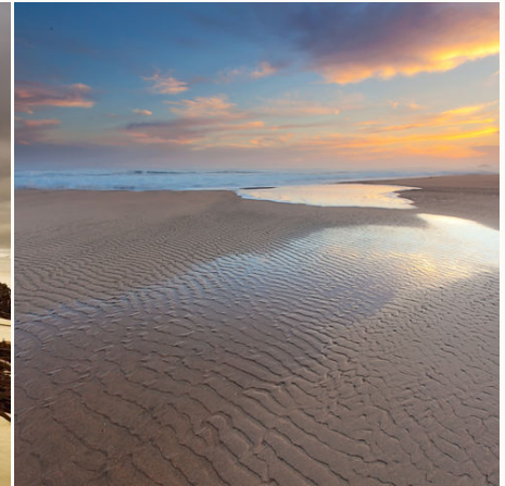
Küstenlandschaft and der Gardenroute, Südafrika