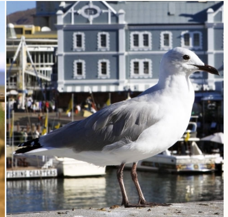
Seemöwe an der V&A Waterfront in Kapstadt, Südafrika