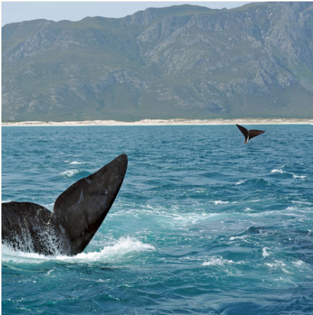
Walfinne an der Küste, Südafrika