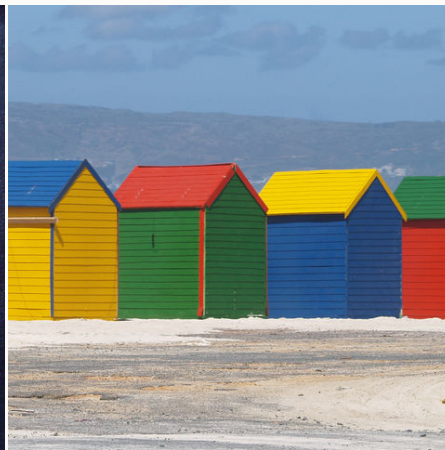
Farbenfrohe Strandhäuser, Südafrika