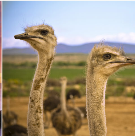
Strausse in der Karoo, Südafrika