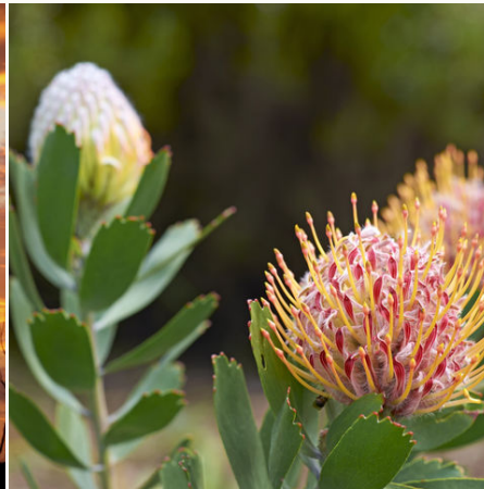
Protea-Pflanze im Botanischen Garten von Kapstadt, Südafrika