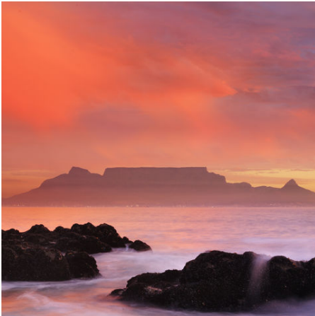
Blick auf Kapstadt mit dem Tafelberg von Blouberg Strand, Südafrika