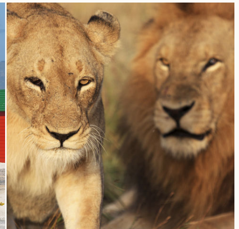
Stolzes Löwenpaar, Südafrika