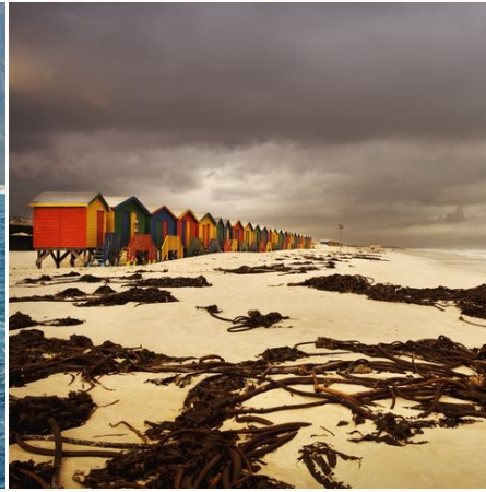
Farbige Hütten am Strand von Muizenberg bei Kapstadt, Südafrika