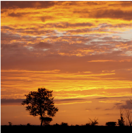
Typisch afrikanischer Sonnenuntergang in der Steppe, Südafrika

Erleben Sie eine bunte Mischung aus lebhafter Marktatmosphäre, faszinierenden Landschaften und spannenden Tierbegegnungen! Im heiteren Stadtviertel Victoria and Alfred Waterfront finden Sie zahlreiche Antiquitäten und traditionelles Handwerk - der ideale Ort, um das passende Souvenir zu finden. Lassen Sie sich beeindrucken von den bezaubernden Küstenabschnitten der Garden Route mit ihren rauen Küstenregionen, üppigen Regenwäldern und wunderschönen Stränden. Begeben Sie sich auf die Suche nach Delfinen, Seepferdchen und Walen in der Knysna Lagune. Unternehmen Sie spannende Pirschfahrten im Addo Elephant Nationalpark. Wandern Sie entlang der atemberaubenden Felsküste von Jeffrey's Bay, wo Sie den Anblick tiefer Schluchten und Urwaldbäume genießen und schließlich am Strand entspannen und die Reise Revue passieren lassen können.