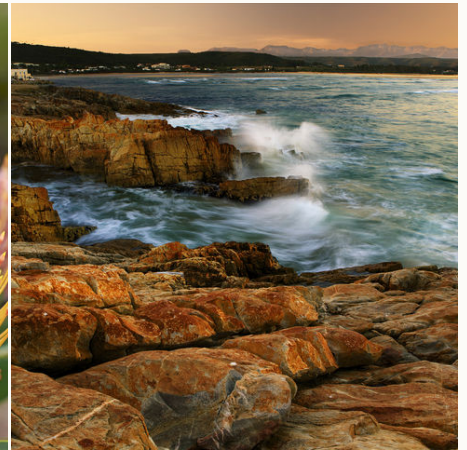
Küste von Plettenberg Bay an der Garden Route, Südafrika