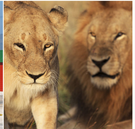
Stolzes Löwenpaar, Südafrika