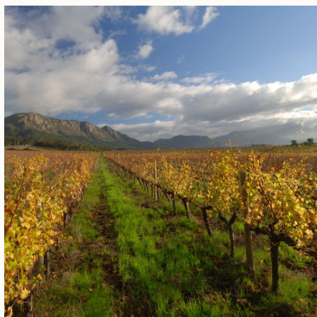
Früher Wintereinzug über Kapstadts Weinbergen, Südafrika