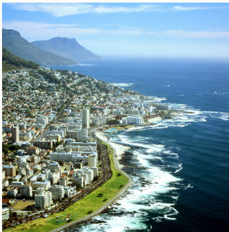
Luftaufnahme von Kapstadt, Südafrika

Veranstalter: a&e erlebnis:reisen, eine Marke der Boomerang-Reisen GmbH Stand: 06.09.21 (BG)