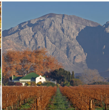
Weinberge in Kapstadt, Südafrika