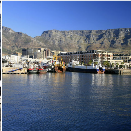
Blick auf Kapstadt mit dem Tafelberg, Südafrika