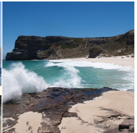
Strand zwischen Kapstadt und dem Kap der guten Hoffnung, Südafrika