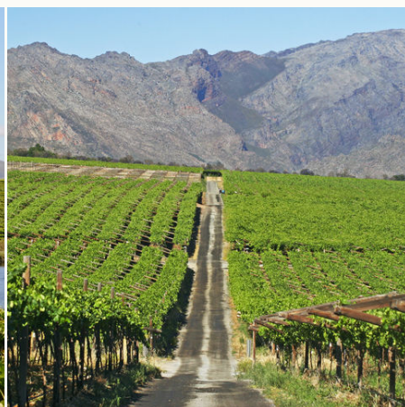
Weinfarm im Hex Valley, Südafrika