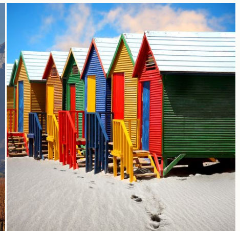
Bunte Strandhäuser in St. James, Kapstadt, Südafrika