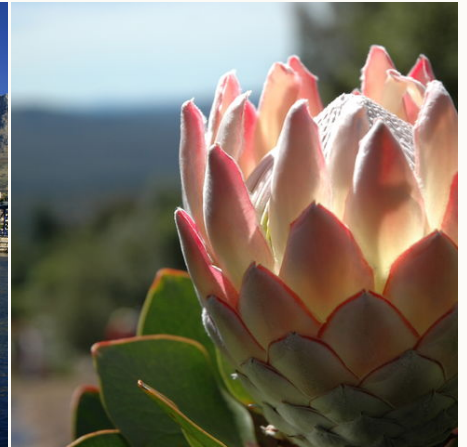
Die Nationalblume Südafrikas "Pink Protea", Südafrika