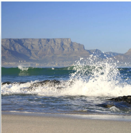
Blick auf den Tafelberg, Südafrika