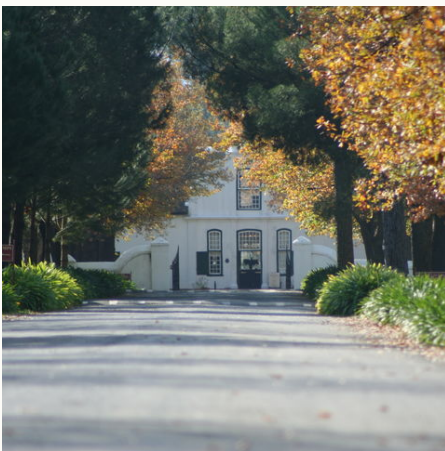
Kapholländisches Weingut, Südafrika

Nachdem Sie Kapstadt und seine Victoria und Alfred Waterfront besucht haben, geht es über die Whale Coast Route nach Hermanus zur Walbeobachtung. Anschließend wird die Weinregion vor den Toren Kapstadts und seine charmanten Städte Stellenbosch, Paarl und Franschhoek erkundet, bevor es wieder zurück nach Kapstadt geht. Diese 6-tägige Route durch das Weinland und Kapstadt bildet einen idyllischen Start oder Abschluss jeder Südafrika Reise!