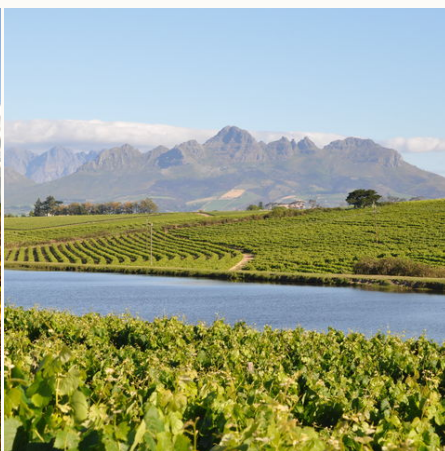
Fruchtbares Weinbaugebiet bei Stellenbosch, Südafrika