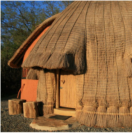
Traditionelle Swaziland Hütte, Südafrika