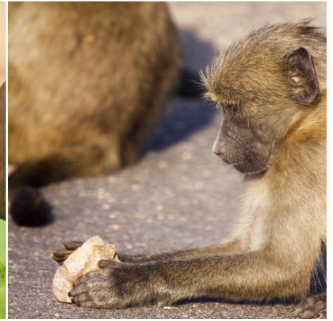
Kleiner Affe im Krüger Nationalpark, Südafrika