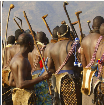
Swazi Häuptling während eines traditionellen Tanz, Südafrika