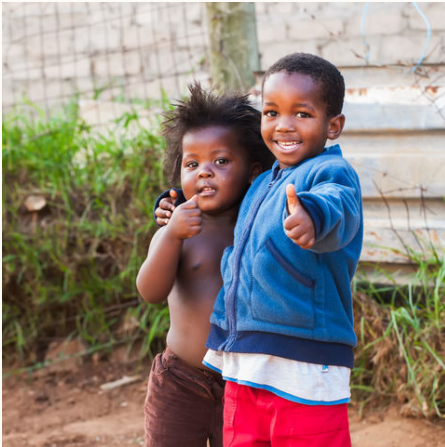
Fröhliche Kinder, Südafrika