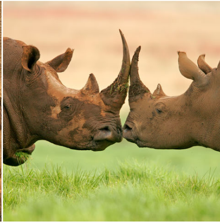
Zwei weiße Nashörner, Südafrika