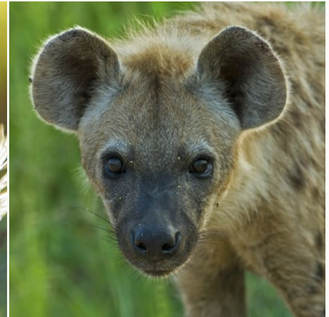
Südafrikanische Hyäne, Südafrika