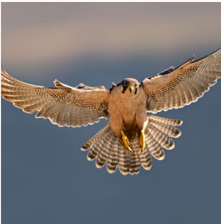
Falke im Flug, Südafrika

Faszinierende Landschaften, unberührte Natur und unvergessliche Ausblicke entlang der Panorama Route in Mpumalanga und einmalige Safarierlebnisse im bekannten Krüger Nationalpark werden Ihnen unvergessliche Eindrücke auf Ihrer Südafrika Mietwagenrundreise verschaffen. Die großartigen Naturlandschaften Swasilands und die Fauna und Flora des einzigartigen Ökosystems iSimangaliso Wetland Park in der Küstenregion KwaZulu Natals runden diese Tour perfekt ab. Wer Kapstadt nicht verpassen möchte ergänzt diese Reise mit den Bausteinen "Kap & Wein" oder "Kapstadt & Garden Route".