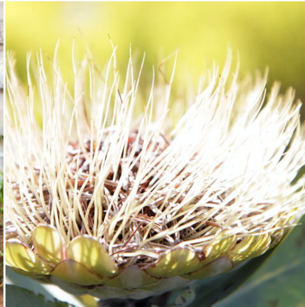
Wilde gelbe Protea, Südafrika