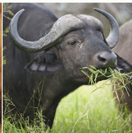
Afrikanischer Büffel beim Grasens, Südafrika