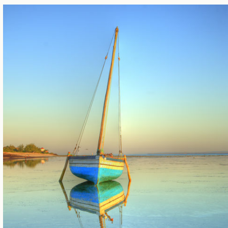
Eine Dhau, ein arabisches Segelboot, im paradiesischen Meer, Mosambik