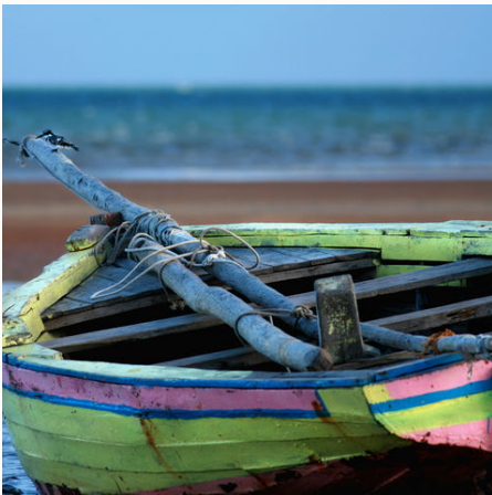
Buntes Boot bei Ebbe an der Küste, Mosambik

Spannende Wildbeobachtungen zu Fuß und per Fahrzeug, die unberührten weißen Strände von Südafrika und Mosambik: All dies erwartet uns auf einer aktiven Tour. Wir übernachten in festen Unterkünften: in Gasthäusern, einfachen Chalets und Casitas/Hütten direkt am Strand. In einer kleinen internationalen Gruppe bereisen wir die aufregendsten Ziele der Region! Uns erwarten Safaris in dem Mkuzi Game Reserve, das für die seltenen Spitzmaulnashörner bekannt ist, sowie spannende Pirschfahrten im Krüger-Nationalpark, der Heimat der Big Five. In der Wildnis des Zululandes unternehmen wir Wanderungen. Im Kosi Bay Nature Reserve lässt sich die wunderbare Landschaft mit seinen türkisfarbenen Seen, Flussmündungen, Dünen und Mangroven am besten zu Fuß oder bei einer Bootsfahrt erkunden. Mosambik, einst unter dem Einfluss arabischer Händler und Handelsplatz für Elfenbein und Gewürze, lockt mit einer exotischen Mischung aus afrikanischer Kultur und portugiesischem Erbe. Endlos lange Strände laden zum Schwimmen, zu Strandspaziergängen, zum Schnorcheln und zum Entspannen ein.