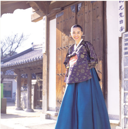
Koreanerin in traditioneller Kleidung, Südkorea