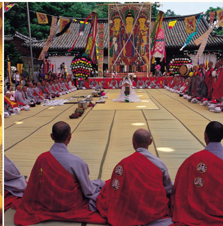
Buddhistische Zeremonie im Bongwonsa Tempel, Südkorea