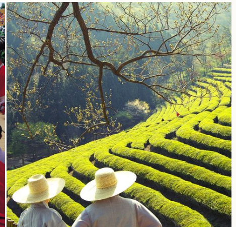
Morgenstimmung auf einem Teefeld, Südkorea