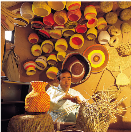
Koreaner fertig traditionelle Körbe an, Südkorea

"Das Land der Morgenstille" wird Korea auch genannt. Eben waren wir noch umgeben von blinkenden Billboards, Wolkenkratzern und Food-Ständen in Seoul. Jetzt dehnen sich unberührte Landschaften vor uns aus und wir sind ganz im Einklang mit der Natur. Trotz der rasanten Entwicklung zu einem aufstrebenden Tigerstaat hat Südkorea seine Traditionen bewahrt. Wir wandeln auf den Spuren der über 5.000 Jahre alten koreanischen Geschichte und tauchen ein in die traditionelle Kultur des Landes. Zwischen ehrwürdigen Tempeln und bunter Moderne – dies ist eine Reise, wie wir sie kein zweites Mal erleben werden.