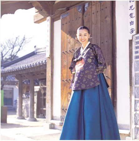
Koreanerin in traditioneller Kleidung, Südkorea