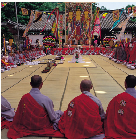
Buddhistische Zeremonie im Bongwonsa Tempel, Südkorea