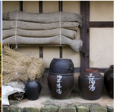
Gefäße im denkmalgeschützten Dorf, Südkorea