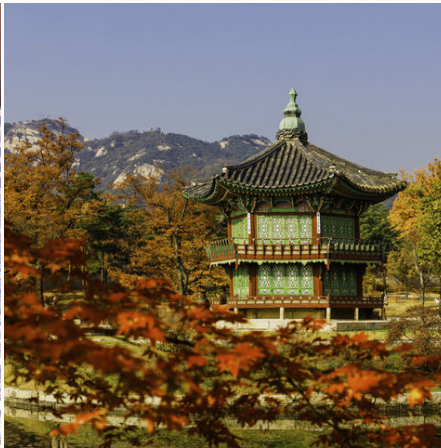
Gyeongbokgungs Palast während der Herbstlaubfärbung, Südkorea