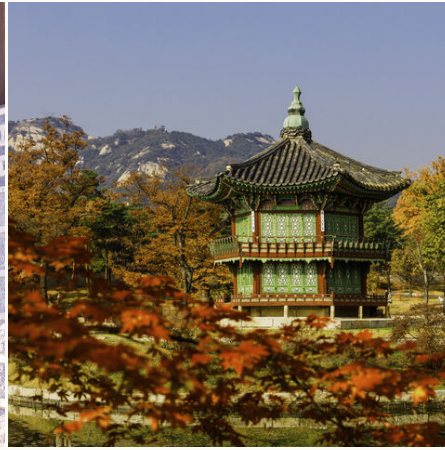
Gyeongbokgung Palast während der Herbstlaubfärbung, Südkorea