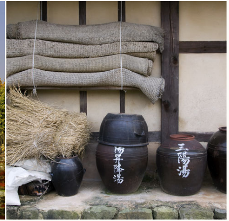
Gefäße im denkmalgeschützten Dorf, Südkorea