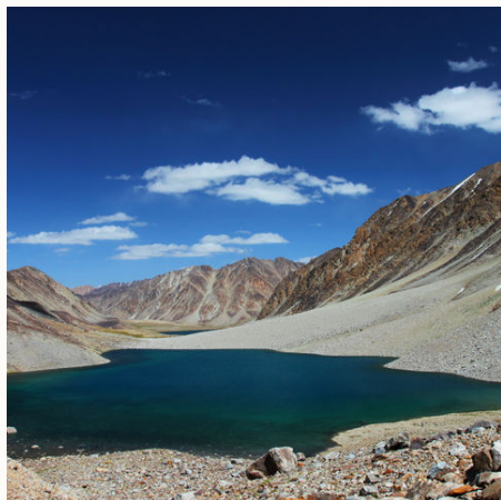
Dunkelblauer See im Pamir Gebirgszug, Tadschikistan

✓ Verfügbar ! Wenige Plätze – Ausgebucht ✓ garantierte Durchführung