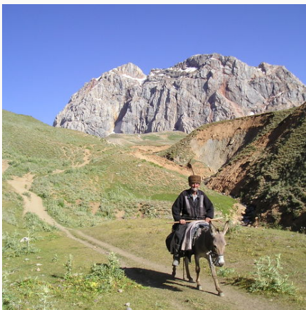
Tadschikischer Mann auf einem Esel, Tadschikistan