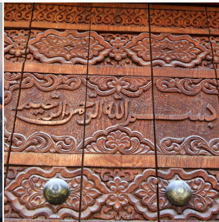
Verzierte Tür einer Moschee, Tadschikistan