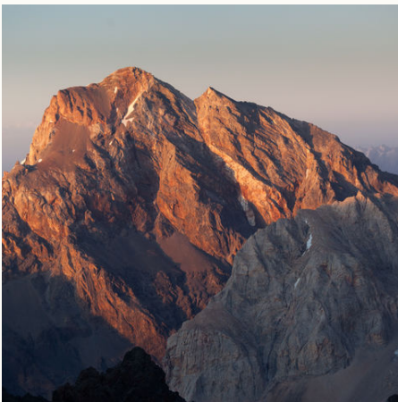
Fan Mountains von Chimtarga, Tadschikistan

Die Bergwelt ruft! Tadschikistan gehört zu den seltener besuchten Regionen unserer Erde und ist vielleicht auch dadurch ein besonders reizvolles Ziel. Die freundlichen Dorfbewohner im tadschikischen Hochgebirge geben Ihnen ein Zuhause für die Zeit Ihres Aufenthalts. Sie starten zu Wanderungen in die faszinierende Bergwelt des Fan-Gebirges, das mit den vielen türkisfarbenen Seen zwischen den schneebedeckten Gipfeln oftmals als eine der schönsten Bergregionen Asiens bezeichnet wird. Einen Blick in die Vergangenheit werfen Sie in Pandschakent und Chudschand. Die Ruinen der Jahrtausend alten Städte versprühen ein besonderes orientalisches Flair. Kombinieren Sie diesen Baustein beispielsweise mit einer anschließenden Reise durch das benachbarte Usbekistan. Gerne machen wir Ihnen ein "maßgeschneidertes" Angebot.