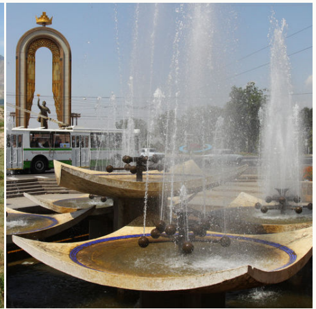
Ismail Samani Monument in Duschanbe, Tadschikistan