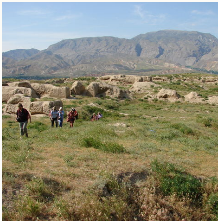
Die Ruinen von Pandschakent, Tadschikistan