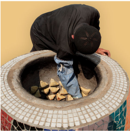
Mann backt Samosa in traditionellem Ofen, Tadschikistan