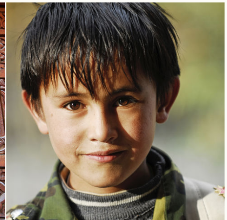
Lächelnder tadschikischer Junge, Tadschikistan