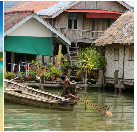
Schwimmende Fischerhäuser, Thailand