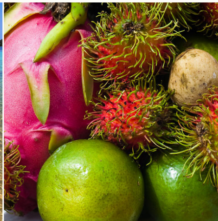
Verschiedene exotische thailändische Früchte, Thailand