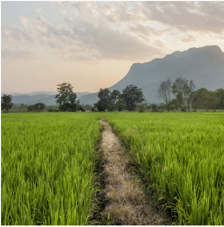
Pfad durchs Reisfeld, Thailand