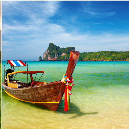
Boot im kristallklaren Wasser, Thailand