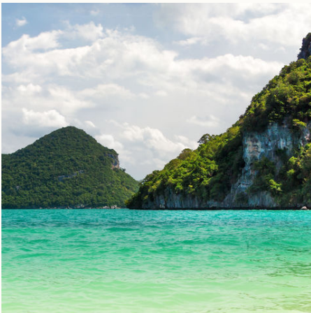
Blick aufs Wasser und die vorgelagerten Inseln, Thailand

Thailand – das sind Traumstrände, meterhohe Felsformationen und Meer! Beim Inselhopping auf dieser Thailand-Reise erkunden Sie neben weißen Sandstränden und sattgrünem Dschungel auch geheimnisvolle Höhlen die ins türkise Wasser des kristallklaren Ozeans übergehen. Sie erfahren die Inseln mit kleinen Booten und kommen mit der einheimischen Bevölkerung in Kontakt, die Sie bei ihrer alltäglichen Arbeit begleiten. Zwischen Sonne am Strand tanken, Dschungelwanderungen und Schnorcheln können Sie mit den Bewohner kunstvolle Batikmuster kreieren und Miniaturschiffe bauen. Besondere Highlights sind auch die romantischen Abende am Strand und die Bungalows in unmittelbarer Strandlage. Sie sind mittendrin im Paradies!