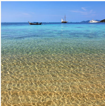
Blick aufs Wasser von Koh Lanta aus, Thailand