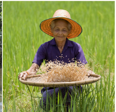
Eine Arbeiterin im Reisfeld, Thailand