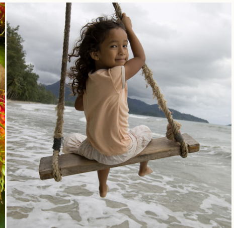
Thailändische Lebensfreude, Thailand