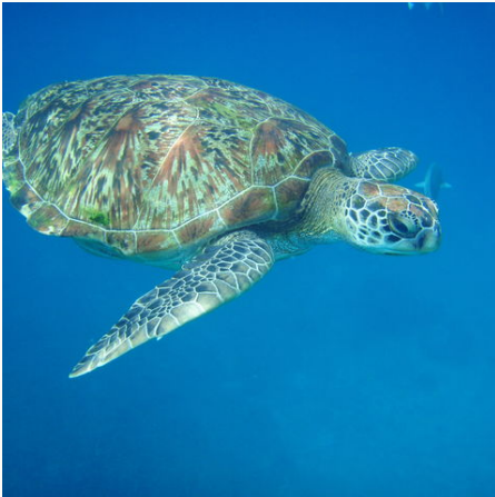
Begegnungen der Unterwasserwelt, Thailand