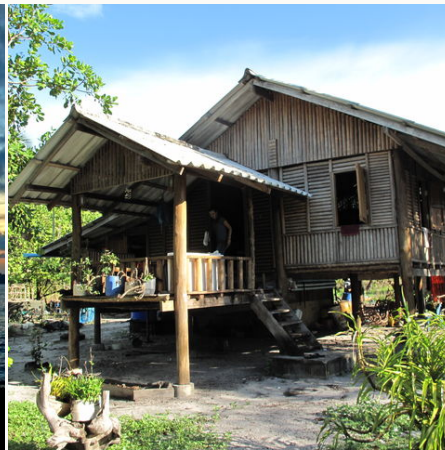
Die Dorfhütte einer Familie des Projektes, Thailand