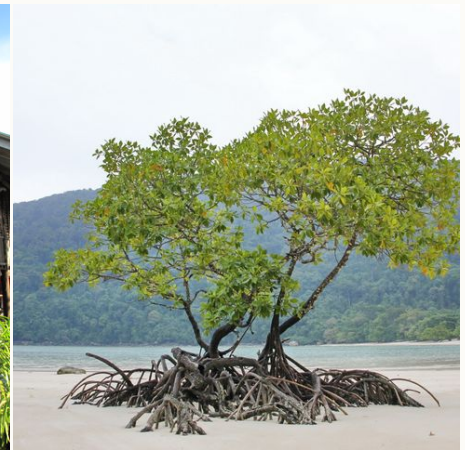
Mangroven am Strand, Thailand