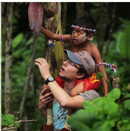
Gemeinsam den Dschungel erkunden, Thailand