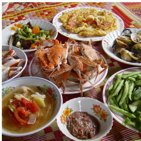
Typisch thailändische Küche beim Kocherlebnis, Thailand

Die Reise kann zu Ihrem Wunschtermin individuell zu zweit oder in privater Kleingruppe angeboten werden. Der Reisepreis ist abhängig von der Teilnehmerzahl.