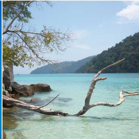
Strand in der Andaman-See, Thailand