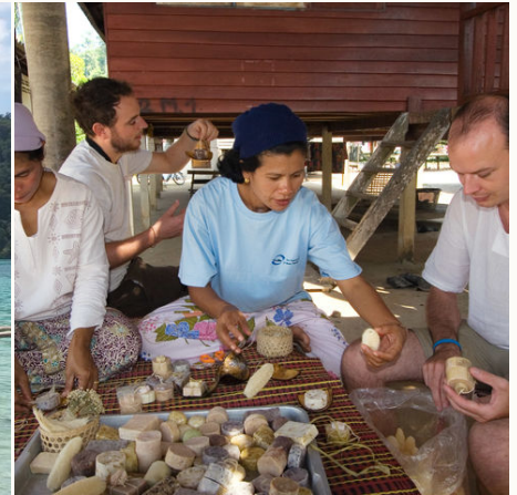
Dorfbewohner und Touristen erstellen gemeinsam Seife, Thailand