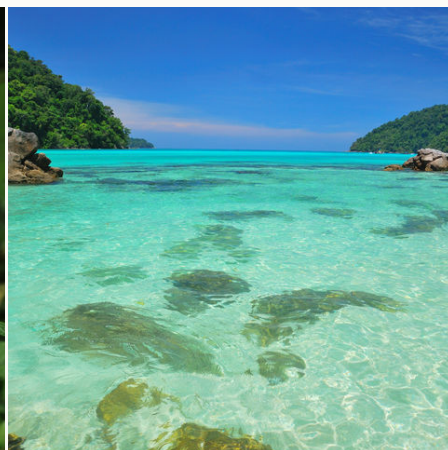
Kristallklares Wasser und Idylle auf Koh Sorin, Thailand