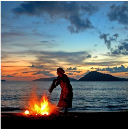
Lagerfeuer am Strand mit einem Ausblick auf die vorgelagerten Inseln, Thailand