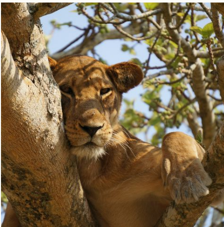
Baumkletternder Löwe in der Ishasha Region, Uganda

Die grüne Perle Afrikas wartet! Unsere Uganda Reise führt uns durch die Highlights Ugandas. Wir starten im Murchison Nationalpark, wo sich die tosenden Wassermassen des Nils ihren Weg durch eine schmale Felsspalte bahnen. Im Kibale Forest Nationalpark, mit einer der höchsten Primatendichten der Welt, hoffen wir bei einer Fußpirsch auf Schimpansen zu treffen. Abwechslungsreiche Landschaften erwarten uns im Queen Elisabeth Nationalparks und im Ishasha Nationalpark gehen wir auf Suche nach den berühmten baumkletternden Löwen. Dann endlich im Bwindi Nationalpark treten wir den Gorilla-Trek an. Die Bergregenwälder sind die Heimat der sanften Riesen und nach einer anstrengenden Wanderung durch den Regenwald, werden wir hoffentlich mit dem majestätischen Anblick der seltenen Tiere belohnt. Unvergessliche Pirschfahrten durch die Savanne des Lake Mburo Nationalparks bilden das Ende unserer Abenteuerreise, bevor wir in Entebbe Abschied von diesem einmaligen Land nehmen.