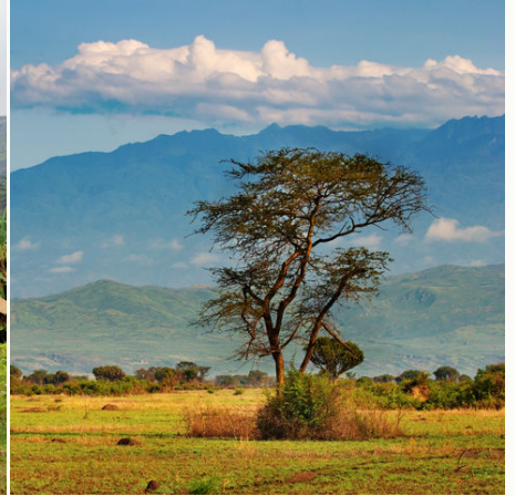
Afrikanische Savanne, Uganda