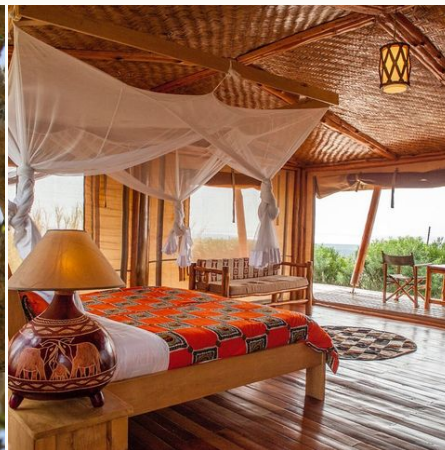
Zimmer in der Marafiki Lodge, Uganda