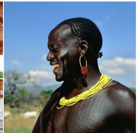
Lachender Mann, Uganda