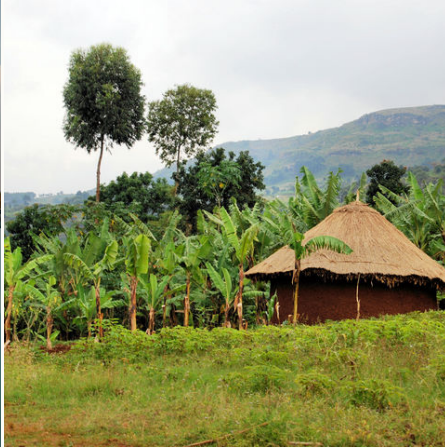
Hütte in den bergigen Höhen von Kapchorwa, Uganda