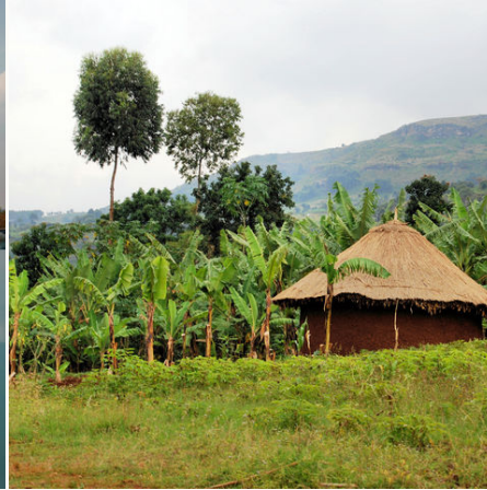
Hütte in den bergigen Höhen von Kapchorwa, Uganda