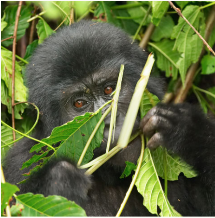
Junger Gorilla, Uganda