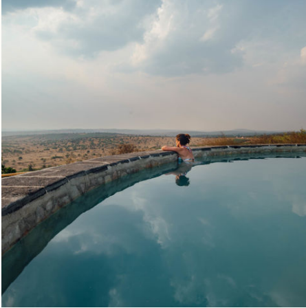
Entspannung in der Rwakobo Rock Lodge im Lake Mburo Nationalpark, Uganda

Die Durchführung der Reise erfolgt in Zusammenarbeit mit einem befreundeten örtlichen Veranstalter. Stand: 23.07.2024 (SP)