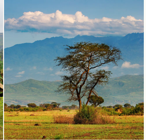
Afrikanische Savanne, Uganda