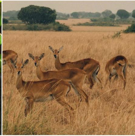
Antilopen im Queen Elisabeth Nationalpark, Uganda