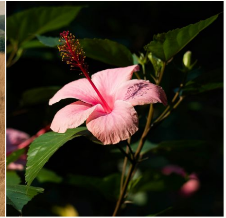
Blühender Hibiskus im Bwindi Nationalpark, Uganda