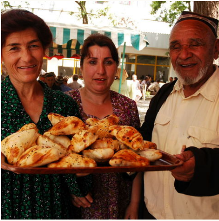
Herzliche Tadschiken, Tadschikistan