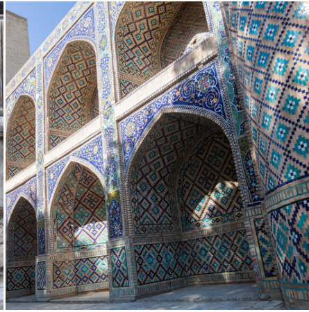
Eingang der Ulughbek-Medrese in Buchara, Usbekistan