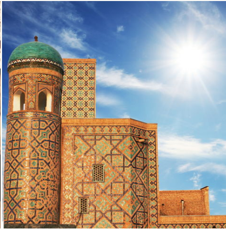
Palast in Buchara, Usbekistan