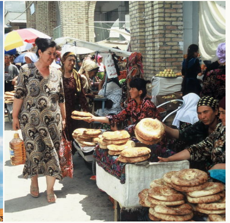
Traditionelles Brot auf einem Markt, Usbekistan