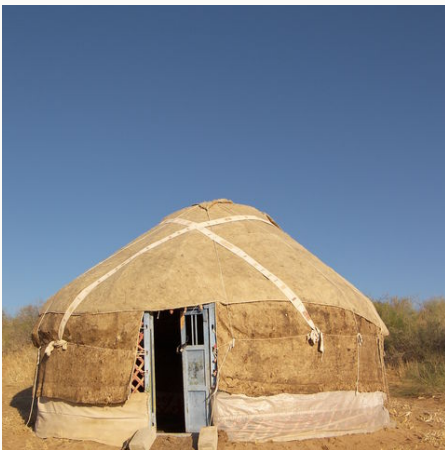
Jurte in Usbekistan, Usbekistan

Erleben Sie auf einer außergewöhnlichen Reise diese historisch und landschaftlich faszinierenden Länder. Sie besuchen die bedeutendsten Zentren entlang der legendären Seidenstraße und lernen die einmalige Schönheit der orientalischen Architektur von Samarkand, Buchara und der Oasenstadt Chiwa kennen. Auf dieser Tadschikistan- und Usbekistan-Reise übernachten Sie in einer traditionellen Jurte und lernen beim Besuch von einheimischen Familien mehr über den Alltag in Usbekistan und Tadschikistan. Im touristisch noch relativ unberührten Hochgebirgsland Tadschikistan erfahren Sie auf leichten Wanderungen die einmalige Bergwelt der Fan Mountains, stetig umgeben von 5.000 m hohen Giganten! Tauchen Sie ein in ein blau-türkises Farbenmeer der Medresen, in eine Welt von bedeutenden Moscheen und grazilen Minaretten, in ein Märchen aus Tausendundeiner Nacht. Kristallklare türkisfarbene Bergseen, schneebedeckte Gipfel und die Gastfreundschaft der Usbeken und Tadschiken erwarten Sie!