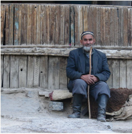
Tadschike vor seiner Berghütte, Tadschikistan