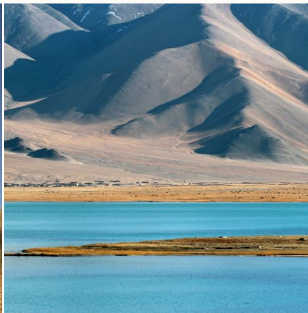
Karakul See in den Fan Mountains, Tadschikistan