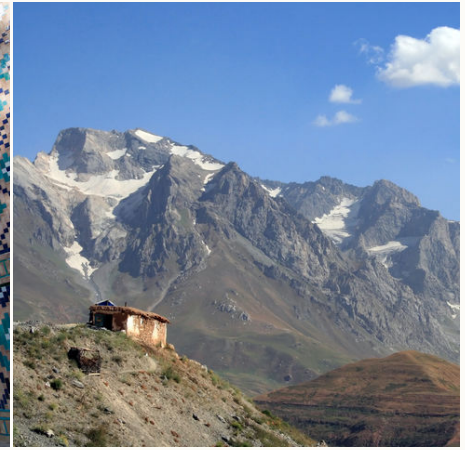
Einsame Hütte in den Bergen, Tadschikistan