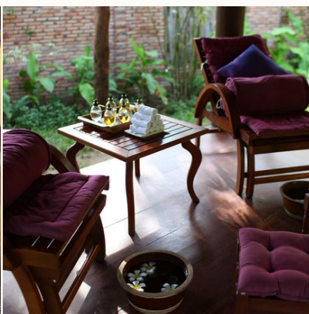
Fußmassage im Ho Tram beach Resort, Vietnam