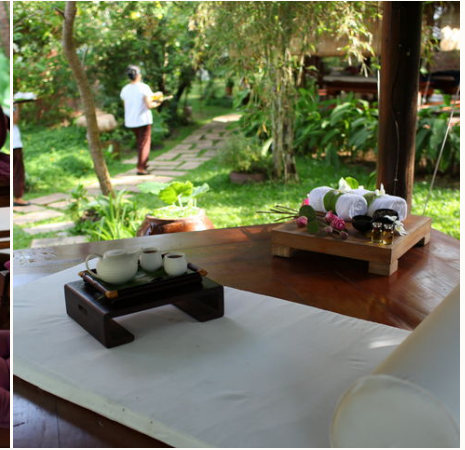
Garten im Spa-Bereich, Vietnam