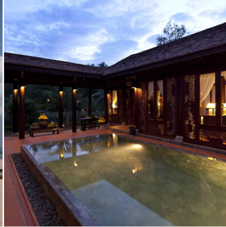
Beleuchteter Pool, Vietnam