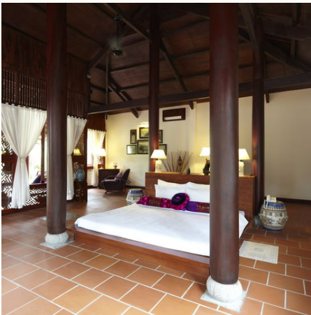
Zimmer des Ho Tram Beach Resort, Vietnam

Tauchen Sie ein in die abgeschiedene und einmalige Atmosphäre des Ho Tram Beach Resorts: Die mit viel Liebe zum Detail und nach traditionellem Vorbild gestaltete Anlage lädt ein, die Seele mal ordentlich baumeln zu lassen. Ob im Frischwasserpool, dem hauseigenen Restaurant, beim Wellness oder bei kilometerlangen Spaziergängen am weißen Sandstrand – bei Ihrem 5-tägigen Aufenthalt steht Relaxen fest auf dem Programm!