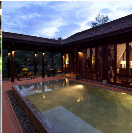
Beleuchteter Pool, Vietnam