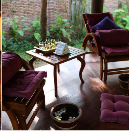
Fußmassage im Ho Tram beach Resort, Vietnam