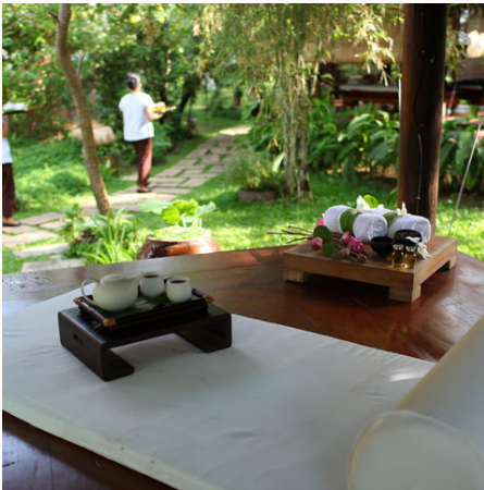
Garten im Spa-Bereich, Vietnam