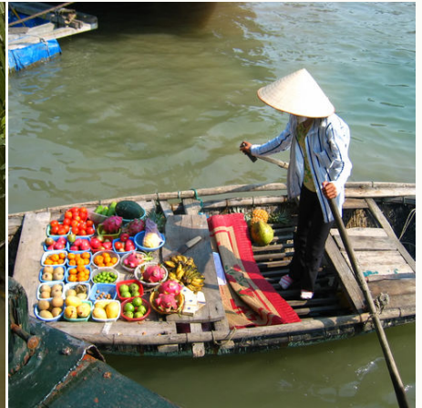
Frau verkauft auf einem schwimmenden Markt, Vietnam