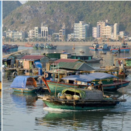
Hausboote in der Nähe der Cat Ba Insel, Vietnam