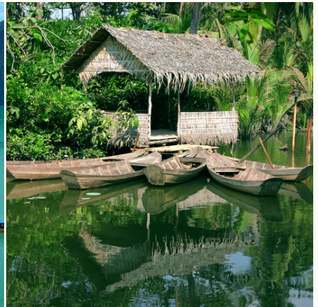
Hütte im Mekong Delta, Vietnam