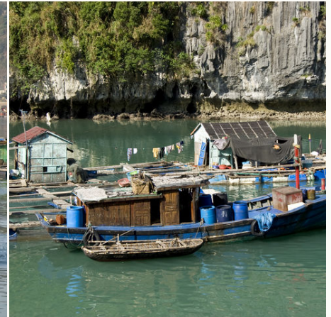
Schwimmendes Dorf in der Halong Bucht, Vietnam