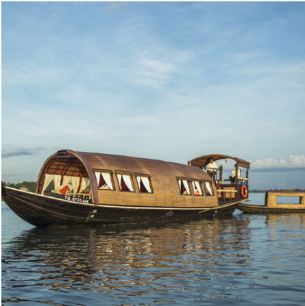
Sampan auf dem Mekongdelta, Vietnam