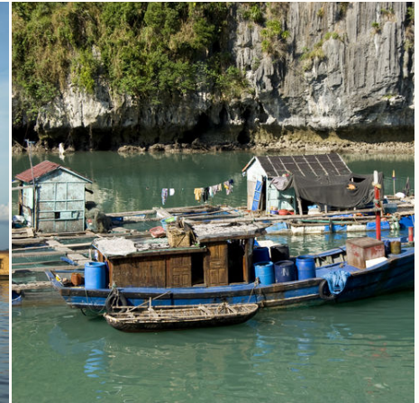
Schwimmendes Dorf in der Halong Bucht, Vietnam