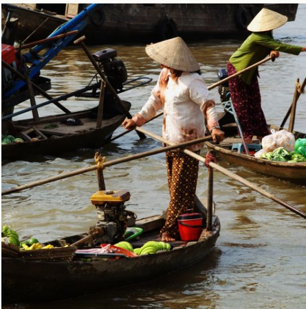
Geschäftiges Treiben auf dem Schwimmenden Markt im Mekongdelta, Vietnam