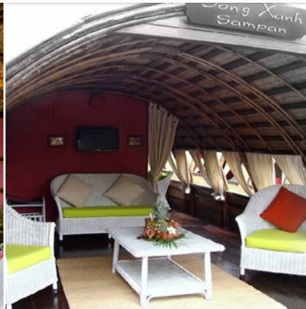
Wohnbereich in ihrer privaten Sampan, Vietnam