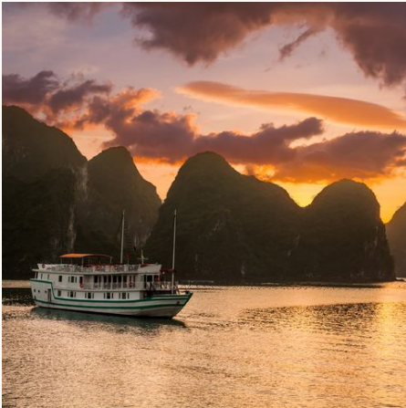
Sonnenuntergang in der Halong Bucht, Vietnam