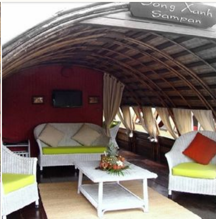
Wohnbereich in ihrer privaten Sampan, Vietnam