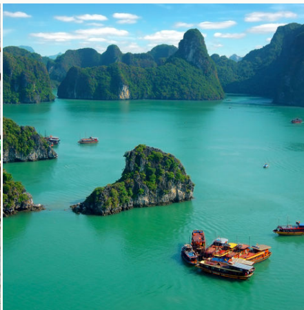
Malerische Halong Bucht, Vietnam