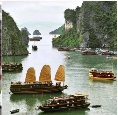
Dschunken in der Halong Bucht, Vietnam