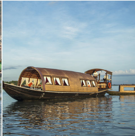
Sampan auf dem Mekongdelta, Vietnam