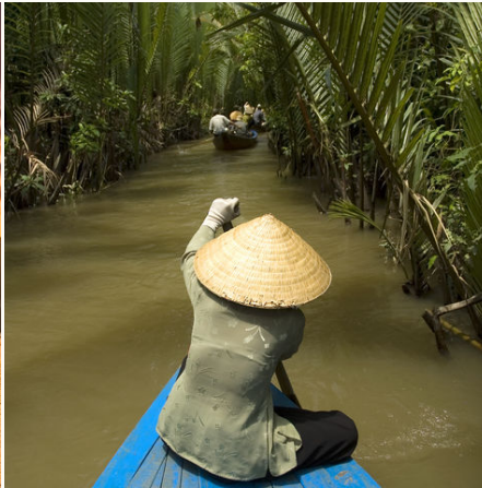
Per Sampan durch die Kanäle des Mekongdeltas, Vietnam