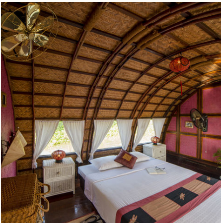
Schlafzimmer auf ihrer privaten Sampan, Vietnam

Wie klingt für Sie ein Abendessen bei Kerzenschein, während die untergehende Sonne einen rosa Schein auf die Kalkfelsen der Halong Bucht malt und die Ausflüge zu Höhlen und einsamen Buchten noch immer in Ihrer Erinnerung leuchten? Oder bevorzugen Sie ein Frühstück an Bord eines schnuckeligen Sampan-Bootes, während sich Ihr Gefährt durch romantische Wasserwege schlängelt und die Kinder Ihnen fröhlich vom Ufer aus zuwinken? Ziel ist ein schwimmender Markt: Ihren Proviant an süßen Früchten aufstocken! Hier haben Sie die Wahl zwischen zwei hochwertigen Kreuzfahrten, die – egal wie Sie sich entscheiden – sicher als ganz besonderes Erlebnis in Ihre Erinnerung an Vietnam eingehen werden. Beides lässt sich übrigens auch hervorragend in jede andere Vietnam-Reise integrieren!