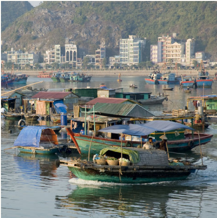
Hausboote in der Nähe der Cat Ba Insel, Vietnam