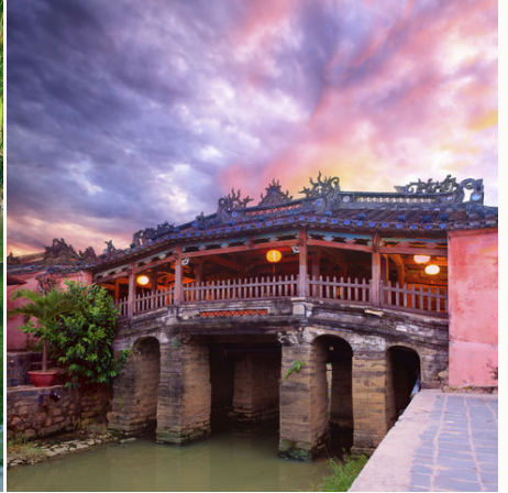
Japanische Brücke in Hoi An, Vietnam