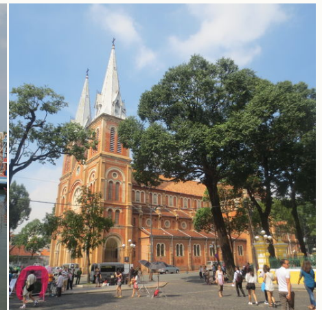
Die Kathedrale Notre Dame, Vietnam