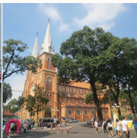
Die Kathedrale Notre Dame, Vietnam