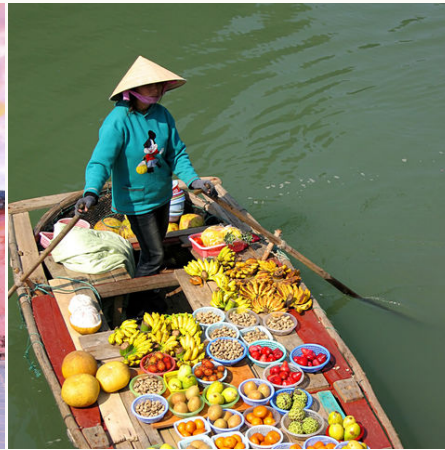
Schwimmender Markt, Vietnam