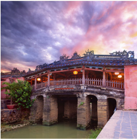
Japanische Brücke in Hoi An, Vietnam