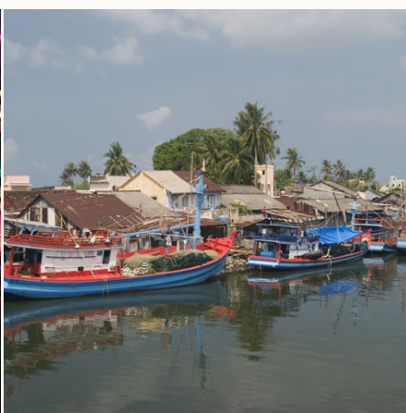
Fischerhafen von Phu Quoc, Vietnam