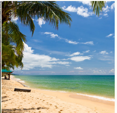
Strand auf Phu Quoc, Vietnam