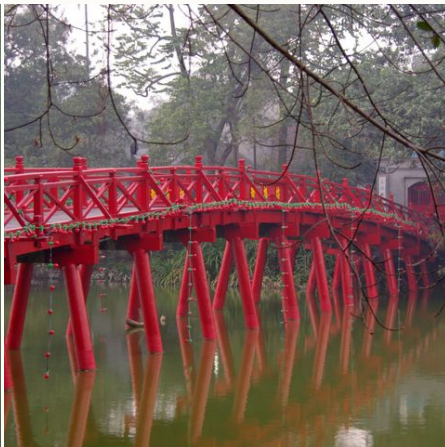
Rote Brücke in Hanoi #TITEL 1: Ein Traum aus Rot #TITEL 2: Rote Brücke über dem Hoan-Kiem-See, Vietnam