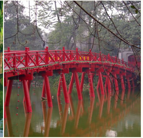
Rote Brücke über dem Hoan-Kiem-See, Vietnam