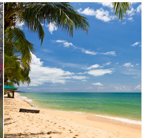
Strand auf Phu Quoc, Vietnam