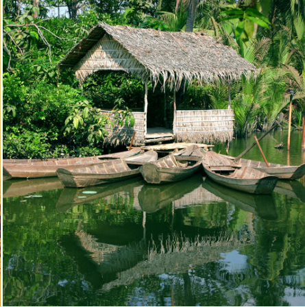
Hütte im Mekong Delta, Vietnam