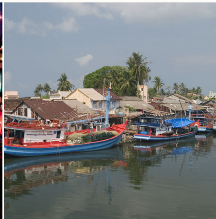
Fischerhafen von Phu Quoc, Vietnam