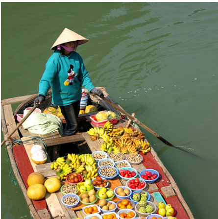
Schwimmender Markt, Vietnam