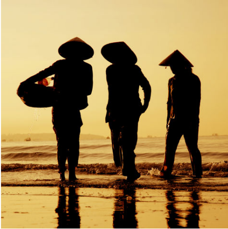
Fischer bei Sonnenuntergang, Vietnam