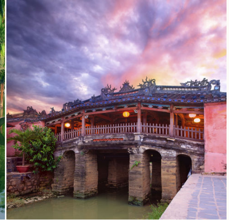
Japanische Brücke in Hoi An, Vietnam