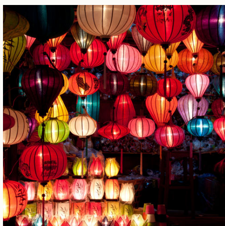
Bunte Lampions, Vietnam

✓ Verfügbar ⚠ Wenige Plätze - Ausgebucht ✓ garantierte Durchführung