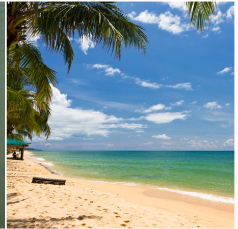
Strand auf Phu Quoc, Vietnam