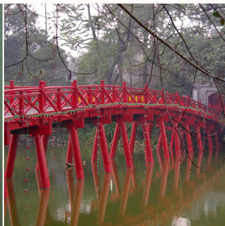
Rote Brücke in Hanoi #TITEL 1: Ein Traum aus Rot #TITEL 2: Rote Brücke über dem Hoan-Kiem-See, Vietnam