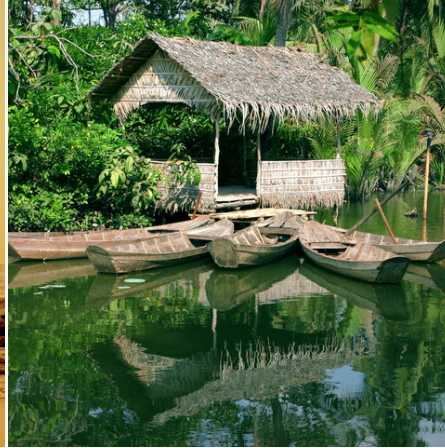
Hütte im Mekong Delta, Vietnam