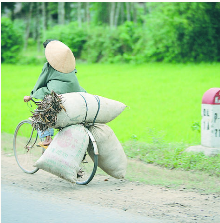
Transport per Fahrrad, Vietnam