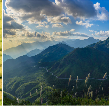
Berglandschaft von Sapa, Vietnam