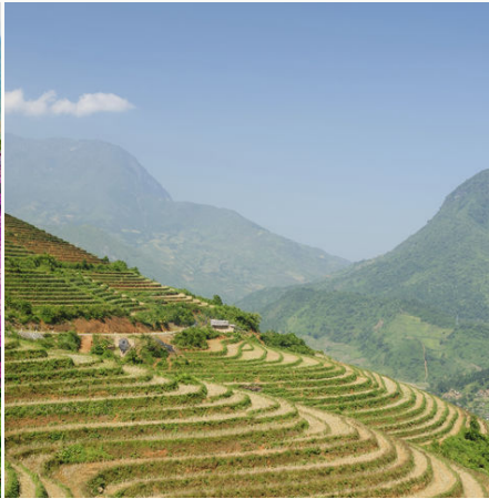
Reisterrassen in Nordvietnam, Vietnam