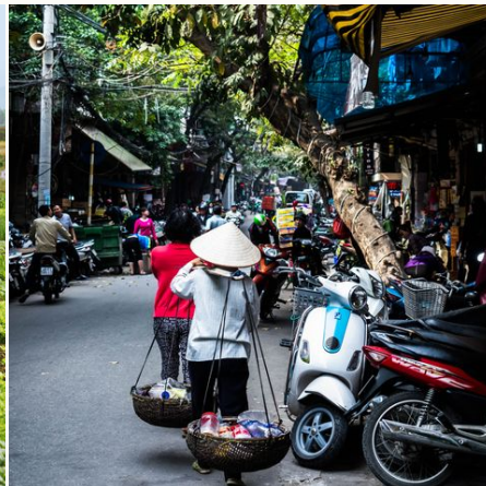
Straßenszene in Hanoi, Vietnam