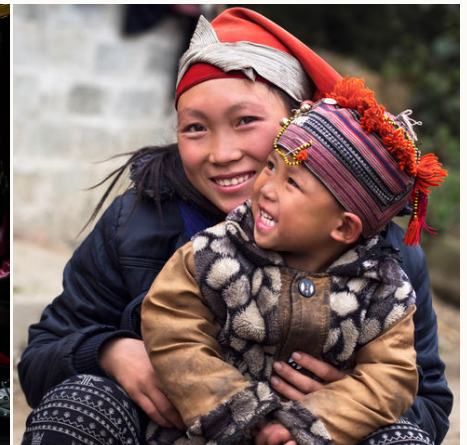
Rote Dao Frau mit Kind, Vietnam