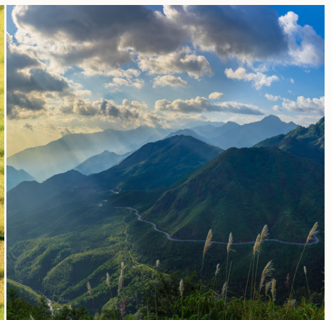
Berglandschaft von Sapa, Vietnam