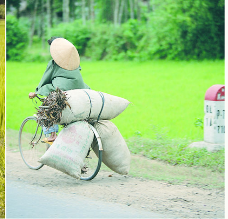
Transport per Fahrrad, Vietnam