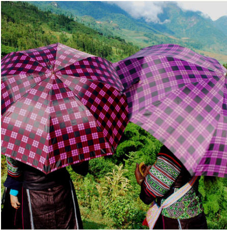
Sonnenschutz der Minderheiten in den Bergen, Vietnam

Wanderschuhe geschnürt und schon geht es drei Tage durch die Bergwelt rund um Sapa: Das Wasser funkelt auf den Reisterrassen in den Bergen, während in der Ferne schon kleine, rote Punkte erkennbar sind. Es handelt sich um die einzigartige Kopfbedeckung der Roten Dao. Diese laden Sie sogar zum Übernachten in einem traditionellen Haus im Dorf ein – genauso wie die freundlichen Tay in einem anderen Ort. In den 6 Tagen dieser Vietnam-Rundreise bleiben dies nicht die einzigen herzlichen Begegnungen mit den Minderheitenvölkern der nördlichen Bergregionen: Ein herzliches Highlight jedes Vietnamaufenthalts!