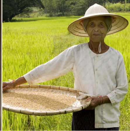
Bäuerin in Vietnam, Vietnam