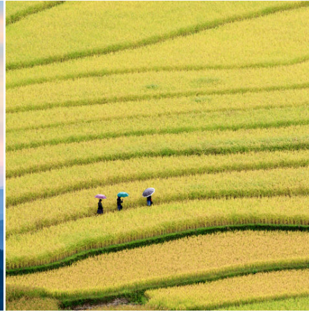
Ein paar Frauen schlendern durch Reisterrassen, Vietnam