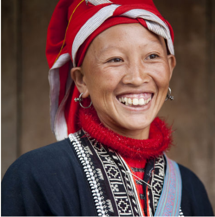
Rote Dao in Nordvietnam, Vietnam

Veranstalter: a&e erlebnis:reisen, eine Marke der Boomerang-Reisen GmbH Stand: 26.07.2023 (PL)