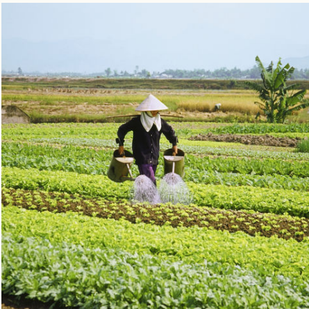
Vietnamesischer Farmer, Vietnam