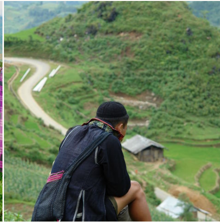
Black Hmong im Reisfeld in Nordvietnam, Vietnam