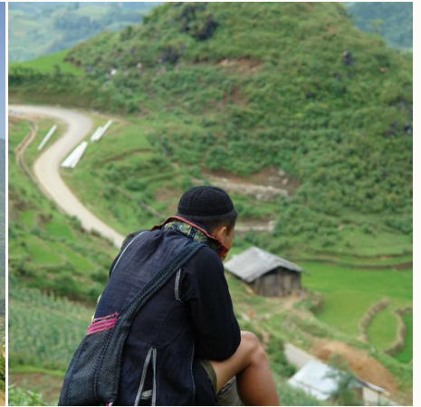
Black Hmong im Reisfeld in Nordvietnam, Vietnam