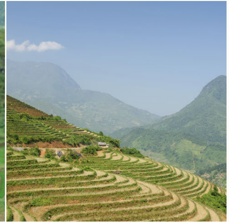
Reisterrassen in Nordvietnam, Vietnam