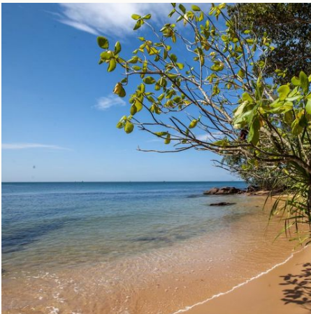
Privater Strandabschnitt des Resort, Vietnam

Lachende Fischer, bunt bemalte Boote und unberührte Strände an endlos langer Küste. Die idyllische Insel im Süden des Landes ist ein Eldorado für Erholungsuchende – der perfekte Ausklang einer Rundreise durch Vietnam.