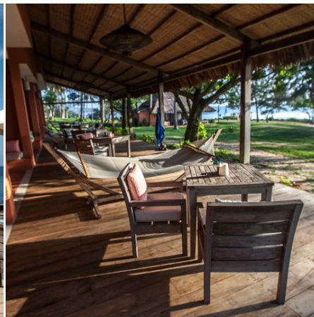
Blick die Terrasse der Veranda Rooms, Vietnam