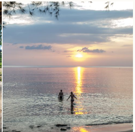
Schwimmen am privaten Strandabschnitt, Vietnam