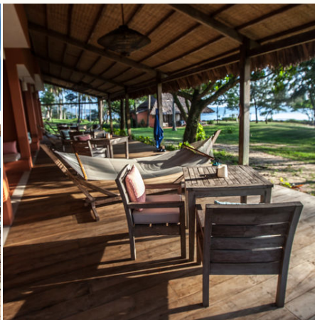
Blick die Terasse der Veranda Rooms, Vietnam