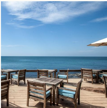
Die Restaurantterrasse mit Meerblick, Vietnam

Bitte beachten Sie, dass es zu Feiertagszeiten (Weihnachten, Neujahr, Tet-Festival usw.) zu Aufpreisen und zusätzlichen Verpflegungskosten kommen kann. Wir informieren Sie bei Buchung entsprechend.