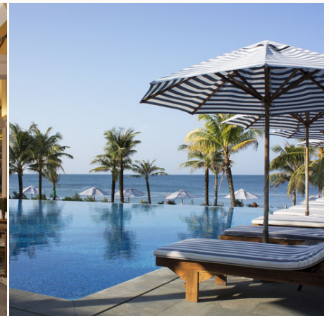
Blick vom Pool aufs Meer, Vietnam