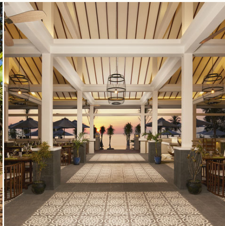
Das Restaurant "The spice house", Vietnam