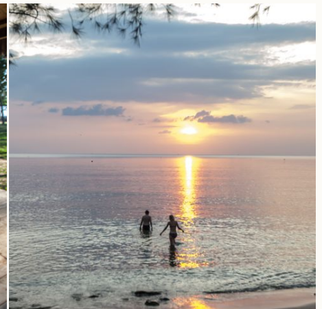
Schwimmen am privaten Strandabschnitt, Vietnam